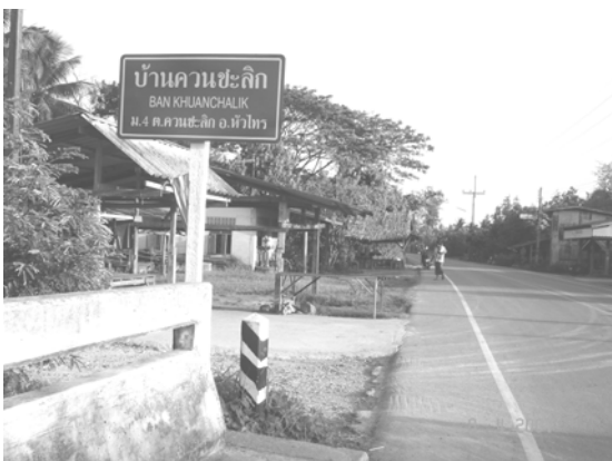
สภาพการตั้งหมู่บ้าน