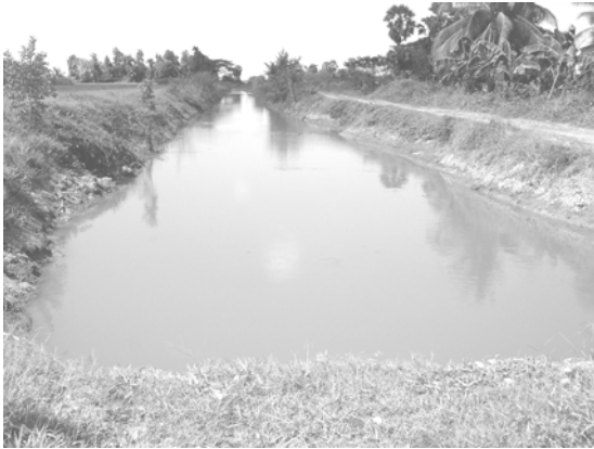
แหล่งน้ำเพื่อการเกษตร