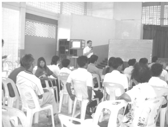
สร้างความเข้าใจการนำเสนอการสรุปปัญหาและโจทย์