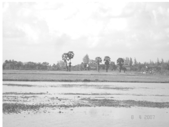
สภาพพื้นที่นาในพื้นที่วิจัย ตำบลควนชะลิก