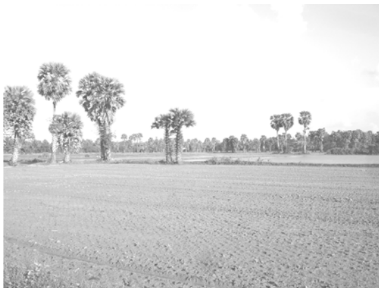
สภาพพื้นที่นาในพื้นที่วิจัย ตำบลควนชะลิก