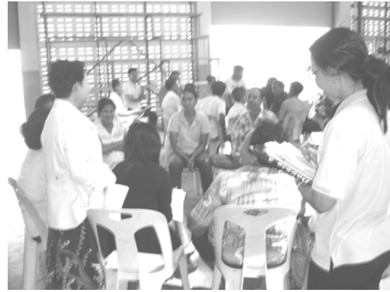
กลุ่มย่อยในเวทีร่วมวิเคราะห์ สังเคราะห์สรุปปัญหา