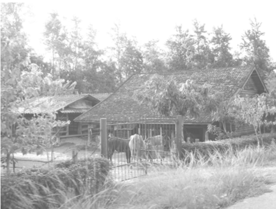
สภาพการตั้งบ้านเรือนของชุมชน