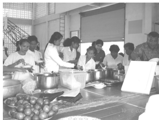
เสร็จเวทีภาคเข้าร่วมกันรับประทานอาหารพุดคูนกรอบ