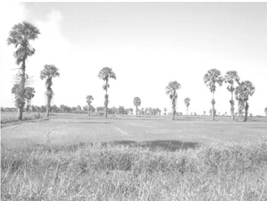
ภูมิทัศน์นาข้าวในชุมชน