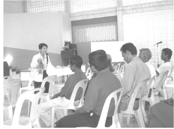
ผู้วิจัยสร้างความเข้าใจการวิเคราะห์สภาวะหัวใจทวิวิจัย