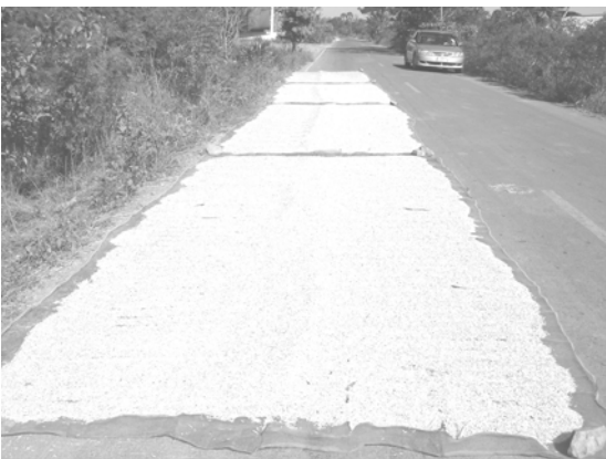
ถนนเป็นลานตากข้าวของชุมชน