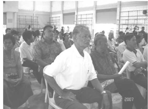
ชุมชนสนใจตั้งใจฟังการสร้างความเข้าใจการสรุปหัวใจ