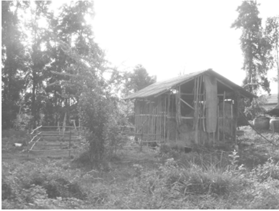
สภาพบ้านเรือนตำบลควนชะลิก