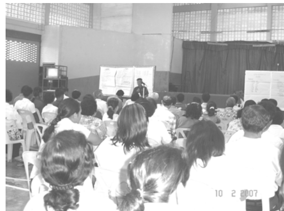
กลุ่มย่อยนำเสนอปัญหา โจทย์วิจัย