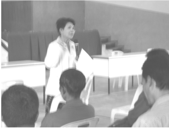
ผู้วิจัยสร้างความเข้าใจการวิเคราะห์สภาวะหัวใจทวิวิจัย