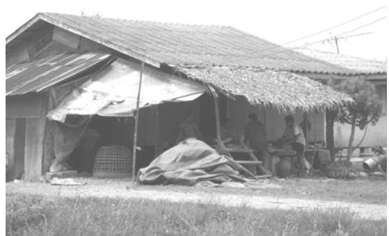
สภาพบ้านเรือนในปัจจุบัน