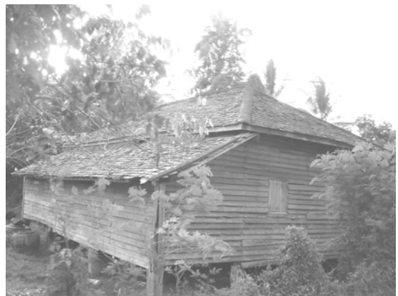
บ้านดั้งเดิมที่กระจายอยู่ทั่วไปทั้งตำบล