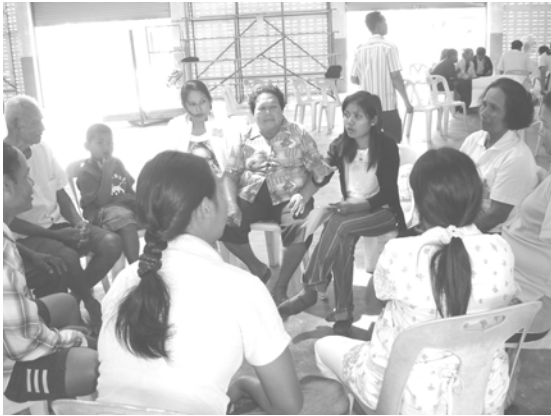
กลุ่มย่อยในเวทีร่วมวิเคราะห์ สังเคราะห์สรุปปัญหา