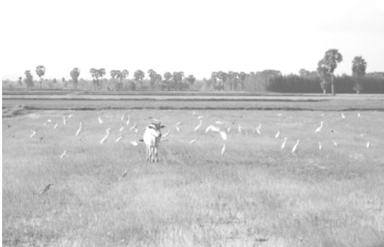
สภาพพื้นที่นาในพื้นที่วิจัย ตำบลควนชะลิก