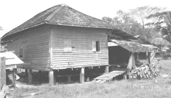
สภาพบ้านเรือนแบบโบราณ