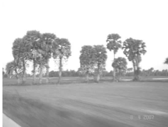
สภาพพื้นที่ ตำบลควนชะลิก