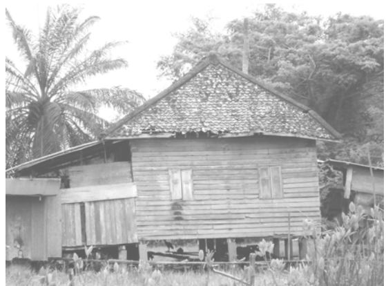
สภาพบ้านเรือนแบบโบราณ