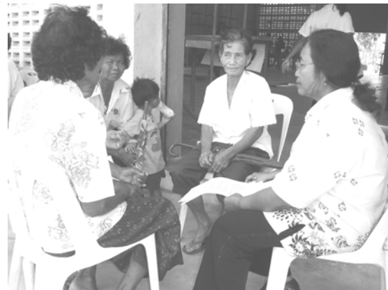
กลุ่มย่อยในเวทีร่วมวิเคราะห์ สังเคราะห์สรุปปัญหา