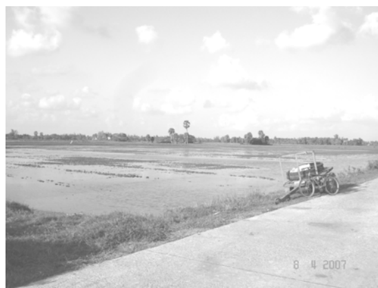
สภาพพื้นที่ ตำบลควนชะลิก