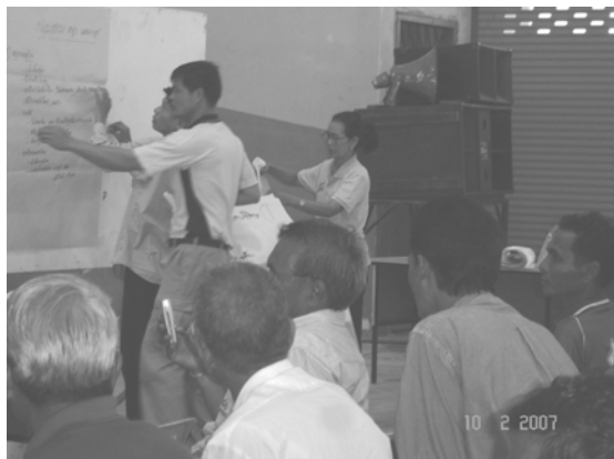
ชุมชน/กลุ่มย่อยเตรียมนำเสนอผลการสรุปปัญหาและโจทย์