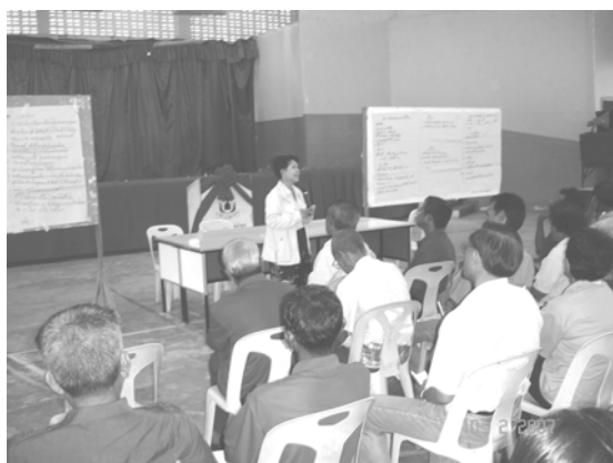
ผู้วิจัยสรุปโจทย์ที่จะพัฒนาด้วยการวิจัย