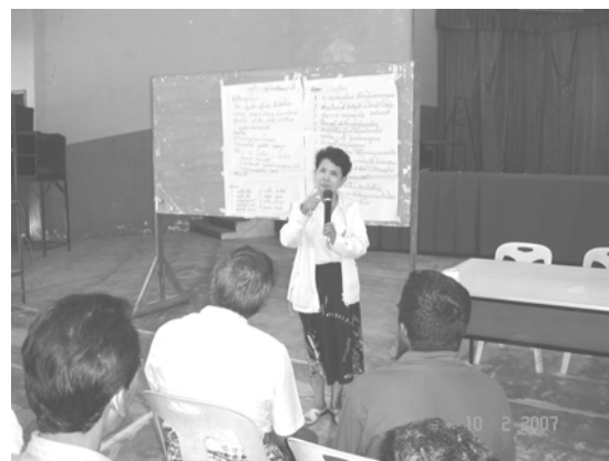
ผู้วิจัยสรุปโจทย์ที่จะพัฒนาด้วยการวิจัย