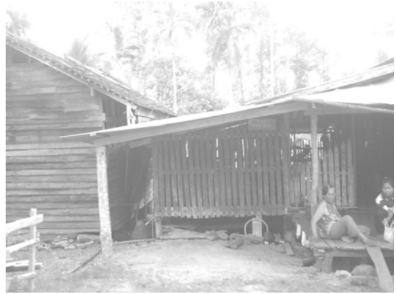
สภาพวิถีชีวิต บ้านเรือน ในตำบลควนชะลิก