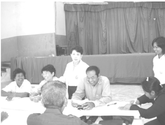
กลุ่มย่อยในเวทีร่วมวิเคราะห์ สังเคราะห์สรุปปัญหา