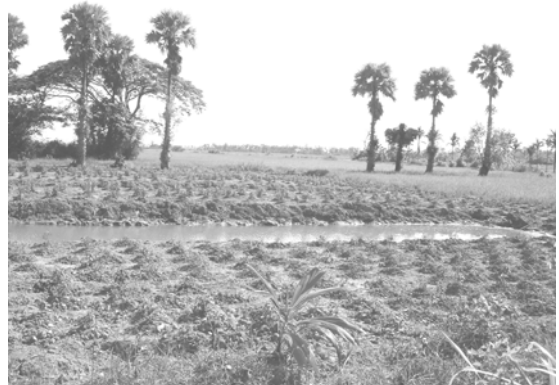
ไร่นาสวนผสม การปลูกพริกเพื่อส่งออก