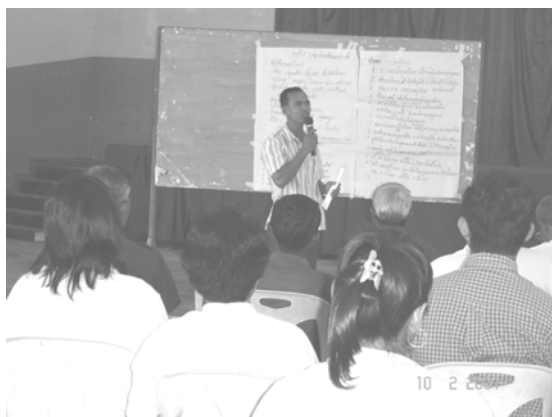
นายกอบต. ทีมวิจัยหลักร่วมการสรุปปัญหาและโจทย์วิจัย