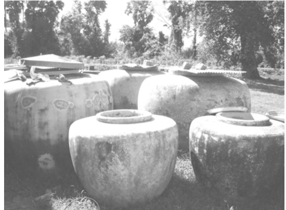
น้ำเพื่ออุปโภคบริโภคของครัวเรือน