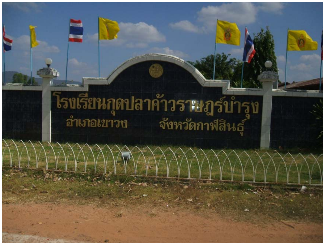
โรงเรียนในชุมชน

มัธยมศึกษา เด็กนักเรียนที่เรียนจบชั้นประถมศึกษาแล้วจะเรียนต่อในระดับมัธยมศึกษาตอนต้น ที่โรงเรียนกุดปลาเค้าราษฎร์บำรุง ซึ่งเป็นโรงเรียนในระดับประถมได้ขยายโอกาสถึงระดับชั้น มัธยมศึกษาปีที่ 3 ซึ่งอยู่ในพื้นที่ ตำบลกุดปลาเค้า