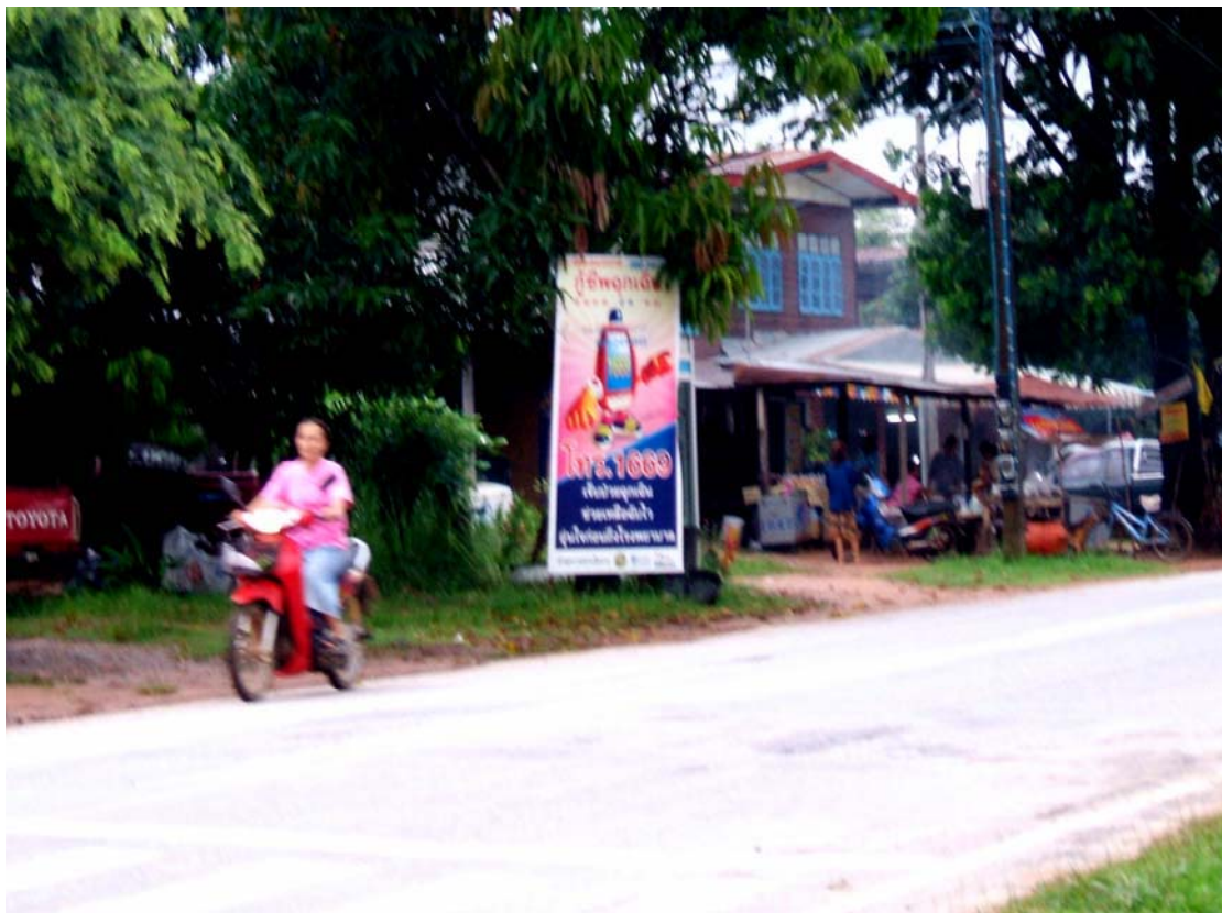
ร้านขายอาหารในชุมชนในตอนเช้า

และเนื้อหมู ทุกวัน และมีสวนอาหารต่าง ๆ อยู่ล้อมรอบพื้นที่ชุมชน มีทั้งที่เปิดบริการด้านอาหารและเครื่องดื่ม และให้บริการทั้งความบันเทิง มีผู้ร้องเพลงคาราโอเกะแบบหยอดเหรียญ และมีทั้งนักร้องสาวสวยคอยร้องเพลงให้ฟัง มีร้านที่ให้บริการอินเทอร์เน็ตจะให้บริการด้านเกมส์อินเทอร์เน็ต และในวันอาทิตย์ของทุกสัปดาห์จะมีตลาดนัดสินค้าต่าง ๆ ที่จัดขึ้นในพื้นที่ตลาดสดของเทศบาลตำบลกุสุมาลย์ ซึ่งอยู่ห่างจากชุมชนประมาณ 1,500 เมตร ซึ่งเป็นแหล่งรวมสินค้าทั้งที่เป็นอาหารสด อาหารแห้ง อาหารสำเร็จรูป และเครื่องใช้สอยชนิดต่าง ๆ รวมทั้งเครื่องนุ่งห่มหลากหลายชนิด