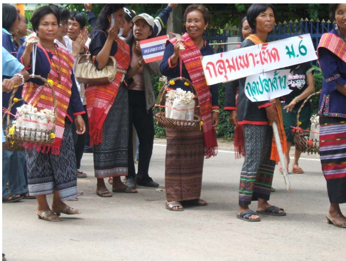
ชุมชนเข้าร่วมกิจกรรมประเพณีแห่เทียนเข้าพรรษาของหน่วยงานภาครัฐ

ส่วนผู้ที่มาร่วมงานถ้าเป็นงานศพของบุคคลที่นับหน้าถือตาในสังคมจะมีการวางพวงหรีดเป็นการแสดงความเสียใจซึ่งมีราคาก่อนข้างแพง