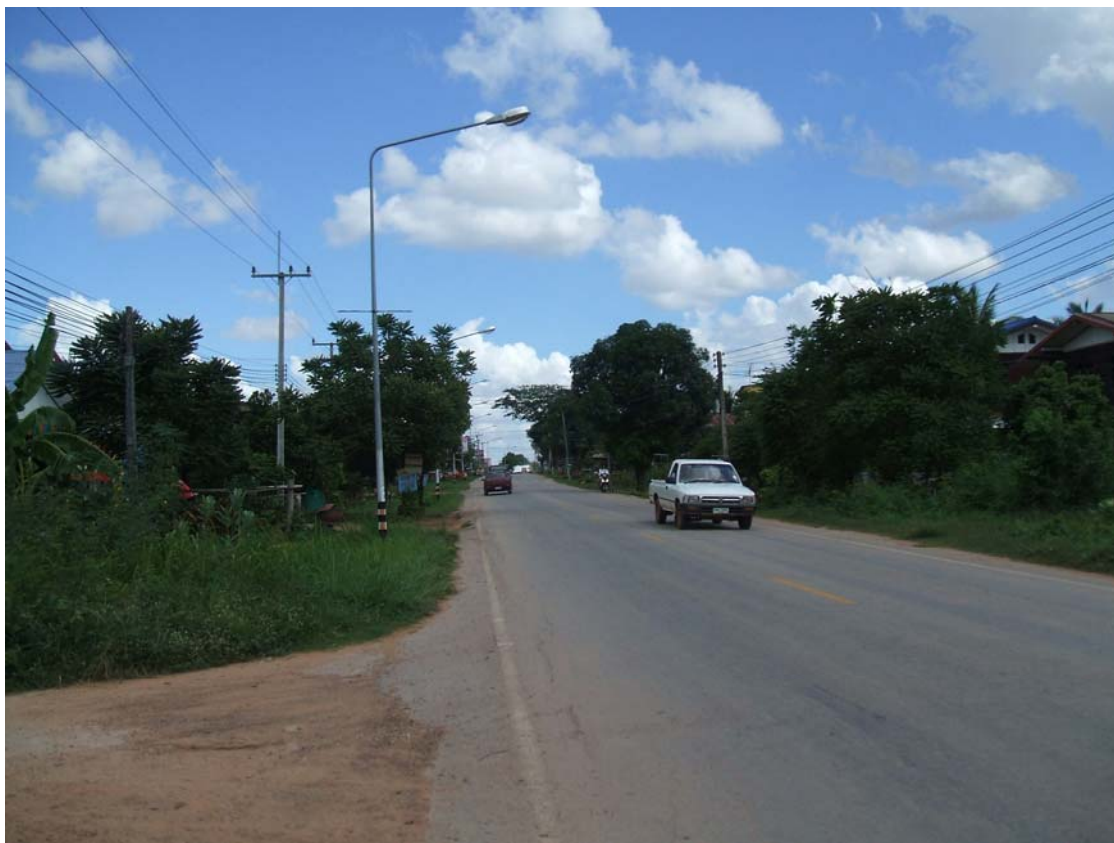
ถนนสายหลักที่ใช้ติดต่อกับชุมชนภายนอก

ซึ่งรถประจำทางส่วนใหญ่ได้วิ่งผ่านชุมชนวันละ หลายรอบ ส่วน เส้นทางในการคมนาคมภายในชุมชนเองเป็นถนนคอนกรีตและมีการแบ่งเขตหมู่บ้าน โดยใช้ถนนเป็นเส้นแบ่งเขต มีไฟฟ้าส่องสว่างในช่วงกลางคืนตามถนนตลอดสาย ทุกครัวเรือนมีไฟฟ้าใช้ ส่วนน้ำที่ใช้อุปโภคบริโภคส่วนใหญ่จะใช้น้ำประปาส่วนภูมิภาค และใช้น้ำจากบ่อบาดาลใต้ดินใช้เองในครอบครัว และในชุมชนเองมีแหล่งน้ำหนองโสนที่อยู่ทางทิศเหนือของหมู่บ้านซึ่งมีชาวบ้านบางส่วนใช้ประโยชน์ในการหาอยู่หากินและใช้น้ำในการอุปโภคบริโภค และส่วนใหญ่ชาวบ้านจะมีโอ่งแดง และโอ่งมังกรใช้รองน้ำฝนไว้ดื่ม ส่วนใหญ่จะไม่เพียงพอให้ดื่มตลอดปีจึงต้องได้ซื้อน้ำดื่มจากพ่อค้าขายน้ำดื่มในช่วงฤดูแล้งซึ่งมีทั้งที่เป็นน้ำจากบ่อธรรมชาติซึ่งมีทั้งที่นำน้ำบรรจุใส่ถังขนาดใหญ่บรรจุทุกรถยนต์ 4 ล้อ และ 6 ล้อมาเร่ ขาย คิดราคาตามปริมาณที่รองรับน้ำ คือโอ่งแดงขนาดใหญ่ โอ่งละ 120 บาท โอ่งมังกร มีทั้ง 12 บาท และ 15 บาท และน้ำที่กรองจากน้ำประปาบรรจุขวดและถัง ซึ่งมีเจ้าของเป็นคนในพื้นที่ใกล้เคียงนำมาขายเช่นกัน