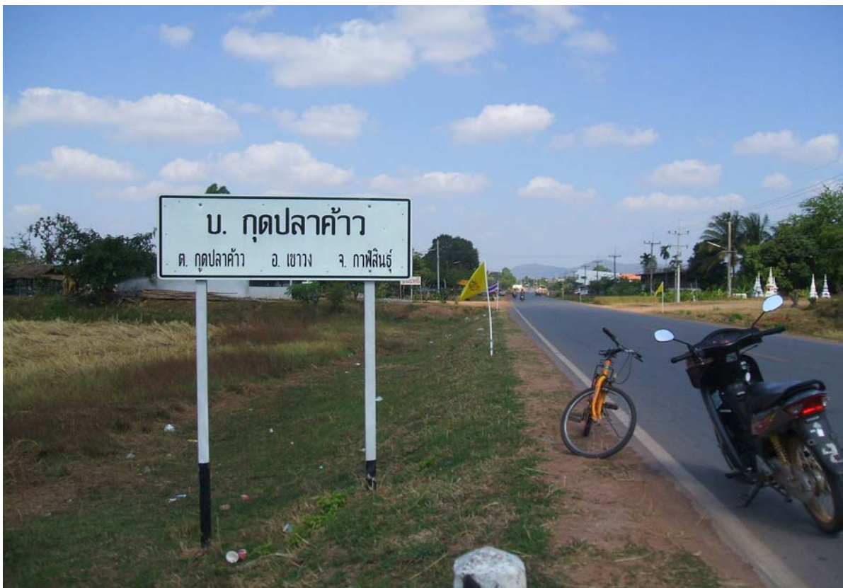
ทางเข้าเขตพื้นที่บ้านกุดปลาเค้า