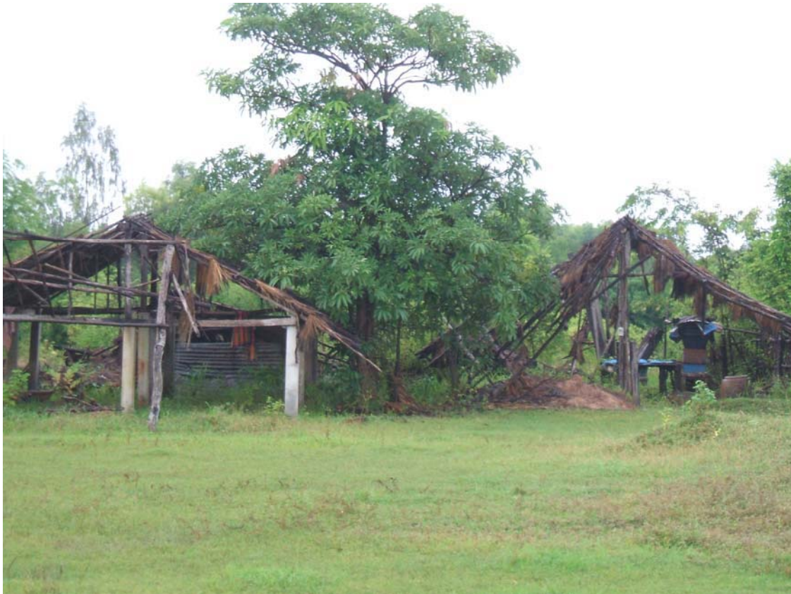
โรงเรียนป็นอุป็นไหญ่ที่ถูกทิ้งร้าง

เมื่อปี พ.ศ. 2502 ในหมู่บ้านใกล้เคียงคือบ้านกุดสิม มีผู้เล่าว่าสมัยนั้นมีรถบรรทุกสินค้าเจ้าของรถเป็นชาวนวนเหนือที่อพยพมาอยู่ในท้องถิ่นนั้น ซึ่งได้นำสินค้าจากท้องถิ่นไปค้าขายแลกเปลี่ยนในจังหวัดกาฬสินธุ์ ซึ่งจะเดินทางจากกุดสิมไปทางอำเภอกุดฉิมนารายณ์ เข้าไปในตัวจังหวัดซึ่งขากลับจะนำสินค้าจากในเมืองมาขายและแลกเปลี่ยนกับคนในท้องถิ่นด้วย การเดินทางเป็นเส้นทางดินทราย เมื่อรถติดจะต้องช่วยกันเช็ญ