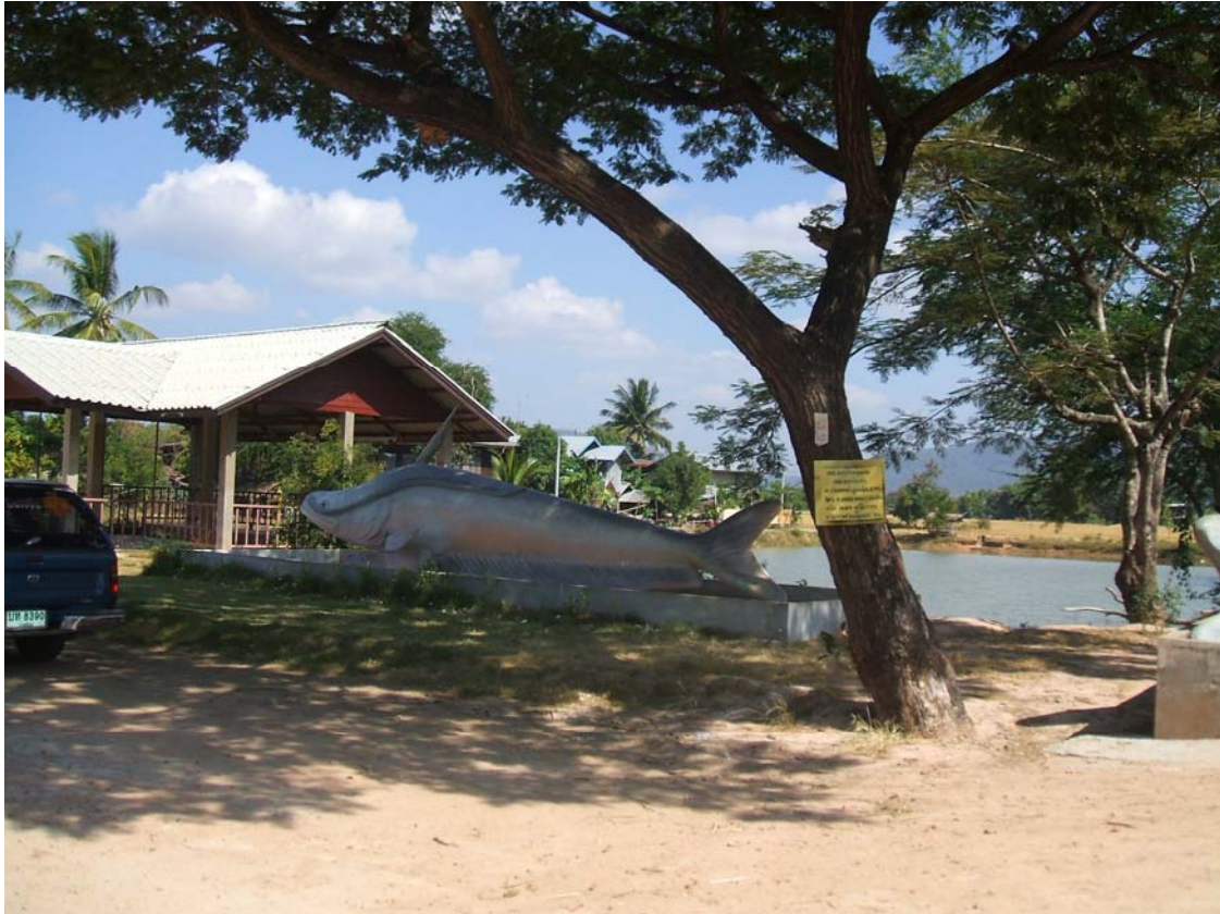
แหล่งน้ำหนองโสน