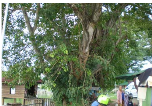
ต้นโพธิ์ข้างหนองน้ำ