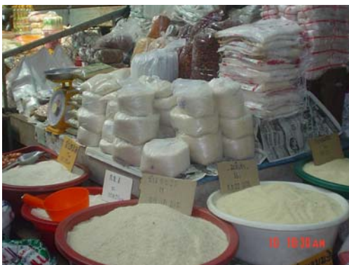
ร้านขายข้าว