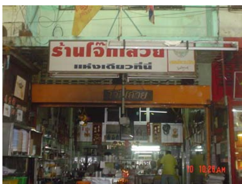
ร้านโจ๊กเสวย