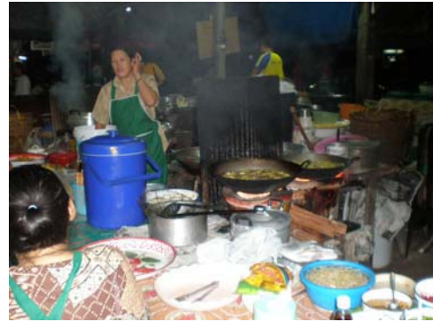
ร้านขายขนมเส้น