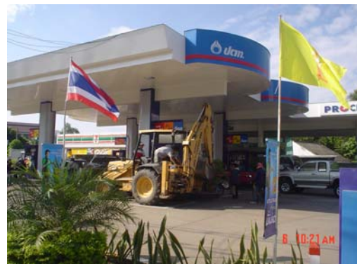
รถที่มาเติมน้ำมัน