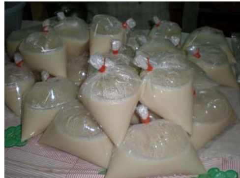
น้ำเต้าหู้