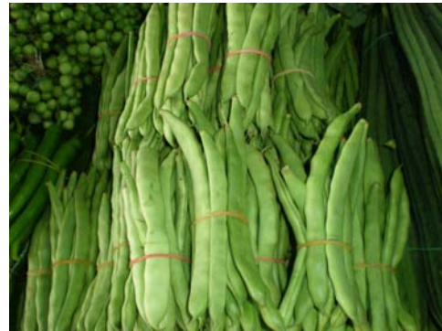
ถั่วแมงจิ (ถั่วแขก)