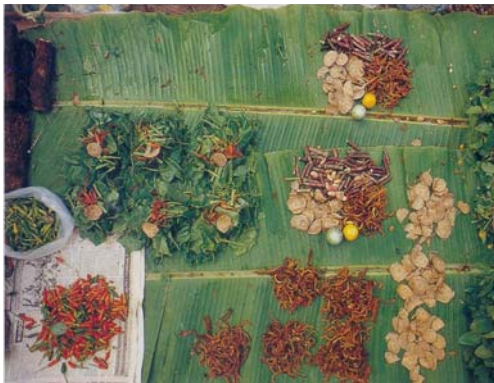
ผักจะขายเป็นกองๆ