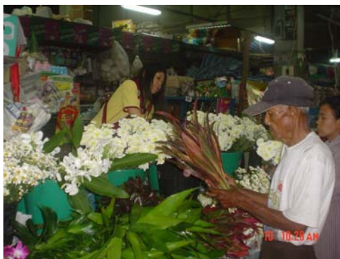
ร้านขายดอกไม้