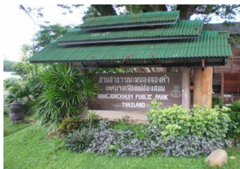
สวนสาธารณะหนองจองคำ