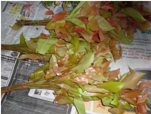
ดอกสะเป่ (ใบหว่า)