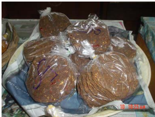
ถั่วเน่าแผ่น