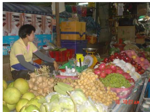
ร้านขายผลไม้