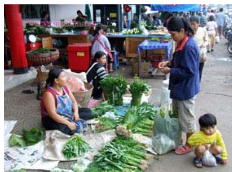
ชาวบ้านนำผักมาขาย