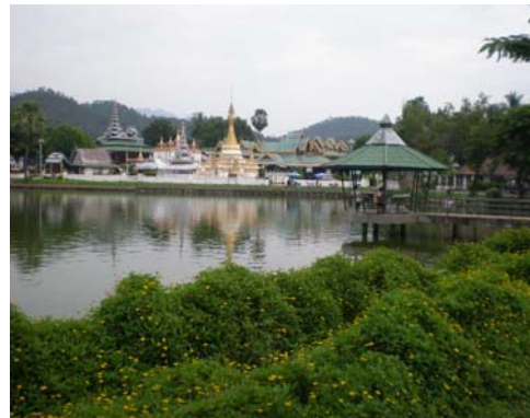
หนองจองคำในปัจจุบัน