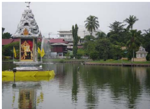
หนองจองคำ