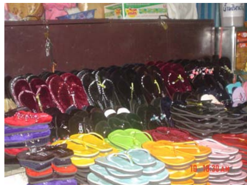
ร้านขายรองเท้า