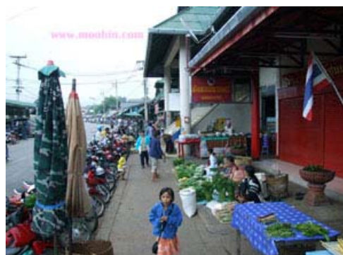
ชาวบ้านนำผักมาขาย