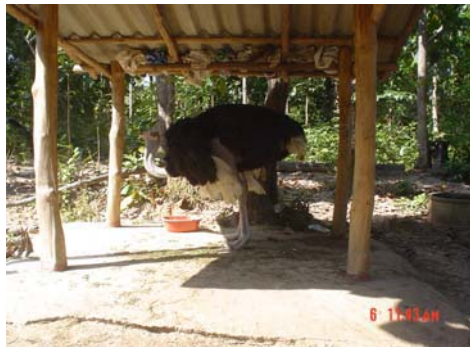
นกกระเจือกเทศ