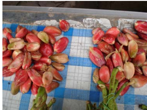
หมากต่อมจ้อก