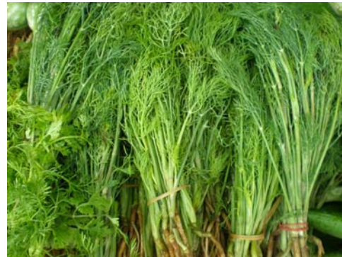
ผักชีฝรั่ง (ผักชีลาว)