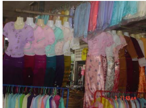
ร้านขายเสื้อผ้าโต