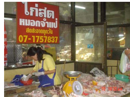
ร้านขายอาหารสด