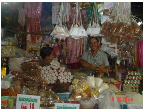
ร้านขายของชำ