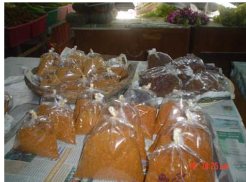
น้ำพริกผง