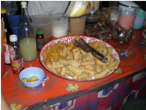
กล้วยทอด (เต้าฮู้ทอด)