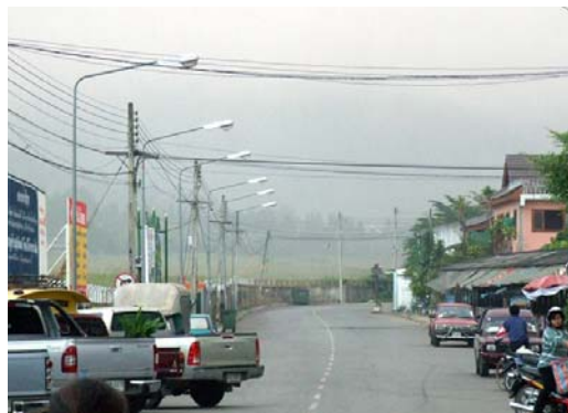
ถนนด้านทิศเหนือของตลาด