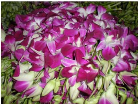
ดอกกล้วยไม้