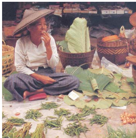
ยายนำผักมาขายที่ตลาด