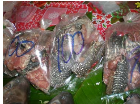
เนื้อแลน (เนื้อตะกวด)