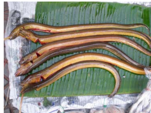
ปลาเหียน (ปลาไหล)