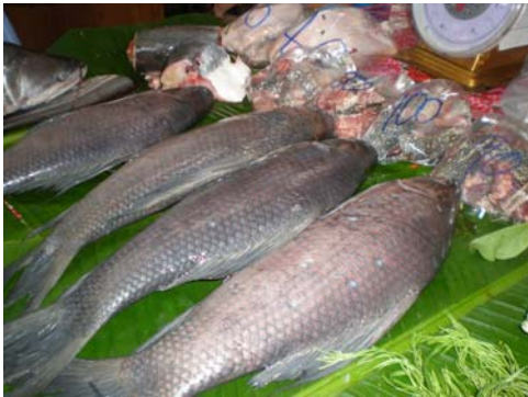
ปลาเส้า (ปลาเพี้ย)