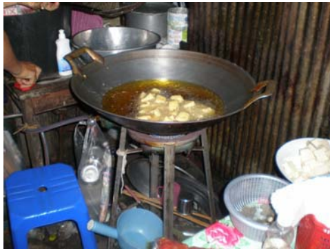
กำลังทอดกล้วย