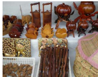
สินค้าที่ขายภายในร้าน