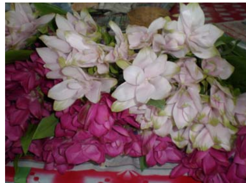
หมอกอ้าว (ดอกกระเจียว)