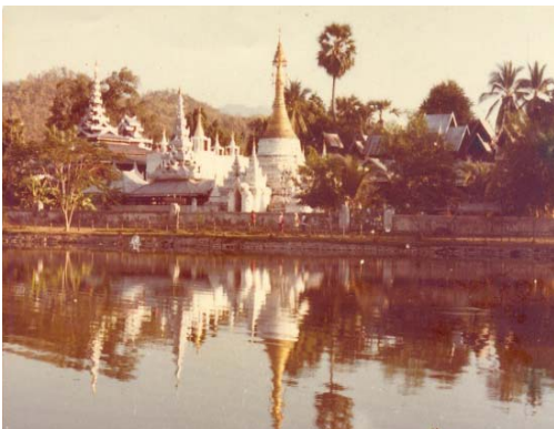
หนองจองคำ