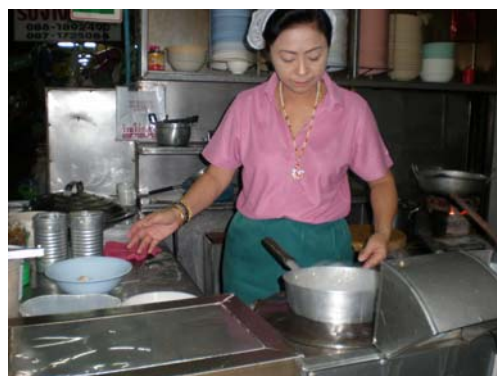
โจ๊กทานเป็นอาหารเช้า

ปัจจุบันตลาดสด ตั้งอยู่ใกล้วัดหัวเวียง บนถนนสิงหนาทบำรุง ตอนเช้าตรู่เมื่อเข้าไปในตลาดจะเปรียบเหมือนได้สัมผัสกับชีวิตของผู้คนในท้องถิ่น ซึ่งพ่อค้าแม่ค้าจะนำสินค้ามาขายในตลาดเมืองแม่ฮ่องสอน รวมทั้งอาหารใต้ ขนมใต้ เครื่องแต่งกายชุดใต้ และของฝากจากเมืองแม่ฮ่องสอน ปัจจุบันตลาดจะเริ่มขึ้นตั้งแต่รุ่งสางไปจนถึงเย็นของทุกวัน นักท่องเที่ยว สามารถชมวิถีชีวิตดั้งเดิมของชาวแม่ฮ่องสอนได้ ไม่ว่าจะเป็นการแต่งกายตามแบบไทใหญ่หรือชาวเขาที่มาซื้อสินค้า อาหารพื้นเมืองรวมทั้งพืชผัก ผลไม้ท้องถิ่นสด ๆ (เวลาที่เหมาะสมสำหรับการชมตลาดเช้า ควรเริ่มตั้งแต่เช้ามืดถึงประมาณ 09.00 น. ) ในบริเวณหน้าตลาดประชาชนและนักท่องเที่ยวจะนิยมทำบุญตักบาตรพระสงฆ์ และรับประทานอาหารเช้าตามร้านในตลาด (สืบค้นจาก www.mmhs.go.th/56k/travel109.html - 36k)