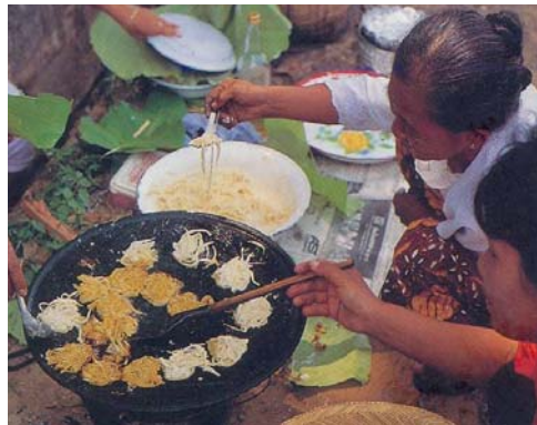
ทอดข้างปอง