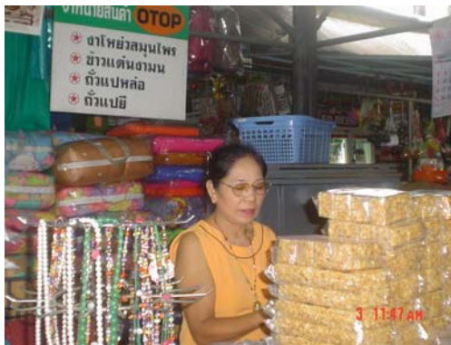
ร้านของฝาก