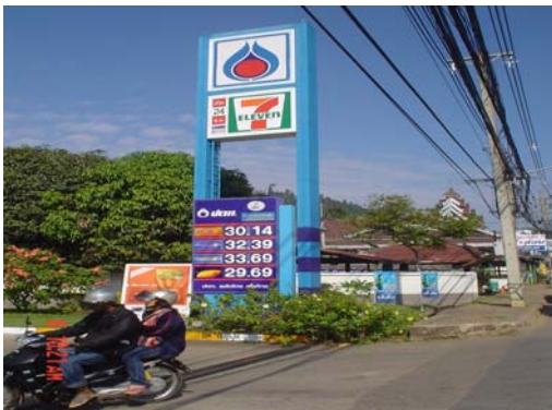
ด้านหน้าปั้ม ปตท. สาขาแม่ฮ่องสอน