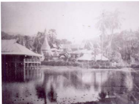
หนองจองคำในอดีต