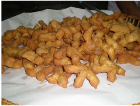
ปาท่องโก๋