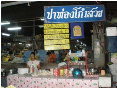
ร้านปาท่องโก๋เสวย