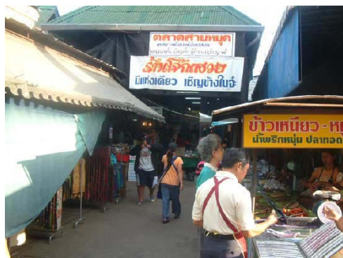
ตลาดสายหยุด