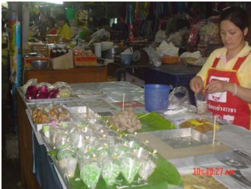
ร้านขายขนมหวาน