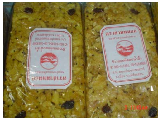
ข้าวซอยตัด