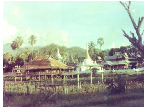
ศาลาจำศีลกลางน้ำ