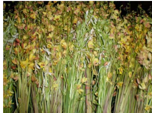
ดอกตางจ้อด