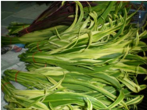
ดอกจู้หมาก