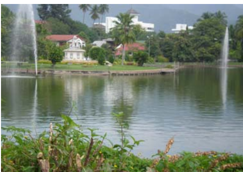
น้ำพุกลางหนอง