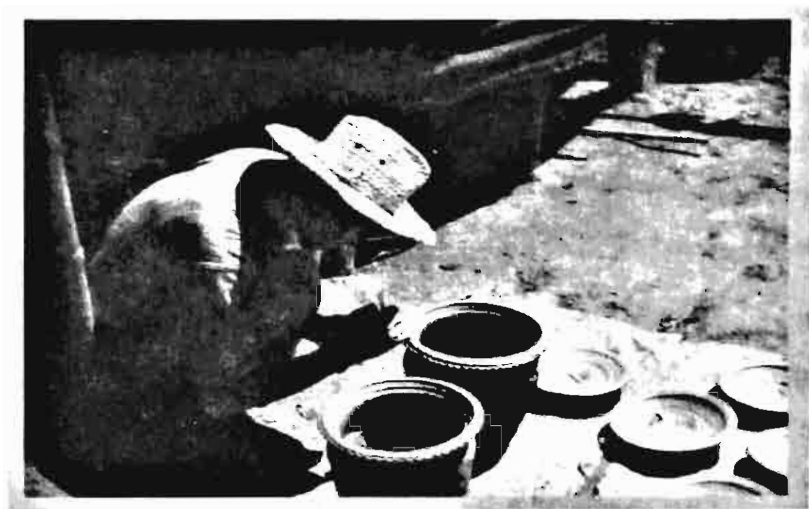
■ ครูอ้นเรียนปั้นกับแม่หญิงที่บ้านกระทิว