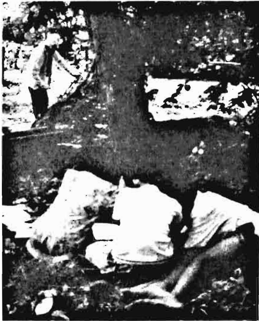
■ เด็กๆ เริ่มเข้ามาป้วนเปี้ยนในพื้นที่ของครู