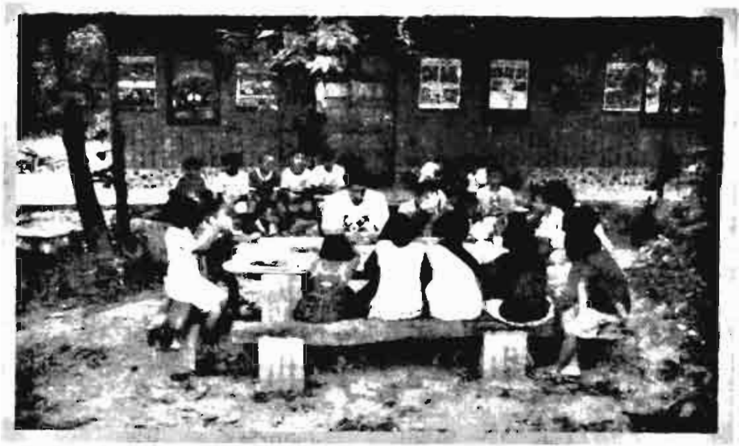
■ ฟ้าบ้าน : บอร์ดนิทรรศการของครู