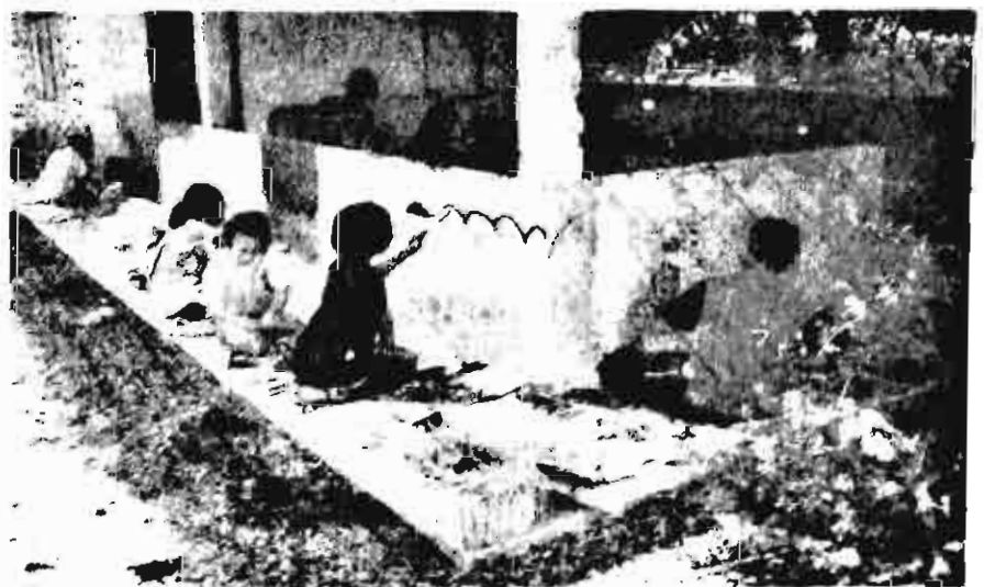
■ ฟากฝีมือไว้ที่กำแพง "เรือนหนังเสือ"