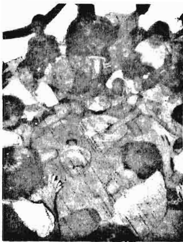
■ เด็กช่วยกันทำบิวลอยคุณภาพ