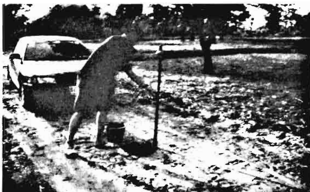
■ ครุภัณฑ์เกษตรไปตากทำปุ๋ย