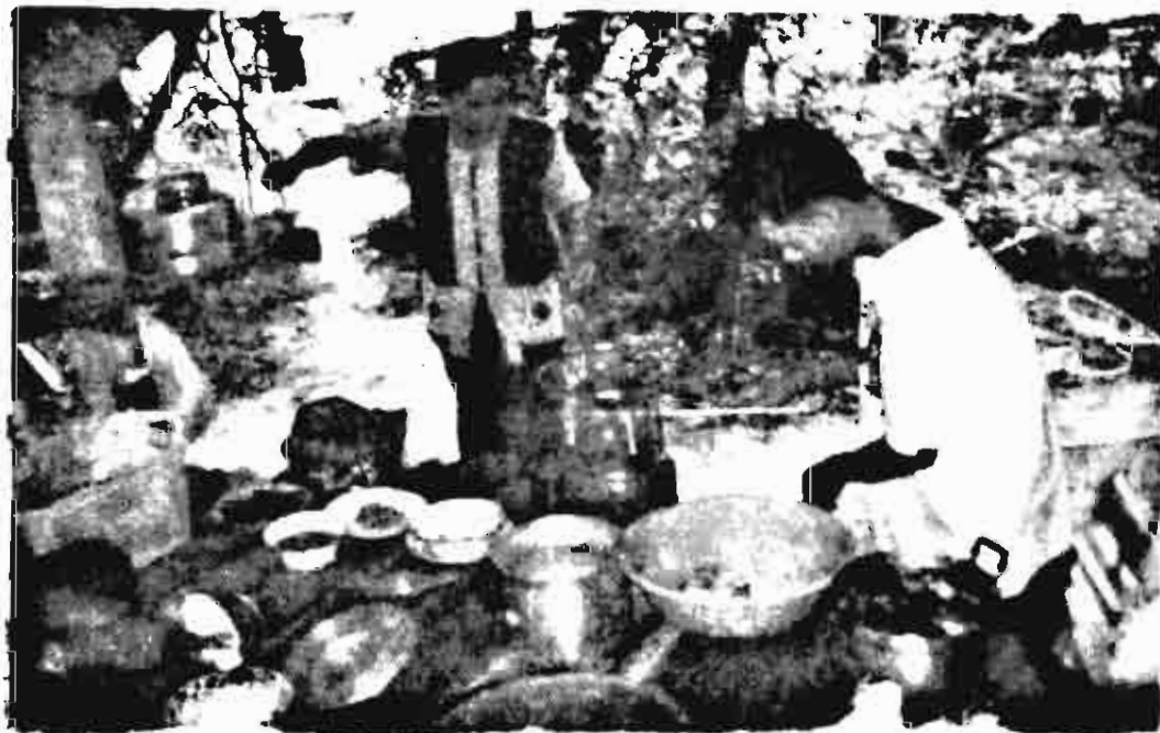
■ ครูและเพื่อนบ้านช่วยกันทำอาหารให้เด็ก