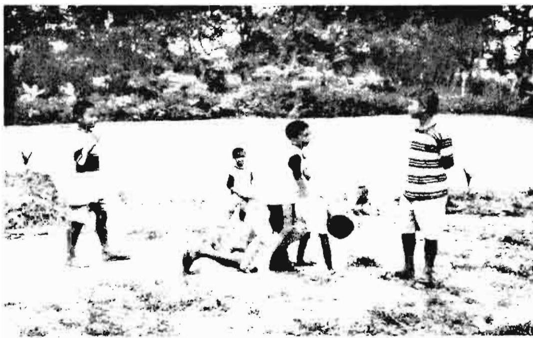
■ เด็กๆ เล่นนิทานประกอบการแสดงให้ครูดู