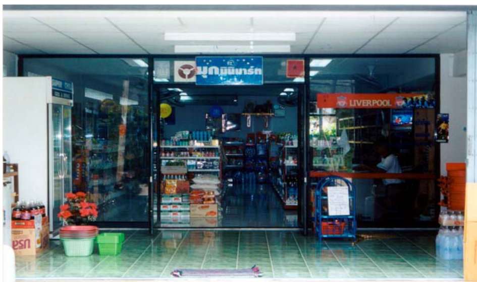
ภาพที่ 5.6 ร้านมินิมาร์ทที่บ้านหนองพังนาค จ.ชัยนาท

ที่บ้านใหม่เพิ่มขึ้นจาก 1 ร้าน ในปี ค.ศ.1992 เป็น 4 ร้าน ในปี ค.ศ.1999 (ตารางที่ 5.13) ตัวเลขในตารางที่ 5.13 พึงตีความด้วยความระมัดระวังเพราะในปี ค.ศ.1999 เป็นปีที่อยู่ในภาวะวิกฤตเศรษฐกิจ จึงมีผลให้กิจการร้านค้าและธุรกิจในบางหมู่บ้านได้ปิดตัวลง จึงทำให้ตัวเลขของกิจการร้านค้าในหมู่บ้านเพิ่มขึ้นอย่างเชื่องช้าในช่วงปี ค.ศ.1992 – 1999 นอกจากนี้ตัวเลขในตารางที่ 5.13 มิได้รวมกิจกรรมร้านค้าที่จำหน่ายปัจจัยการผลิต เช่น เมล็ดพันธุ์พืช ปุ๋ย เครื่องจักรกลทางการเกษตร ซึ่งก็มีการขยายตัวเช่นกัน ในทศวรรษ 1990 จึงมีผลให้ตัวเลขของร้านค้าในตารางที่ 5.13 ต่ำกว่าที่ควรจะเป็น อย่างไรก็ตามอาจกล่าวได้ว่ากิจการร้านค้าในหมู่บ้านได้มีการขยายตัวพอสมควรในทศวรรษ 1990