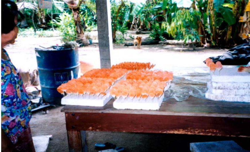
ภาพที่ 5.1 ดอกไม้ประดิษฐ์ที่บ้านกุคจอก จ.ชัยนาท