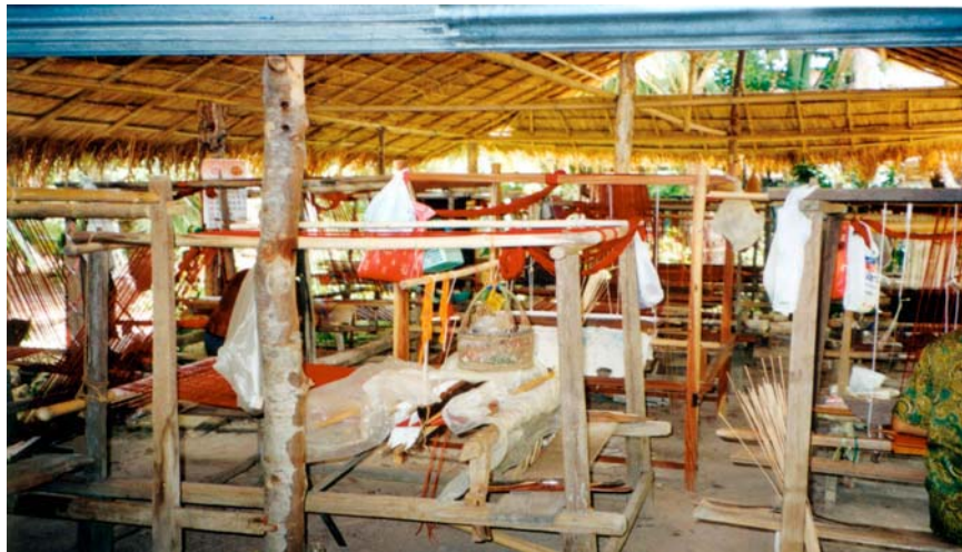
ภาพที่ 5.3 อุปกรณ์การทำสิ่งทอ และผ้าไหม ที่บ้านกุดจอก จ.ชัยนาท

บ้านหนองพังนาคมีครัวเรือนซื้อปักอ้อเพิ่มขึ้นจาก 10 ครัวเรือน ในปี ค.ศ.1992 และเพิ่มเป็น 16 ครัวเรือน ในปี 1994 และเพิ่มเป็น 25 ครัวเรือน ในปี ค.ศ.1999 บ้านกุดจอกมีครัวเรือนใช้รถปักอ้อเท่ากับ 10 ครัวเรือน ในปี ค.ศ.1994 และเพิ่มขึ้นเป็น 16 ครัวเรือน และ 18 ครัวเรือน ในปี ค.ศ.1996 และ 1999 ตามลำดับ ที่บ้านหนองชุมพร ครัวเรือนมีรถปักอ้อเพิ่มจาก 4 ครัวเรือน ในปี ค.ศ.1992 และเพิ่มขึ้นเป็น 15 ครัวเรือน และ 22 ครัวเรือนในปี ค.ศ.1999 และที่บ้านใหม่ ครัวเรือน