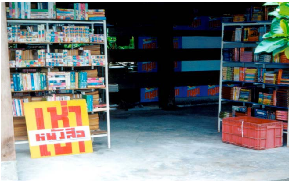
ภาพที่ 5.5 ร้านให้เช่าหนังสือบ้านหนองพังกา จ.ชัยนาท

แสดงว่า ครั้วเรือนที่ทำนาคือ หนองพังกาและกุดจอก ได้จ้างรถไถโดยเฉพาะรถไถขนาดเล็กเพื่อการทำงานสูงถึง 57 ครั้วเรือน และ 44 ครั้วเรือน ในปี ค.ศ.1992 และเพิ่มขึ้นเป็น 60 ครั้วเรือน และ 111 ครั้วเรือน ในปี ค.ศ.1999 ส่วนบ้านหนองชุมพร ในปี ค.ศ.1992 ไม่มีการจ้างรถไถขนาดเล็กและขนาดใหญ่ แต่ในปี ค.ศ.1999 มีครั้วเรือนถึง 51 ครั้วเรือน จ้างรถไถขนาดใหญ่เพื่อทำนาและทำฟาร์มเลี้ยงกุ้ง ส่วนที่บ้านใหม่ในปี ค.ศ.1999 มีการจ้างรถไถขนาดเล็กและขนาดใหญ่เท่ากับ 15 ครั้วเรือน และ 27 ครั้วเรือนตามลำดับ (ตารางที่ 5.8) การเพิ่มขึ้นของการจ้างรถไถเพื่อทำการเกษตรโดยเฉพาะของหมู่บ้านทั้งสามอันประกอบไปด้วย หนองพังกา กุดจอก และหนองชุมพร แสดงถึง การใช้เครื่องจักรกลทดแทนทางการเกษตรแทนแรงงานคนมากขึ้น เพราะแรงงานคนเริ่มขาดแคลนเนื่องจากการอพยพของคนหนุ่มสาวออกนอกหมู่บ้าน มีผลให้อัตราค่าจ้างในไร่นาได้ถีบตัวสูงขึ้นอย่างรวดเร็ว ส่วนที่บ้านใหม่แม้ว่าการจ้างรถไถขนาดเล็กจะลดลงจาก 42 ครั้วเรือนในปี ค.ศ.1992 เหลือเพียง 15 ครั้วเรือนในปี ค.ศ.1999 แต่การจ้างรถไถขนาดใหญ่ลดลงเพียงเล็กน้อยเท่านั้น คือจาก 28 ครั้วเรือน ในปี ค.ศ.1992 เหลือเพียง 27 ครั้วเรือน ในปี ค.ศ.1999 ซึ่งแสดงถึงการใช้เครื่องจักรเพื่อทดแทนแรงงานคนที่ขาดแคลนนั่นเอง