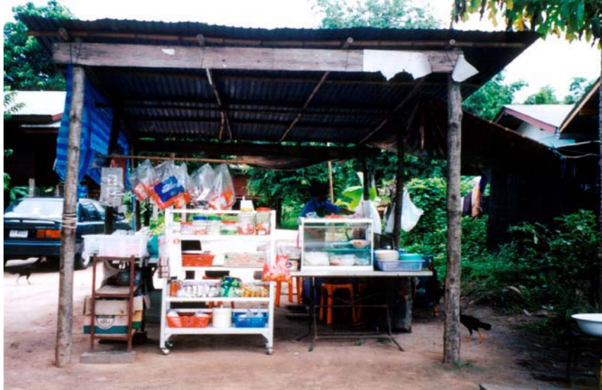
ภาพที่ 4.4 ร้านขายกล้วยเดี่ยวและขนมขบเคี้ยวที่บ้าน กุดจอก จ.ชัยนาท

ประกอบการรายย่อยในภาคอุตสาหกรรมและบริการในชุมชน ประกอบขึ้นเป็นระบบสหกรณ์ รวมการขายผลผลิต จัดระบบสินเชื่อ และจัดให้มีกองทุนสหกรณ์ เป็นต้น