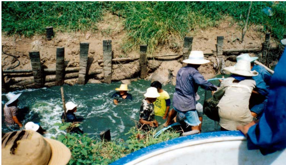
ภาพที่ 5.4 การเอาแรง (แลกเปลี่ยนแรงงาน) จับกุ้งกุลาดำที่บ้านหนองชุมพร จ.ฉะเชิงเทรา

มีรถปิคอัพเพิ่มขึ้นจาก 6 คันเรือนในปี ค.ศ.1994 และ 9 คันเรือนในปี ค.ศ.1999 นอกจากรถปิคอัพแล้ว จำนวนครัวเรือนที่มีมอเตอร์ไซด์และรถอีแต่นส่วนใหญ่มีแนวโน้มเพิ่มขึ้นในทศวรรษ 1990 ที่บ้านใหม่จำนวนครัวเรือนที่มีมอเตอร์ไซด์เพิ่มขึ้นเท่าตัวในช่วง ค.ศ.1994-1995 หรือในรอบเพียง 5 ปีเท่านั้น (ตารางที่ 5.6) การเพิ่มขึ้นของจำนวนยานพาหนะในแต่ละหมู่บ้านข้างต้นมิเพียงแต่แสดงถึงอำนาจซื้อที่เพิ่มขึ้นของครัวเรือน แต่ยังหมายถึงการขยายตัวของการผลิตเพื่อการค้าของหมู่บ้านด้วย ในกรณีของการขยายตัวของรถปิคอัพย่อมแสดงถึง ความต้องการในการขนส่งสินค้าทางเกษตร เช่น ข้าว กุ้ง ผลผลิตพืชไร่ และผลไม้ ให้แก่ตลาดภายในและตลาดต่างประเทศ เพราะรถบรรทุกปิคอัพย่อมมีสมรรถภาพในการขนส่งสูงและเคลื่อนที่ได้รวดเร็ว ต้นทุนต่อหน่วยในการขนส่งจึงต่ำลง และในบางกรณีช่วยไม่ให้ผลผลิตทางการเกษตรไม่เน่าเสียง่าย เช่น ในกรณีของกุ้งสดและผลไม้ การขยายตัวของรถมอเตอร์ไซด์แสดงถึงการติดต่อซื้อขายสินค้าจากนอกหมู่บ้าน รวมทั้งการอพยพย้ายถิ่นเพื่อไปหางานทำชั่วคราวนอกหมู่บ้าน เช่น ทำงานในโรงงานอุตสาหกรรม เป็นต้น