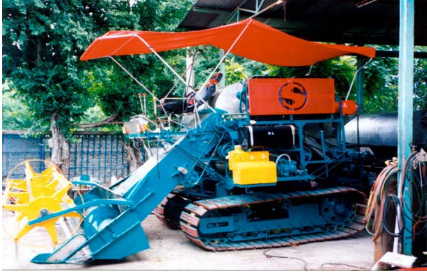
ภาพที่ 5.8 รถเก็บเกี่ยวข้าวที่ประกอบขึ้นที่บ้านหนองพังนาค จ.ชัยนาท