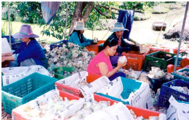
ภาพที่ 4.2 ชาวบ้านที่หมู่บ้านในอำเภอ ด่านมะขาม จ.ราชบุรี กำลังห่อฝรั่ง

ประการที่หก ความแตกต่างของฐานะทางเศรษฐกิจในหมู่บ้านเมื่อการค้าขายตัว ความเหลื่อมล้ำในฐานะของคนในหมู่บ้านมีมากขึ้น เพราะคนที่มีฐานะดีขึ้นย่อมจะไม่ไปแลกเปลี่ยนแรงงาน เขาอาจจะเริ่มให้เช่าที่ดิน (แลกเปลี่ยนที่ดินเป็นเงิน) หรือว่าจ้างลูกจ้างซึ่งมักจะเป็นผู้มีฐานะต่ำ