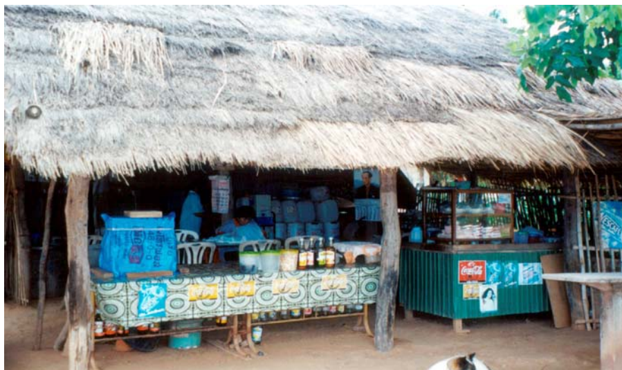
ภาพที่ 4.5 ร้านขายกล้วยเดี่ยวที่บ้านหนองพังนาค จ.ชัยนาท