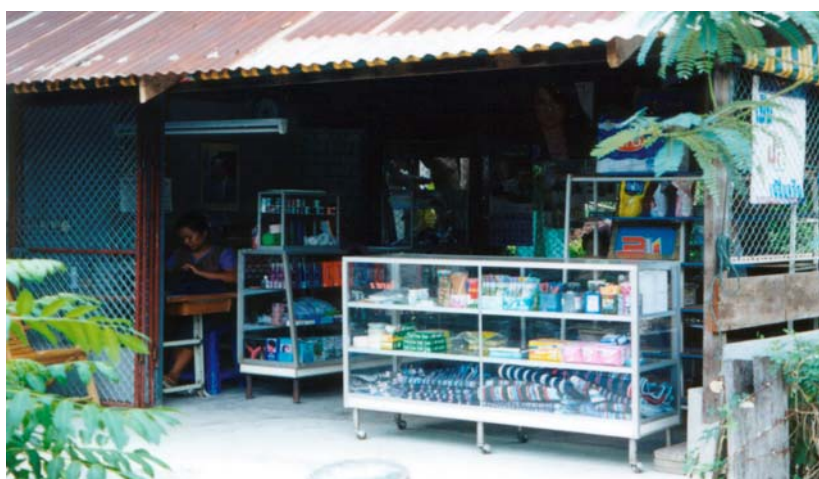
ภาพที่ 4.3 ร้านค้าที่บ้านหนองพังกา จ.ชัยนาท

แม้ว่าสัดส่วนของผู้ที่ทำงานที่มีสถานะเป็นธุรกิจส่วนตัวโดยไม่มีลูกจ้าง และช่วยธุรกิจในครัวเรือนโดยไม่ได้รับค่าจ้างจะลดลงในระยะ 15 ปีที่ผ่านมา (ค.ศ.1985-2000) แต่ทว่าสัดส่วนของผู้ทำงานของผู้ทำงานดังกล่าวยังคงอยู่ในระดับสูงเมื่อเทียบกับผู้มีงานทำทั้งหมด โดยในปี ค.ศ.2000 เพศชายคิดเป็นสัดส่วนถึงร้อยละ 42.5 และเพศหญิงคิดเป็นร้อยละ 47.8 หรือคิดเป็นจำนวนของผู้ที่ทำงานเท่ากับ 2.79 ล้านคน โดยเป็นชายเท่ากับ 1.46 ล้านคน และเป็นหญิงเท่ากับ 1.33 ล้านคน (ตารางที่ 4.20)