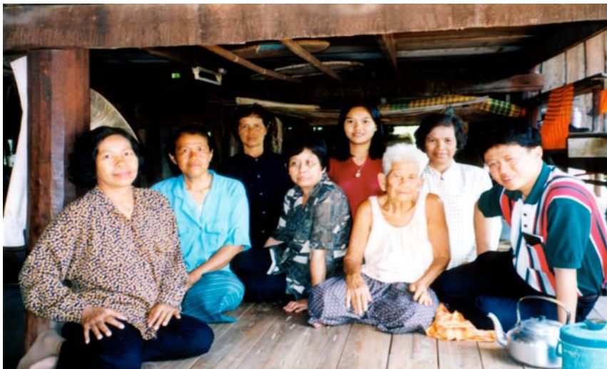
ภาพที่ 5.10 ผู้วิจัยและทีมงานกับชาวบ้าน บ้านกุดจอก จ.ชัยนาท

นอกจากนี้ที่บ้านกุดจอกในปัจจุบันชาวบ้านยังได้ร่วมมือการทำงานโดยการแลกเปลี่ยนเครื่องจักรเพื่อทำงาน จากการสัมภาษณ์พระอาจารย์เขื่อน วัดศรีสโมสร บ้านกุดจอก ท่านได้กล่าวว่า ชาวบ้านได้แก้ไขการขาดแคลนแรงงานในการทำงาน โดยอาศัยการยืมและแลกเปลี่ยนเครื่องจักรกัน “การทำงานสมัยนี้มันเร็วขึ้น เมื่อหว่านแล้ว พอเกี่ยวก็รู้ด รูดแล้วได้ข้าวเป็นกระสอบ ต้องหลายคนทำ ครอบครัวเดียวทำไม่ได้ เพราะครอบครัวหนึ่งจะมีคนอยู่สองสามคน บ้านหนึ่งมีคนแก่อายุก็