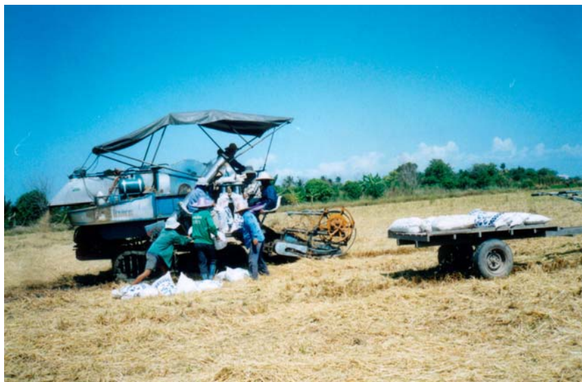
ภาพที่ 5.7 เาแรงเก็บเกี่ยวข้าวที่บ้านหนองชุมพร จ.ละโว้

ทุนเพิ่มขึ้น เช่น ในกรณีของบ้านหนองชุมพร) อีกร้อยละ 20 – 30 กู้ยืมไปใช้เพื่อการบริโภค และนับวันค่าใช้จ่ายในการบริโภคจะมีความสำคัญเพิ่มมากขึ้นเรื่อย ๆ การเลียนแบบการบริโภคอาจถือว่าเป็นรายจ่ายที่เกินตัวของเกษตรกร และเป็นเหตุให้มีการใช้จ่ายเกี่ยวกับตัวเงินมากยิ่งขึ้น รายจ่ายที่เพิ่มขึ้นส่วนนี้มาจากความต้องการซื้อสินค้าฟุ่มเฟือย ที่ไม่จำเป็น อาทิเช่น การแต่งกาย การใช้จ่าย การจัดงานประเพณี บวชนาค บวชนเณร งานรื่นเริงประจำปีของหมู่บ้าน การประกวดประชันจัดงานพิธีต่าง ๆ เป็นต้น รวมทั้งการมีรถมอเตอร์ไซด์ ปิคอัพ และโทรศัพท์มือถือ เป็นต้น ลักษณะของการเลียนแบบการบริโภคของชาวบ้านในแต่ละหมู่บ้านย่อมแตกต่างกันตามระดับของรายได้และความเจริญของท้องถิ่นเป็นสำคัญ เกษตรกรที่มีฐานะปานกลางและค่อนข้างดีจะมีการเลียนแบบอย่างในการบริโภคมากกว่าฐานะยากจน เกษตรกรในท้องถิ่นที่เจริญ ใกล้เมือง รวมทั้งมีการคมนาคมสะดวก เช่น ที่บ้านหนองพังนาค ย่อมมีการเลียนแบบในการบริโภคมากกว่าท้องถิ่นที่ล้าหลังกว่า เช่น บ้านเขาเขียวและบ้านใหม่ เป็นต้น แหล่งที่มาของเงินกู้ที่สำคัญของหมู่บ้านทั้ง 5 แห่ง ที่กว่าร้อยละ 80 ของครัวเรือนและเงินทุนมาจากธนาคารเพื่อการเกษตรและสหกรณ์การเกษตร และในระยะหลังเริ่มมีการกู้เงินจากกองทุนหมู่บ้านต่าง ๆ มากยิ่งขึ้น นอกจากนี้ในบางหมู่บ้าน คือ บ้านเขาเขียว เกษตรกรได้กู้เงินจากนายทุนจากอำเภอถานสัก โดยคิดอัตราดอกเบี้ยเท่ากับร้อยละ 3 – 5 ต่อเดือน โดยที่เกษตรกรจะชำระหนี้โดยนำพืชไร่ไปขายแก่นายทุนและถูกหักรายได้บางส่วนเป็นค่าดอกเบี้ย แต่ก็มียูไม่ก็ครัวเรือนประมาณ 3 – 4 ครัวเรือนในหมู่บ้านเท่านั้น