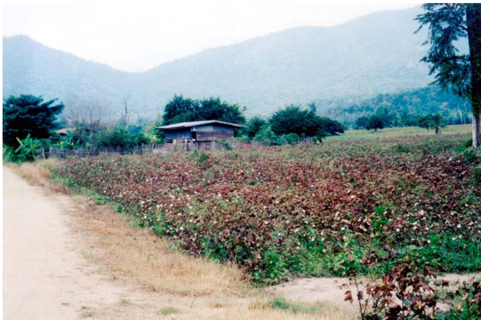
ภาพที่ 5.2 ไร่ฝ้ายที่บ้านเขาเจ็ว จ.อุทัยธานี