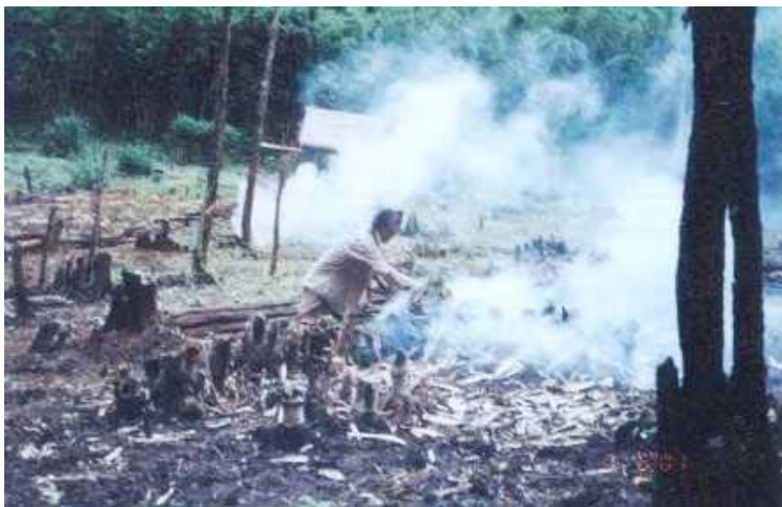
การทำไร่ของคนในชนเผ่า

สำหรับเรื่องความเชื่อในธรรมชาติ ชาวซุเชื่อว่าในทุกหนทุกแห่งของธรรมชาติมีสิ่งศักดิ์สิทธิ์ มีเจ้าที่คอยรักษาและเป็นผู้บันดาลให้เกิดภัยพิบัติต่างๆแก่มนุษย์ ถ้าหากมนุษย์ทำให้เจ้าไม่พอใจ ดังนั้นชาวซุจึงให้ความเคารพนับถือเทพหลายองค์เช่น เทพที่ให้ความคุ้มครองโลก ( เซอะไม่ปี่เซอะโร ซึ่งเป็นเจ้าที่คุ้มครองทั้งยักษ์ เทวดาและโลกมนุษย์ ) เทพเจ้าผู้ดูแลแผ่นดิน ( ช่งทะรี ) เทพผู้ดูแลสายน้ำ ( โพตุ๊ก ) เทพผู้ดูแลต้นข้าว ( ฟี่ป้อโฮย ) เทพแห่งต้นไม้ ( รุกขจือ ) เทพที่คุ้มครองธรรมชาติหรือเจ้าป่า ( กองกาซา ) ดังนั้นวิถีชีวิตของคนในชนเผ่าซุจึงผูกพันกับสิ่งศักดิ์สิทธิ์