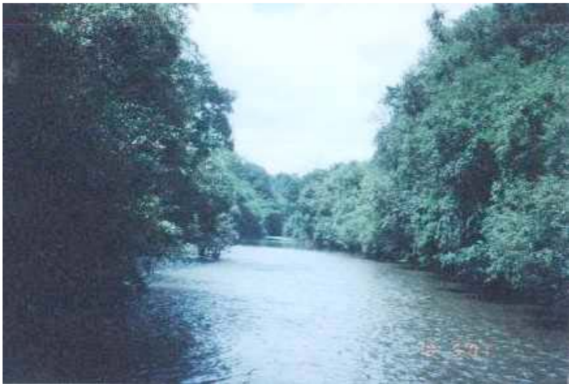
สายน้ำแม่จัน