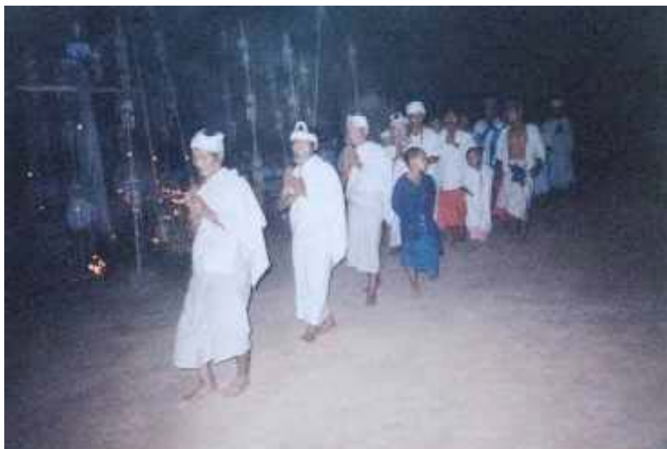
พิธีกรรมไหว้เจดีย์ทรายของกลุ่มความเชื่อด้ายเหลือง

นอกจากนั้นยังมีความสัมพันธ์ภายในระหว่างคนกลุ่มเผ่าเดียวกันแต่ต่างกลุ่มความเชื่อ เช่น กลุ่มความเชื่อด้ายขาว ( ลู้อัว ) กลุ่มความเชื่อด้ายเหลือง ( ลูบ่อง ) และกลุ่มถือน้ำดื่มสุก ( วิม่อง ) ซึ่งแต่ละกลุ่มจะมีขั้นตอนในการประกอบพิธีกรรมที่ต่างกัน อย่างไรก็ตามทั้ง 3 กลุ่มสามารถเชื่อมโยงความสัมพันธ์กันได้ผ่านทางการแต่งงาน โดยยึดถือกันว่าจะต้องยึดเอากลุ่มความเชื่อของฝ่ายหญิงเป็นหลัก ซึ่งฝ่ายชายจะต้องเข้า พิธีตามความเชื่อของฝ่ายหญิง เช่น ถ้าหากฝ่ายชายอยู่ในกลุ่มด้ายเหลือง ( ลูบ่อง ) ฝ่ายหญิงอยู่ในกลุ่มถือน้ำดื่มสุก ( วิม่อง ) พิธีการแต่งงานก็ต้องจัดแบบกลุ่มถือน้ำดื่มสุกและฝ่ายชายก็ต้องเปลี่ยนมานับถือตามกลุ่มความเชื่อของฝ่ายหญิง