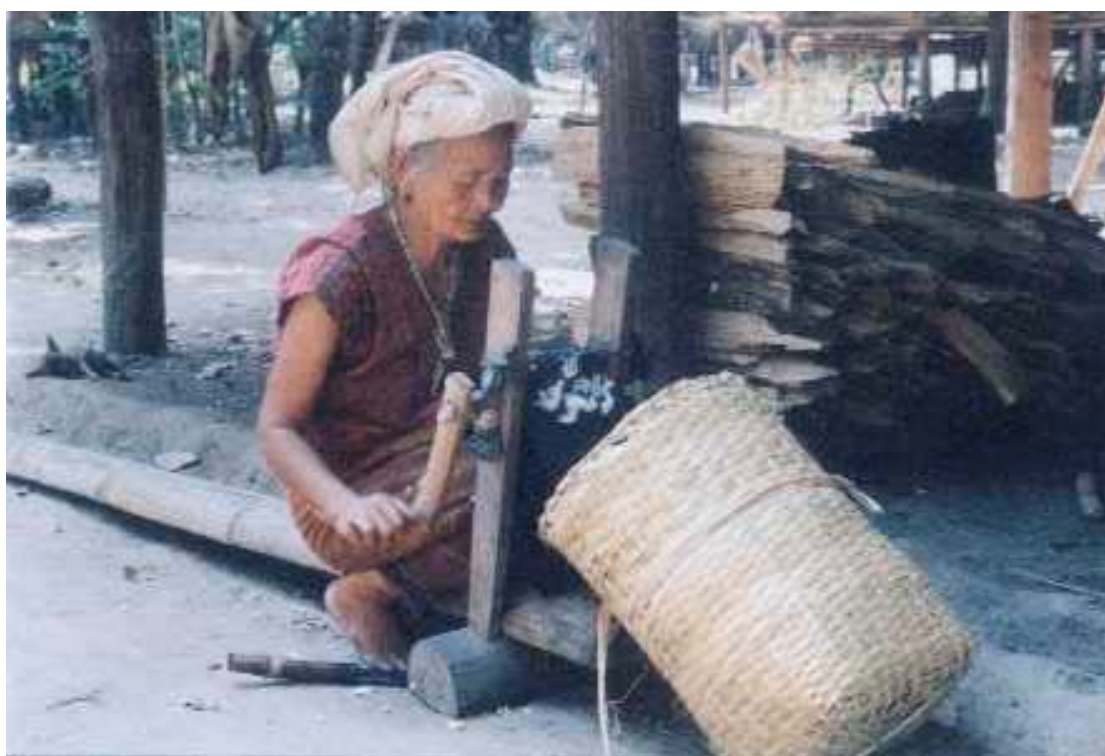
การหีบฝ้าย

ทำไร่นา และปัจจัยสำคัญที่จะรักษาโครงสร้างของลือกาเวาะได้คือระบบการแลกเปลี่ยนภายในชุมชน เช่น การแลกเปลี่ยนยาสูบ น้ำตาลอ้อย มะพร้าว น้ำมันงา จี๊ฟั้ง จี๊ได้ หมาก นอกจากนั้นยังมีระบบการผลิตในชุมชน เช่น การตีมีด การหีบอ้อย การทำน้ำตาลอ้อย การทำน้ำมันงา และนอกจากนี้ยังได้มีการวางแผนร่วมกันในแต่ละชุมชนแต่ละพื้นที่ เช่น การวางแผนร่วมกันในเรื่องการรักษาเมล็ดพันธุ์ข้าว พันธุ์ผักประเภท ยาสูบ พริก มะเขือ งา อ้อย เป็นต้น เพื่อให้ได้มีอยู่โดยต่อเนื่องระยะปีต่อปี นอกจากนี้ยังได้มีการวางแผนร่วมกันในเรื่องการหาปัจจัยสำคัญคือการสะสมเกลือสำหรับการบริโภคให้ได้อย่างน้อยระยะเวลา 3 ปี ทุกหมู่บ้านจะมีการเตรียมไว้สำหรับการป้องกันการเกิดปัญหาการวิกฤติในสถานการณ์การเมืองตามแนวชายแดน เช่น อาจจะมีสถานการณ์การสู้รบเกิดขึ้น ดังนั้นเกลือจึงมีความสำคัญมากที่จะต้องร่วมมือกันจัดเตรียมหาเอาไว้