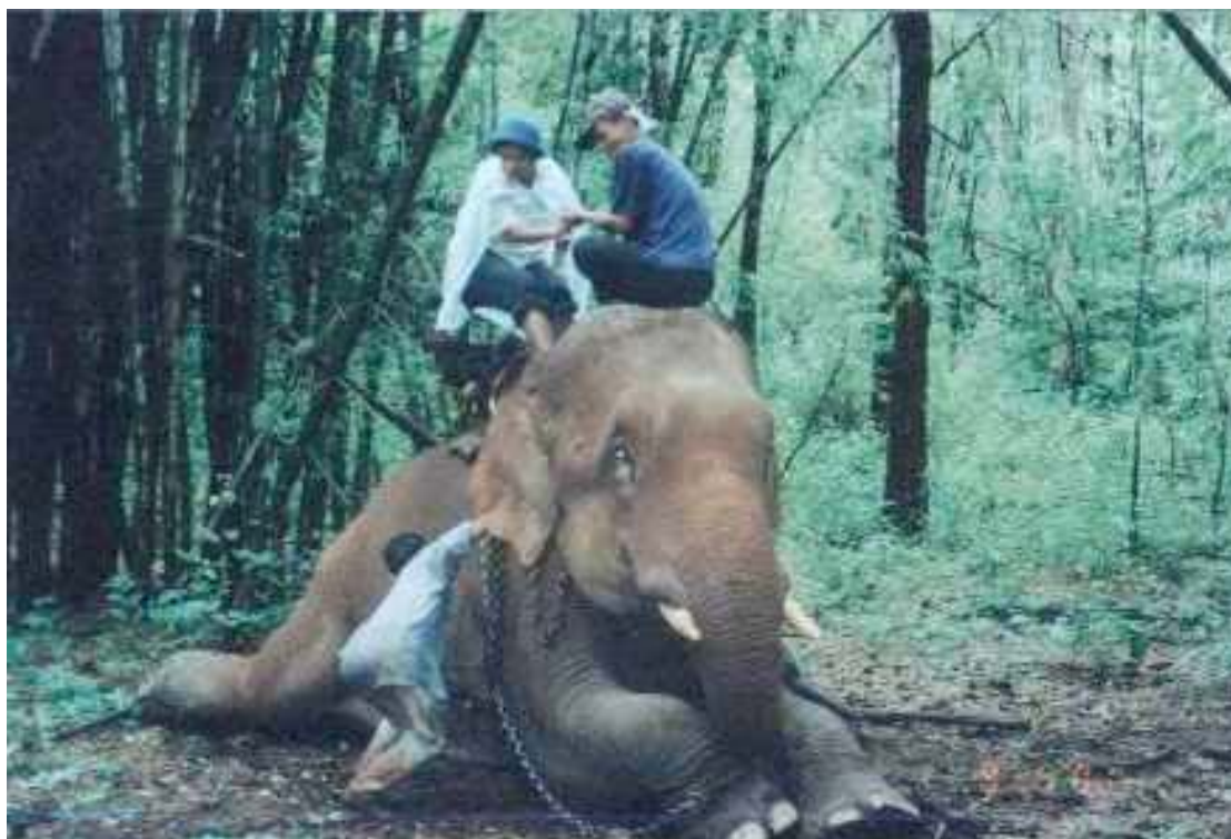
การเดินทางทำงานศึกษาวิจัย

ทีมงานวิจัยได้เดินทางไปศึกษาข้อมูลพื้นที่หมู่บ้านไล่ต่องค์ ซึ่งเป็นหมู่บ้านที่นับถือแบบตะหละโคว อยู่ในเขตตำบลแม่จัน อ.อุ้มผาง จ.ตาก พวกเราต้องออกเดินทางรอนแรมไปตามหุบเขา ต้องเดินข้ามเขตแดนจากเขตกาญจนบุรีไปเขตตาก ต้องผ่านหลายชุมชน และต้องค้างคืนในป่า เหตุการณ์ในป่านี้เองทำให้เราต้องจดจำไปนานแสนนาน เมื่อเราได้พบกับผู้คนจำนวนหนึ่งอาศัยซ่อนตัวอยู่ในป่าลึก รัฐบาลไทยเรียกพวกเขาว่าเป็นชนกลุ่มน้อย แต่ในความเป็นจริงพวกเขาเป็นมนุษย์เหมือนกับพวกเราทั่วไปเป็นโผล่แวงๆที่มาจากหมู่บ้านโจควะ ซึ่งเป็นหมู่บ้านชายแดนที่อยู่ในเขตประเทศพม่า พวกเขาเล่าว่าแต่ก่อนก็อาศัยอยู่ในโจควะ แต่ด้วยจากได้รับความทุกข์ทรมานจากการกดขี่ข่มเหงพม่า ทำให้พวกเขาจำนวน 10 ครอบครัวได้ชักชวนหลบหนีลี้ภัยออกมาอยู่แบบหลบซ่อนๆอยู่ในป่าลึกแห่งนี้ โดยที่ไม่รู้แน่ชัดว่าเป็นเขตแดนไทยหรือเขตแดนพม่า แต่เพียงเพื่อความปลอดภัยของชีวิต ทำให้ต้องเข้ามาหลบซ่อนตัวอยู่ในป่าลึกอย่างนี้