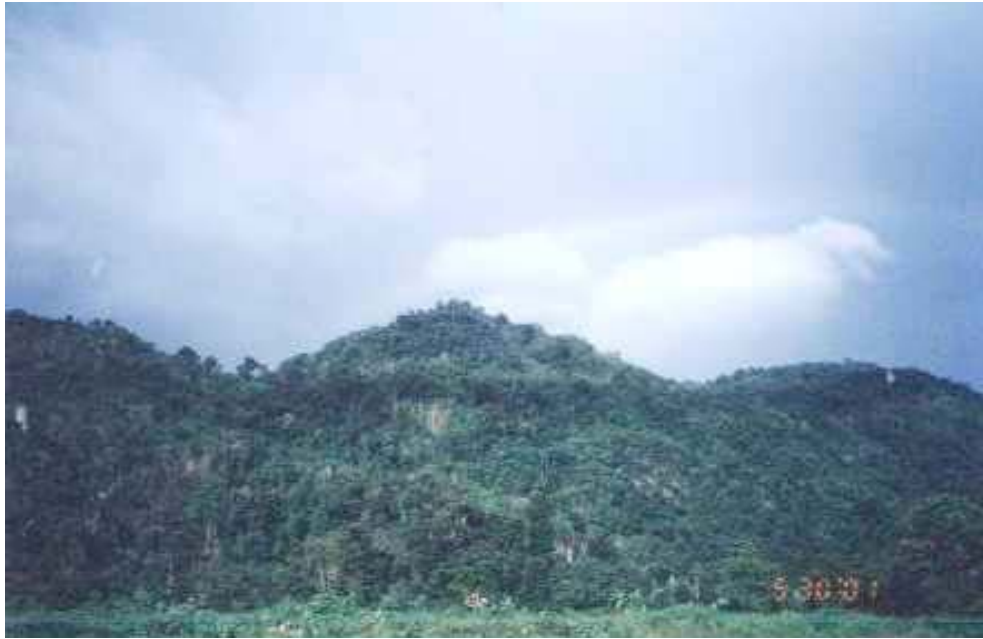
หุบเขาสะอะนีฟ่ง