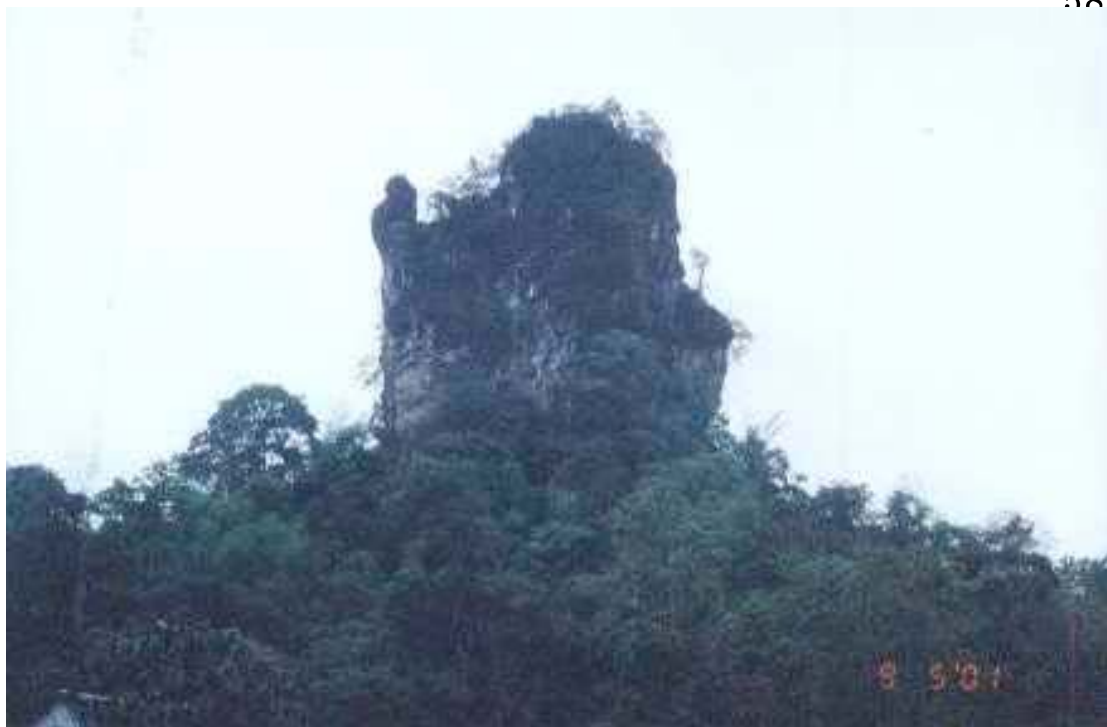
ภูเขาจะแก