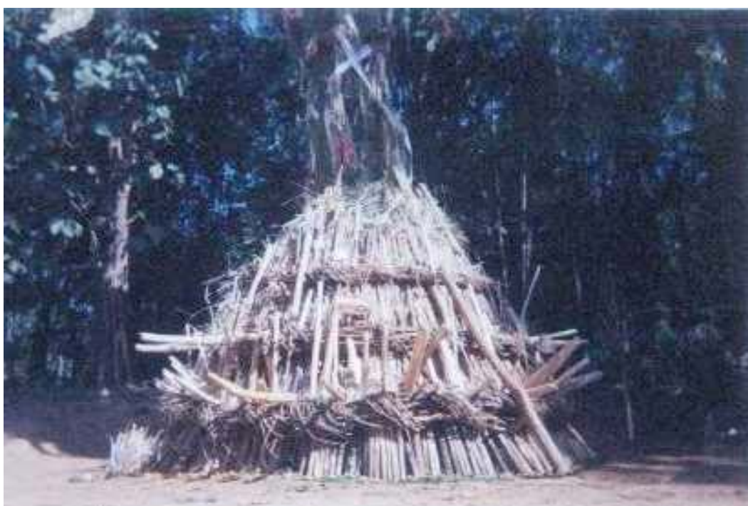
พิธีกรรมบุญกองไฟที่หมู่บ้านไถ่ถ่องคู้

ดังนั้นจะเห็นได้ว่าพื้นที่การทำงานของโครงการวิจัยย้อนรอยอดีตชนเผ่าซุนมี 3 ระบบซ้อนกันอยู่ คือ 1. พื้นที่ทางการปกครอง ที่มีการครอบคลุมบางตำบล บางอำเภอ ของจังหวัดกาญจนบุรีและบางตำบล บางอำเภอของจังหวัดกาญจนบุรี 2. พื้นที่ที่เป็นพื้นที่อนุรักษ์ที่ถูกประกาศโดยกรมป่าไม้วัวเป็นเขตรักษาพันธุ์สัตว์ป่าทุ่งใหญ่นเรศวร ด้านตะวันตก จ.กาญจนบุรี และเขตรักษาพันธุ์สัตว์ป่าทุ่งใหญ่นเรศวรด้านตะวันออก จ.ตาก 3. พื้นที่ทางความเชื่อ ศาสนาและพิธีกรรมของชนเผ่าซุน ที่พูดถึงความเชื่อว่าเป็นดินแดนศักดิ์สิทธิ์ เป็นดินแดนของการบำเพ็ญเพียรภาวนาเพื่อไปสู่ความหลุดพ้น