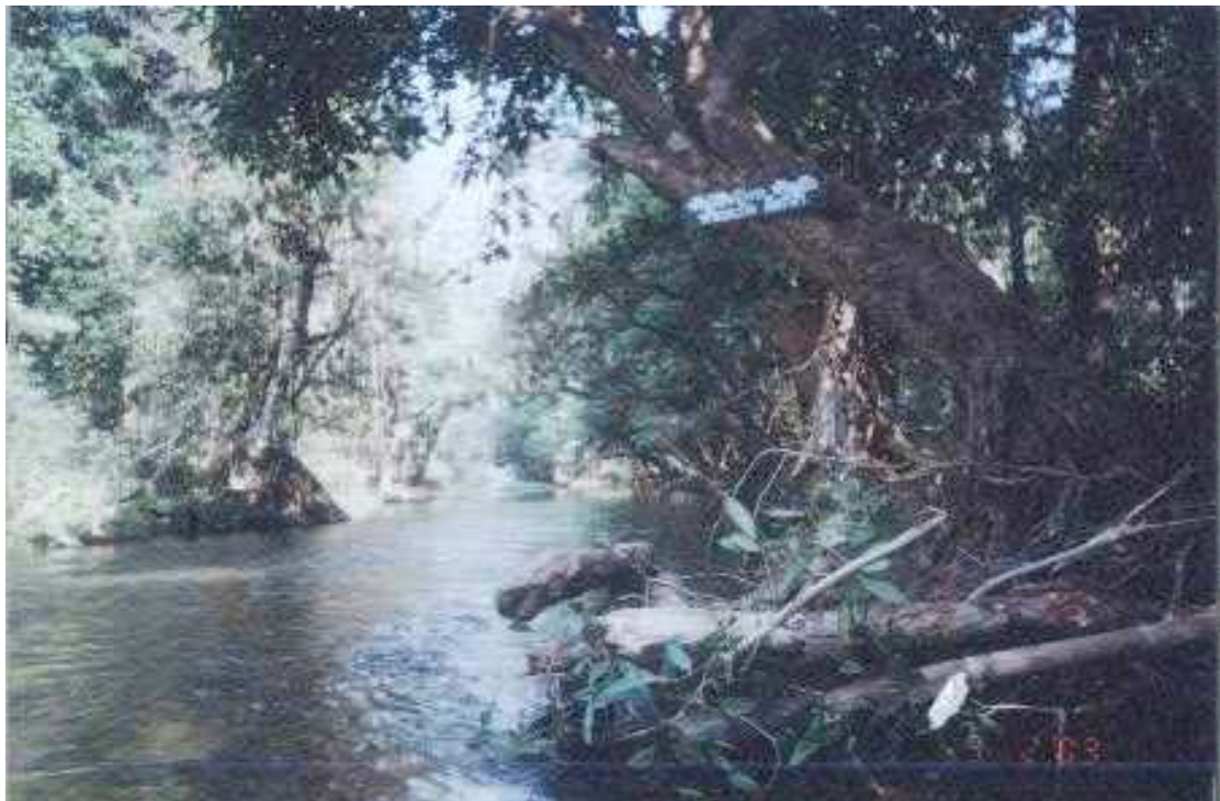
ขอบเขตพื้นที่ศึกษาโครงการย้อนรอยอดีตชนเผ่าชู