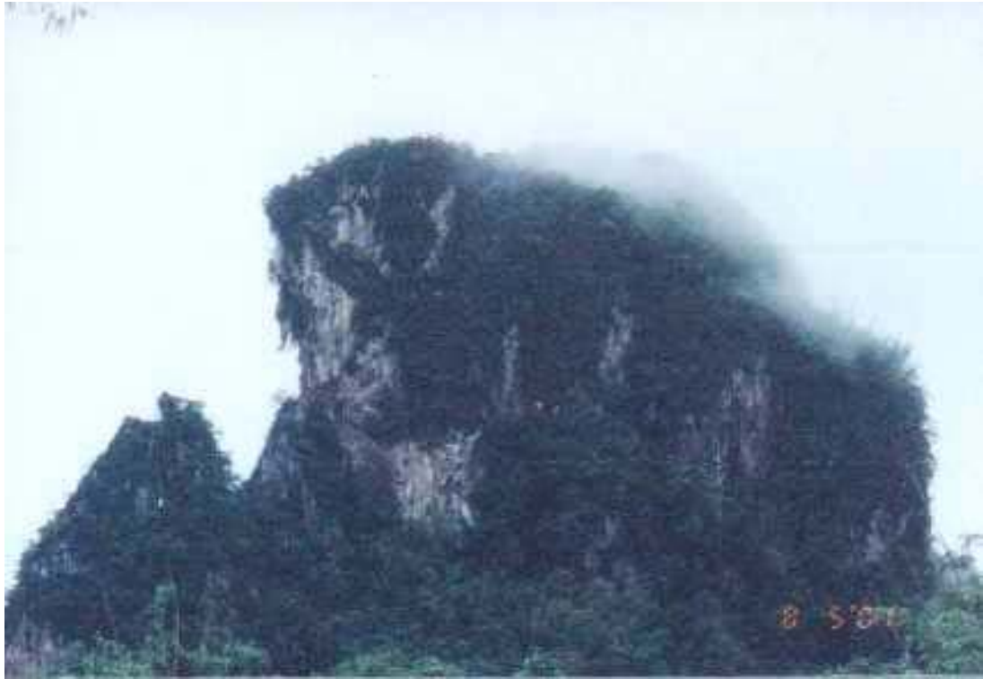
ภูเขาโต่วปอง เส้นกั้นอาณาเขตแดนไทยกับพม่า ที่ชายแดนด้านตะวันตก สายน้ำเคอหระ