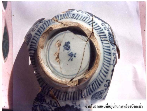
ชามโบราณพบที่หมู่บ้านกะเหรี่ยงบังกะม่า