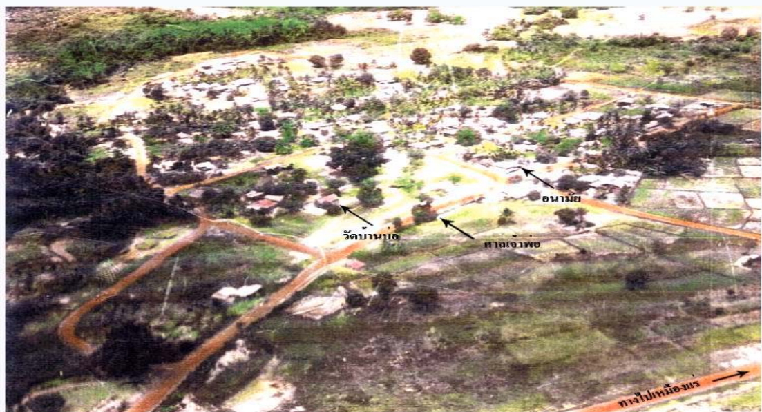
ชุมชนบ้านบ่อระหว่าง ปี 2511 - 2514

การจัดระเบียบหมู่บ้าน เพื่อความเป็นระเบียบเรียบร้อยในหมู่บ้าน หน่วยพัฒนาการเคลื่อนที่ได้จัดระเบียบใหม่ในหมู่บ้านกะเหรี่ยง เหมือนกับการผ่าตัดเปลี่ยนร่างกายให้ดูดี เริ่มที่บ้านบ่อหมู่บ้านอันเป็นที่ตั้งของตำบลสวนผึ้ง มีการตัดถนนแบ่งซอยภายในหมู่บ้าน บ้านหลังไหนที่ขวางแนวถนนก็ทำการรื้อและปรับปรุงใหม่ ทำรั้วบ้าน สร้างส้วม สร้างเล้าหมู แทนการเลี้ยงแบบปล่อย สร้างห้องสมุดประชาชน ปรับปรุงศาลเจ้าพ่อในหมู่บ้านให้ดูดีและแข็งแรงสวยงามกว่าเดิม ทำแปลงเกษตรสาธิต ชาวบ้านส่วนมากอยากจะได้ถนนเชื่อมต่อหมู่บ้าน แต่ผู้เฒ่าบางคนก็หัวนเกรงว่าจะเป็นการสร้างเส้นทางไปทำสงครามกับพม่า