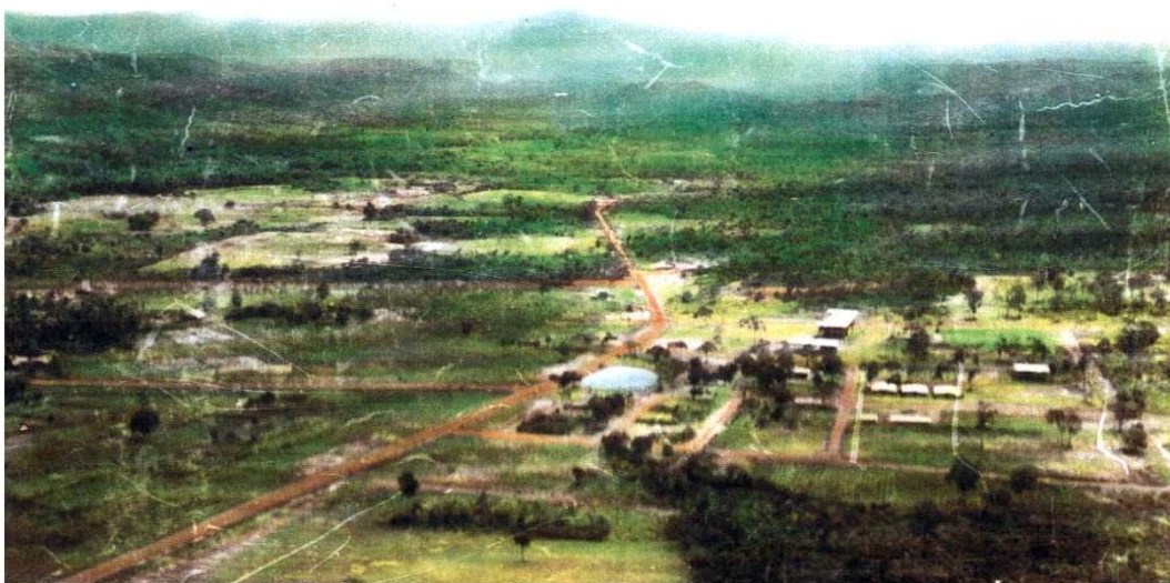
อ่างสวนผึ้งระหว่างปี 2511 - 2514 ปัจจุบันเป็นบริเวณที่ทำการอำเภอ ตลาด และสถานีตำรวจ

เส้นทางช่วงสุดท้าย เรียกว่า “ ลำภาชี ” ลำภาชีเป็นชื่อเรียกของลำน้ำสายหลักที่หล่อเลี้ยงชีวิตคนกะเหรี่ยง ก่อนที่จะเข้าสู่หมู่บ้านกะเหรี่ยงสวนผึ้ง จะต้องข้ามผ่านลำน้ำแม่ภาชี หน่วยพัฒนาการเคลื่อนที่ได้จ้างชาวบ้านกะเหรี่ยงและคนลาวยวนบ้านนาขุนแสนสร้างสะพานคอนกรีตข้ามลำน้ำแม่ภาชีสำเร็จในฤดูแล้งปี พ.ศ.2512 ทำให้สามารถเดินทางเข้ามายังสวนผึ้งได้ตลอดทั้งปี