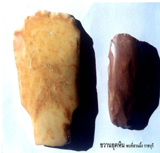
ขวานยุคหิน พบที่สวนผึ้ง ราชบุรี

นับแต่ปี พ.ศ.2455 เป็นต้นมา ที่คนจากต่างถิ่นเริ่มหลั่งไหลเข้ามาในชุมชนสวนผึ้ง คนจีนจากแผ่นดินใหญ่เข้ามาเป็นแรงงานต่างด้าวเป็นกลุ่มแรก คนลาววน ลาวอีสาน คนจีนจากตัวเมืองเข้ามาตั้งร้านขายของในหมู่บ้านกะเหรี่ยงที่บ้านบ่อ ต่อมานายห้างประยูร โมริยะกุล ผู้จัดการเหมืองแร่บ่อคลึง ได้สำรวจและตัดเส้นทางรถยนต์เส้นทางใหม่ เพื่อลำเลียงแร่เข้าสู่ตัวเมืองราชบุรี จากเหมืองแร่บ่อคลึง (บ่อน้ำร้อน) ผ่านหมู่บ้านกะเหรี่ยง มายัง รางป่าห้วย บ้านมะขามเอน