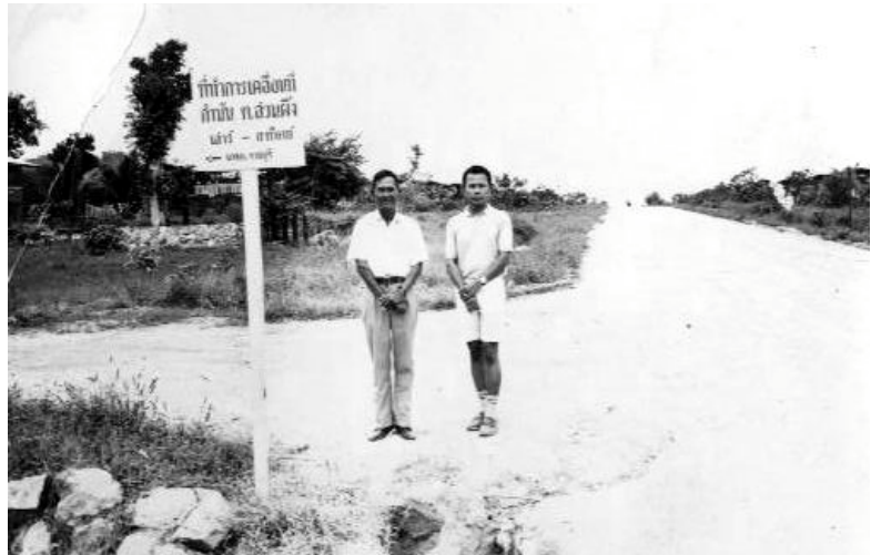
ป้าย ที่ทำการเคลื่อนที่ กำนัน ต.สวนผึ้ง เสาว์-อาทิตย์ ถนนสาย หมู่บ้านซำป่าหวายพัฒนา - บ้านบ่อ ในปี พ.ศ.2513 (ปัจจุบันคือบริเวณหน้าโรงพยาบาลสวนผึ้ง )

เส้นทางช่วงที่ 3 “ กลางพนา ” จากบ้านหนองขามถึงบ้านซำหนองหมี เป็นเส้นทางที่ถูกตัดใหม่เพื่อที่จะผ่านซำป่าหวายที่มีบ้านไม่กี่หลังคาเรือน เส้นทางช่วงนี้เรียกว่า “กลางพนา” สภาพภูมิประเทศเริ่มเป็นป่ารกชัฏไม่มีหมู่บ้านริมทาง ความหนาแน่นของพันธุ์ไม้และทรงต้นที่สูงชันที่อยู่สองฝากเส้นทางที่เป็นทางลัดของรถขนแร่ได้บังคับสายตาจนมองไม่เห็นเทือกทิวเขาตะนาวศรีที่ตั้งตระหง่านอยู่เบื้องหน้า ป่าช่วงนี้ยังมีสัตว์ป่าจำพวก หมี เก้ง เสือ อาศัยอยู่