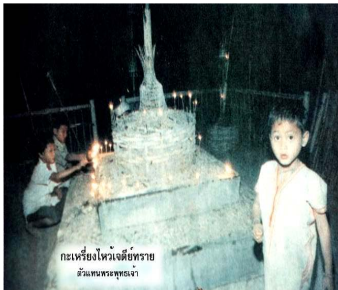
กะเหรี่ยงไหว้เจดีย์ทราย ตัวแทนพระพุทธเจ้า

การสร้างเจดีย์ของคนกะเหรี่ยงทำขึ้นมาอย่างเรียบง่าย โดยนำไม้ไผ่มาสานล้อมรอบพระเจดีย์ทราย เพื่อไม่ให้ทรายไหลเทออกไป เมื่อถึงวัน พระโดยสังเฎจากวันข้างขึ้นข้างแรม คนกะเหรี่ยงจะหยุดการทำงานไม่ฆ่าสัตว์ มาร่วมกันทำบุญ นำทรายจากลำห้วยมา เทใส่รอบๆพระเจดีย์ ในวันพระสำคัญ มีการเวียนเทียนรอบพระเจดีย์ทราย เช่น วันออกพรรหามีการส่ง การแห่ฉัตร ถวายแด่พระพุทธเจ้า ผู้ประกอบพิธี กรรมทางศาสนาเรียกว่า “โป้งคู้”