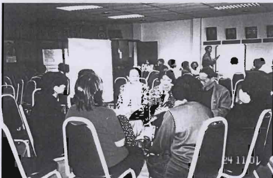
เวทีชาวบ้าน ร่วมกันคิด วิเคราะห์ และตัดสินใจ เพื่อสุขภาพของชุมชนโดยชุมชน