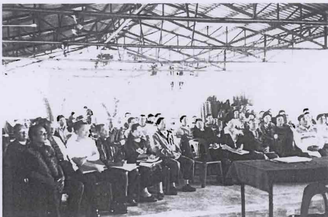
ร่วมกันคิดตัดสินใจและร่วมรับผิดชอบต่อแผนงานโครงการที่ร่วมกันกำหนด