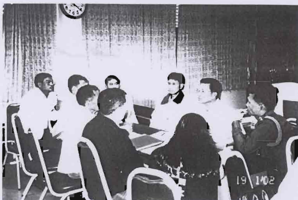
ร่วมกันกำหนดแนวทางและแผนงานโครงการ เพื่อสุขภาพของชุมชน โดยชุมชนและหน่วยงานที่เกี่ยวข้อง