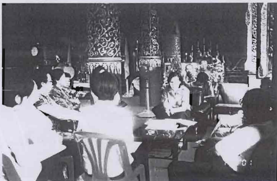
สนทนากลุ่มย่อยเพื่อทำความเข้าใจวิธีคิดและวิถีปฏิบัติเกี่ยวกับสุขภาพของชาวบ้านในชุมชน