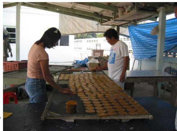
การตากมะม่วงแผ่น

วิธีที่ทำมานานแต่ครั้งปู่ย่าตายาย คือ การนำมะม่วงสุกงอมมาปอกเปลือก หั่นเนื้อมะม่วงเป็นชิ้นเล็ก ๆ ปั่นด้วยเครื่องปั่นจนละเอียด เคี่ยวโดยใช้ไฟจากฟืน อ่อน ๆ คอยชิมรส หากอ่อนหวาน เติมน้ำตาลและเกลือเล็กน้อย พอได้ที่ นำไปเทใส่ถาด แล้วตักมาหยอดเป็นแผ่นวงกลมเล็กๆ พอดีคำ ตากทิ้งไว้ประมาณ 1 วัน จึงลอกเก็บไว้ขายเป็นกิโลกรัม ราคา กิโลกรัมละประมาณ 100-120 บาท โดยมะม่วงสุก 100 กิโลกรัมจะทำมะม่วงแผ่นได้ประมาณ 10 กิโลกรัม ซึ่งจากแหล่งที่ไปสัมภาษณ์พบว่า ในเดือนที่มะม่วงสุกงอมสามารถทำมะม่วงแผ่นได้ประมาณ 150 กิโลกรัมหรือประมาณ 15,000 บาท ต่อ 1 ฤดูกาล ราคาขายมะม่วงแผ่นนี้เมื่อเทียบกับการนำมะม่วงดิบไปขาย ซึ่งได้ฤดูกาลละประมาณ 100,000 บาท นับว่าเป็นราคาที่ต่ำกว่าราคามะม่วงแผ่น แต่ก็เป็นการนำวัตถุดิบที่ขายไม่ได้แล้วมาแปรรูปให้มีมูลค่าเพิ่มและขยายระยะเวลาในการขายออกไป