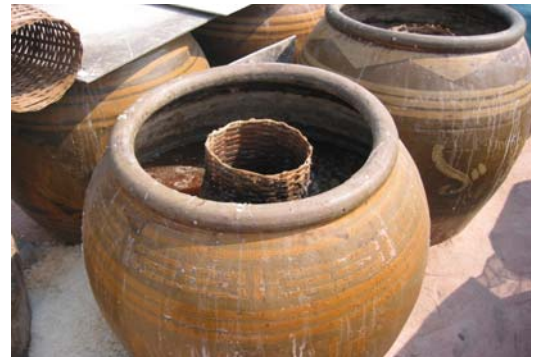
โอ่งหมักน้ำปลาและที่กรอง

เป็นผลิตภัณฑ์คู่กันและเป็นผลิตภัณฑ์ประจำ จังหวัดชายฝั่งทะเลภาคตะวันออกแห่งนี้ ในบ้าน ริมฝั่งทะเล เดิมมีการทำน้ำปลาไว้กินเองในแต่ละ บ้าน ต่อมาเมื่อเศรษฐกิจดีมีนักท่องเที่ยวเข้ามา ในหมู่บ้านมาก จึงมีการทำน้ำปลาขายนักท่องเที่ยว ครั้งมีโรงงานอุตสาหกรรมน้ำปลาเกิดขึ้น การทำ น้ำปลาในชุมชนจึงเริ่มลดน้อยลง แต่ก็ยังมีแหล่ง ผลิตน้ำปลาที่ได้มาตรฐานในชุมชนอยู่ 2 แห่ง และมีกลุ่มแม่บ้านที่รวมกลุ่มกันทำน้ำปลาจำหน่าย