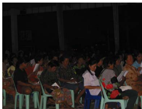
การประชุมคัดเลือกกรรมการกองทุน

ตามหมวดที่ 8 หาเฉพาะกาล ข้อ 52 ของระเบียบคณะกรรมการกองทุนหมู่บ้านและชุมชนเมืองแห่งชาติ พ.ศ. 2544 แต่เพื่อให้คณะกรรมการกองทุนหมู่บ้านริมฝั่งทะเลดำรงอยู่ต่อไป