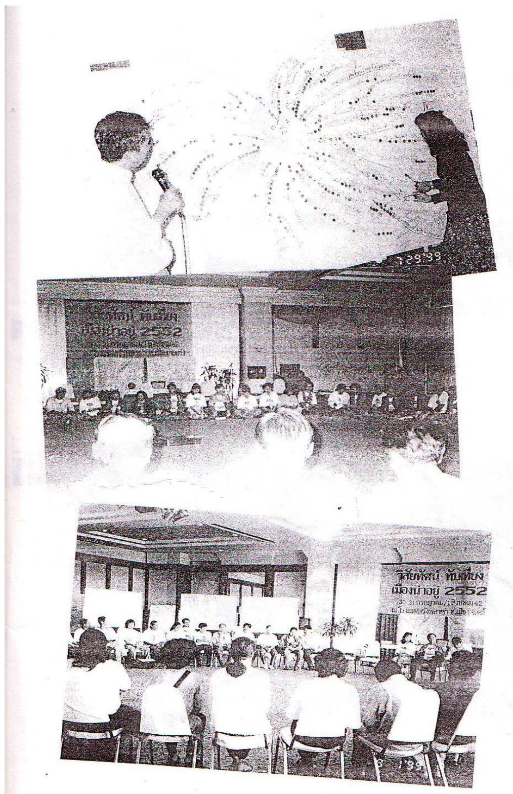
บรรยากาศการประชุมเวทีวิสัยทัศน์ตำบลเที่ยงเมืองน่าอยู่ 2552