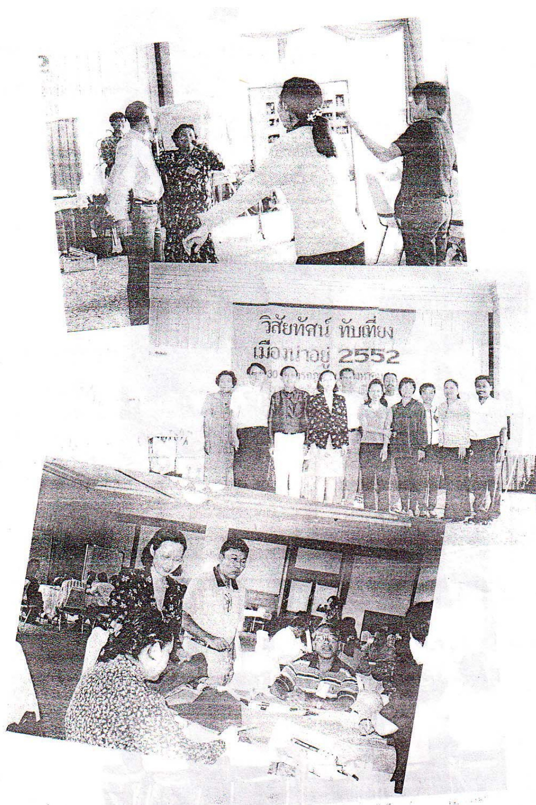
ผลจากการประชุม คือ เป้าหมายและยุทธศาสตร์การทำงานร่วมกัน