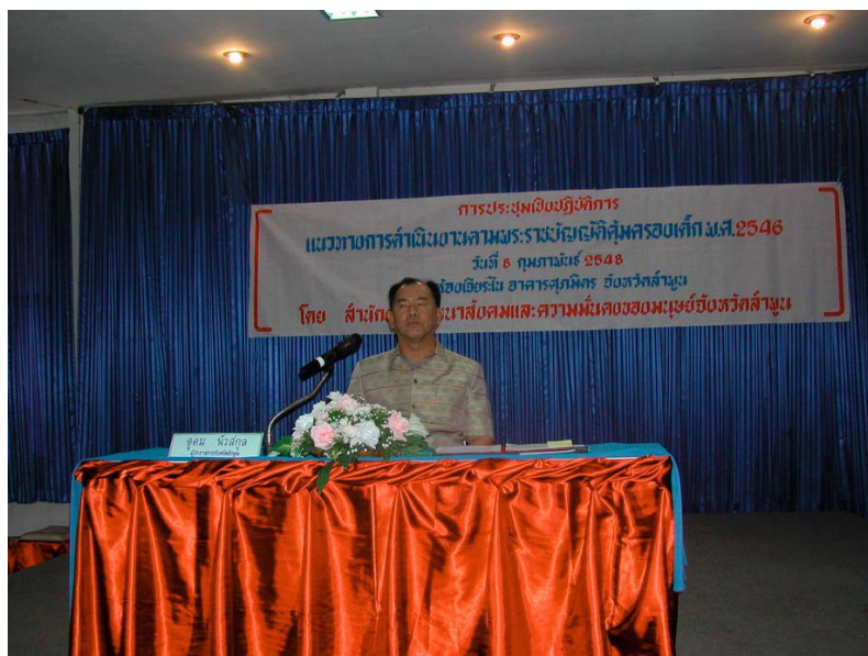
นาย อุดม พัวสกุล ผู้ว่าราชการจังหวัดลำพูน บรรยายพิเศษเรื่องสถานการณ์ปัญหาสังคมด้านเด็ก 8 กุมภาพันธ์ 2548