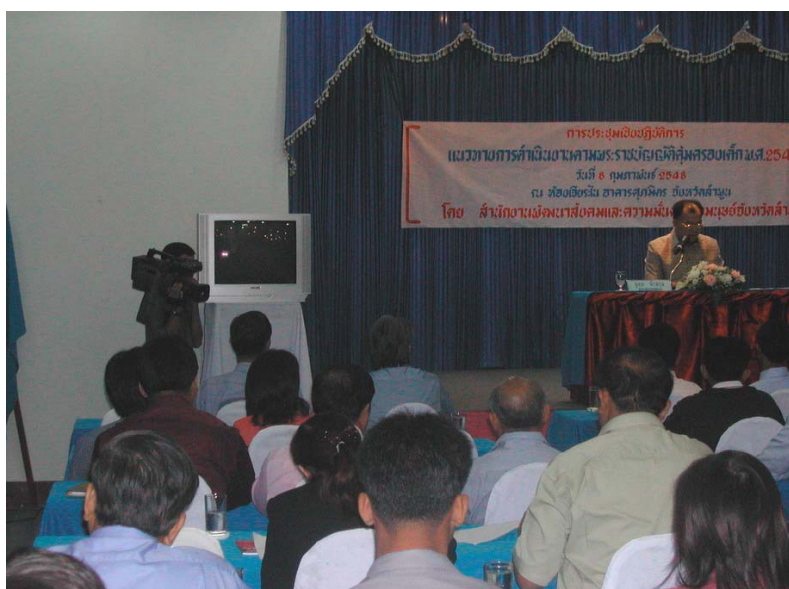
การประชุมเชิงปฏิบัติการ การดำเนินงานตาม พ.ร.บ.คุ้มครองเด็ก 2546 ประกอบด้วย บุคคลที่ทำงานเกี่ยวข้องกับเด็ก นายอำเภอ นายก อบจ. อบต. เทศบาล ทัวจังหวัดลำพูนและสื่อมวลชน 8 กุมภาพันธ์ 2548