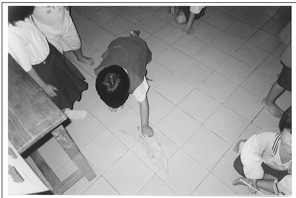
รูปภาพที่ 3.49 รูปประกอบการทำกิจกรรม “เด็กเตรียมอนุบาลได้เรียนรู้จากประสบการณ์จริง”