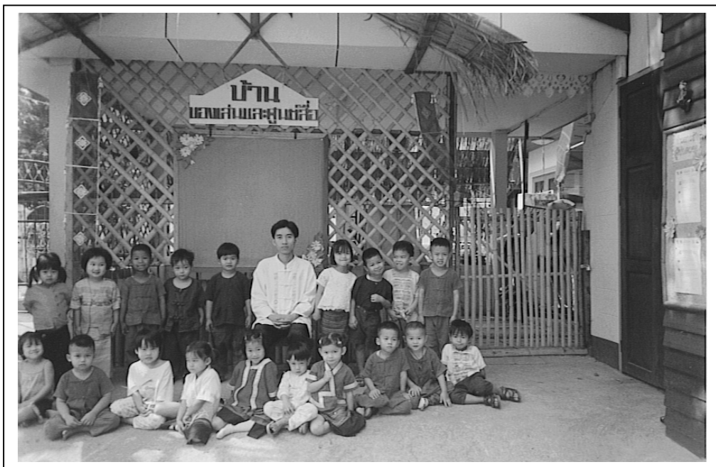
รูปภาพที่ 3.52 รูปประกอบการทำกิจกรรม “ครูประจำชั้นกับเด็กอนุบาล 1 ในศูนย์”