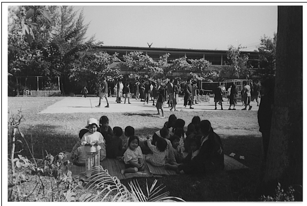
รูปภาพที่ 3.48 รูปประกอบการทำกิจกรรม “เด็กเตรียมอนุบาลเรียนรู้ทั้งในห้องเรียนและนอกห้องเรียน”