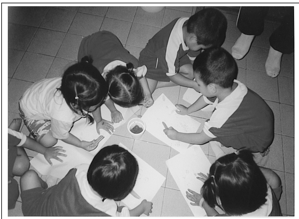
รูปภาพที่ 3.45 รูปประกอบการทำกิจกรรม “การจัดกิจกรรมสร้างสรรค์ที่หลากหลายสำหรับเด็กอนุบาล 1”