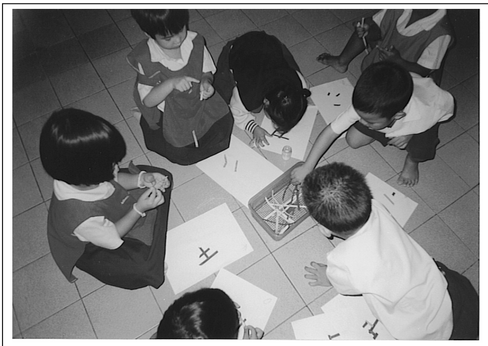
รูปที่ 3.44 รูปประกอบการทำกิจกรรม “การจัดกิจกรรมสร้างสรรค์ที่หลากหลายสำหรับเด็กอนุบาล 1”