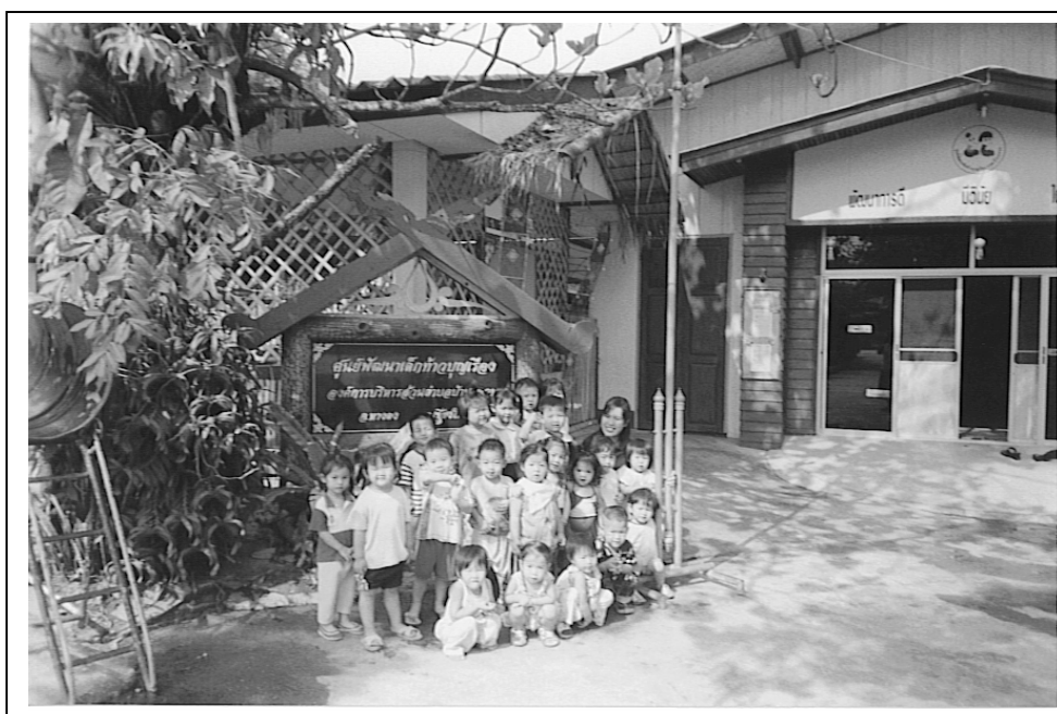
รูปภาพที่ 3.51 รูปประกอบการทำกิจกรรม “ครูประจำชั้นกับเด็กเตรียมอนุบาลในศูนย์”