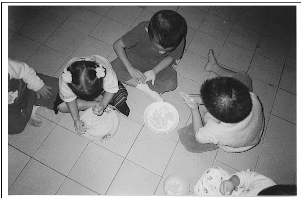
รูปภาพที่ 3.50 รูปประกอบการทำกิจกรรม “เด็กเตรียมอนุบาลได้เรียนรู้จากประสบการณ์จริง”