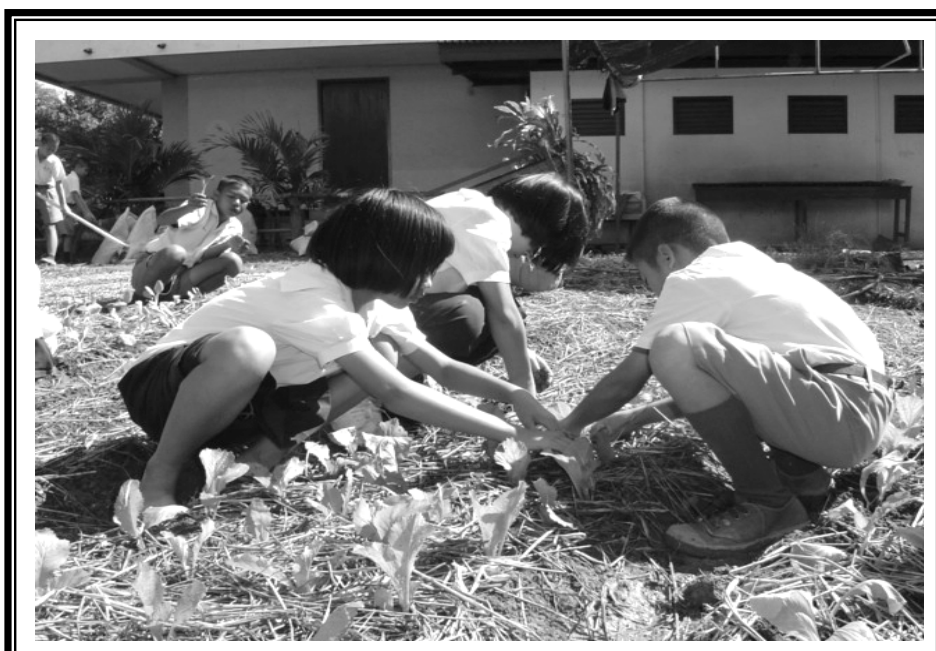
นักเรียนฝึกการปลูกผักโดยใช้ต้นกล้า ที่ถอนมาจากแปลงผักของครูสวนผัก ที่แปลงสาธิตงานเกษตรในโรงเรียนครุณวิทยา (เทศบาลบ้านสวนตาล)