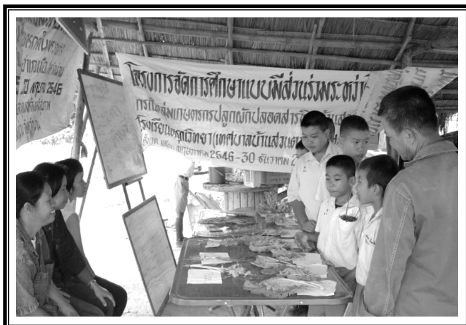
บทเรียนแรก นักเรียนทำความรู้จักกับพันธุ์ผักและวัสดุ อุปกรณ์ในการปลูก สอนโดย ครูสวนผัก (ปลอดสารพิษบ้านสวนหอม)