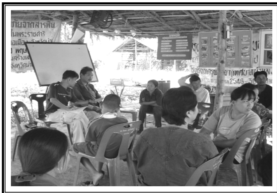
ผู้วิจัย ร่วมกับกลุ่มเกษตรกร นักเรียน ผู้ปกครอง และผู้เฒ่าผู้แก่ประชุม เพื่อกำหนดแนวทางในการพัฒนาหลักสูตรท้องถิ่นและจัดกิจกรรมร่วมกัน