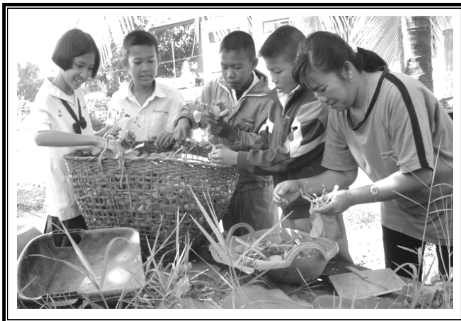
ครูป้าน้อมและครูสวนผักคนอื่น ๆ สอนการถอนและเลือกต้นกล้าเพื่อนำไปปลูก