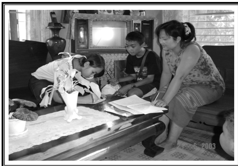
นักเรียนชั้นประถมศึกษาปีที่ 6 โรงเรียนครุณวิทยา (เทศบาลบ้านสวนตาล) ออกศึกษาสภาพชุมชน โดยการสัมภาษณ์และเอกสารจากหัวหน้าคุ้มต่างๆ ภาย