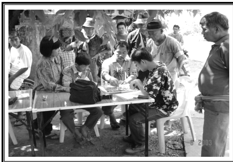
ผู้วิจัย พร้อมด้วยกำนันตำบลผาสิงห์ และผู้อาวุโสในชุมชน ร่วมกันศึกษาแผนที่ชุมชน