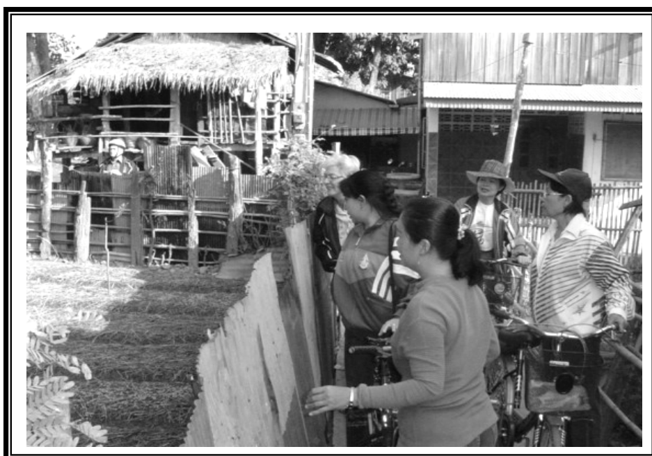
อาจารย์ใหญ่ คณะครู และผู้วิจัยร่วมกับอาสาสมัครชาวอเมริกัน ออกเยี่ยมบ้านนักเรียนในชุมชนบ้านสวนหอม พบว่ามีการปลูกผักไว้กินเอง