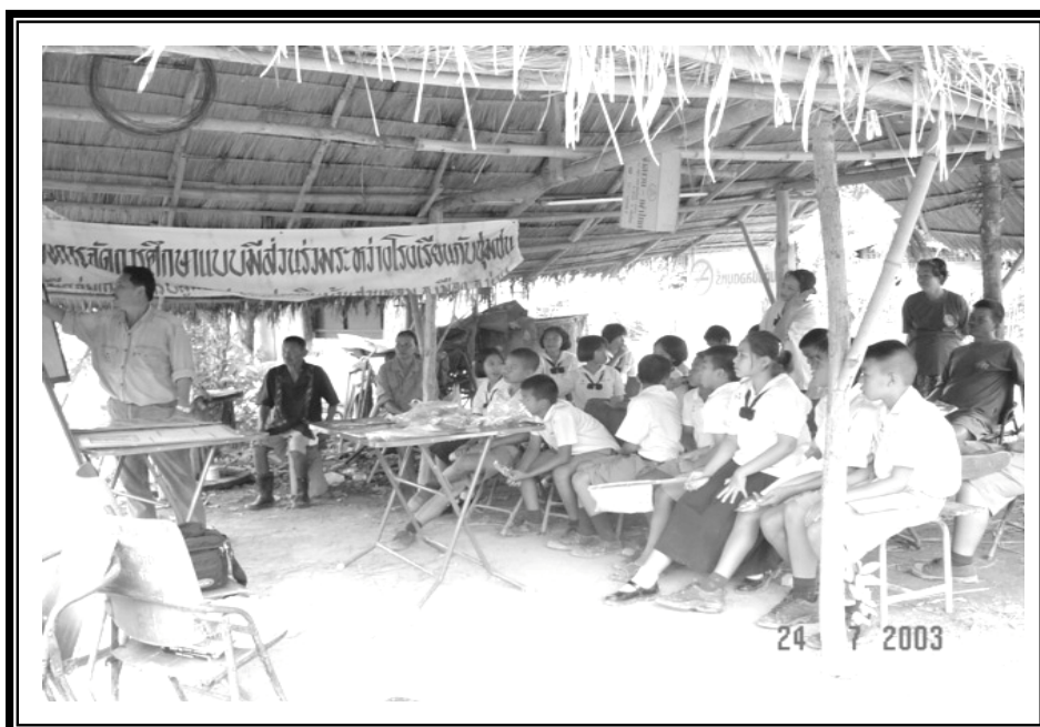
ห้องเรียนธรรมชาติ