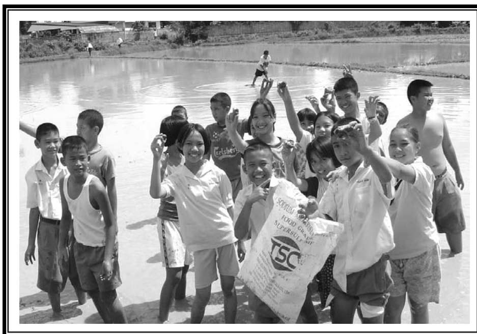
ก่อนทำปุ๋ยน้ำหมักจากหอยเชอร์รี่ ต้องหาหอยในนาก่อนครับ