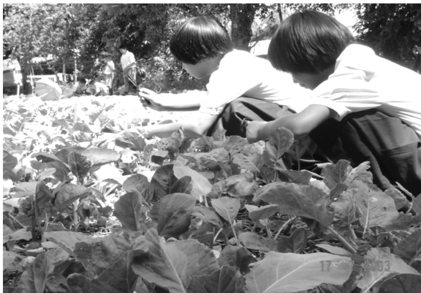
ศึกษา สังเกตเรื่องของแมลงที่พบในแปลงว่า ตัวไหน ชนิดใด ให้คูณหรือให้โทษกับพืชผัก