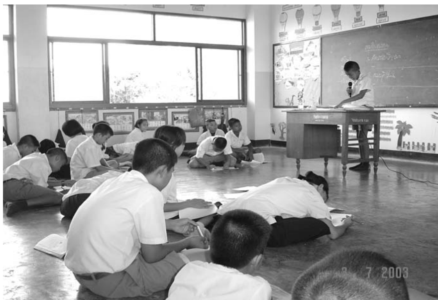
เมื่อได้ข้อค้นพบ ของแต่ละกลุ่ม จึงนำมานำเสนอต่อหน้าชั้นเรียน แลกเปลี่ยนเรียนรู้ของกันและกัน