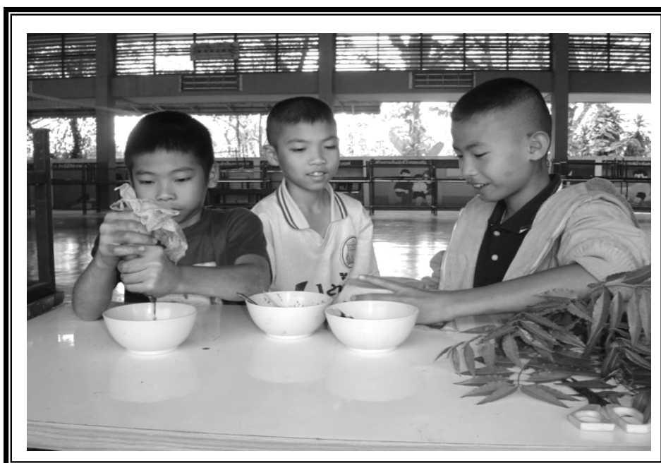
คั้นเอาน้ำสมุนไพร เพื่อทดลองสารคลุกเมล็ด ป้องกันมดและแมลงก่อนการหว่าน