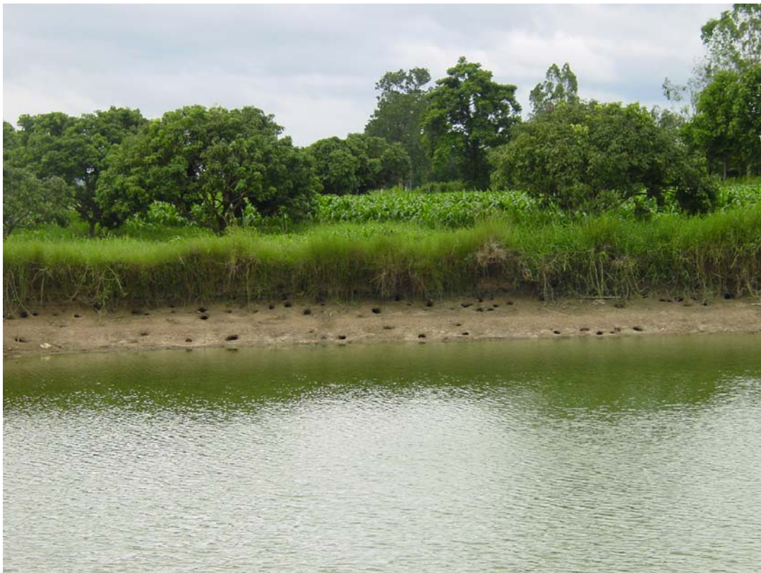
ภาคผนวกที่ 1