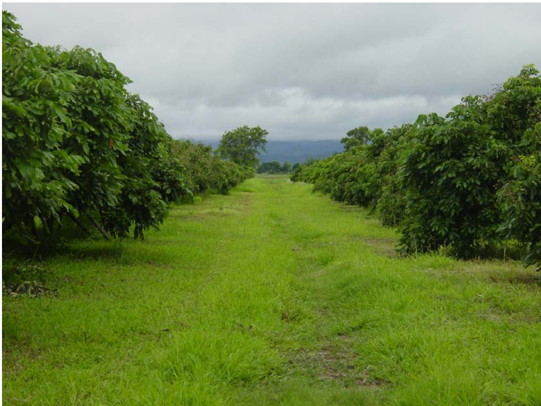
ภาคผนวกที่ 1