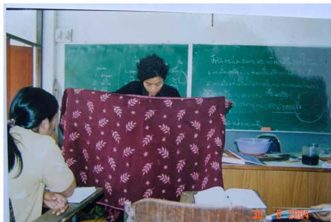
ผ้าพิมพ์ลายโดยใช้แม่พิมพ์จากไม้แกะสลักพบที่ปัตตานี