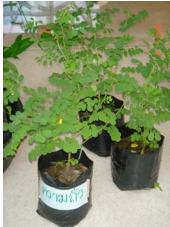
ต้นครามถั่ว พันธุ์ฝักตรง