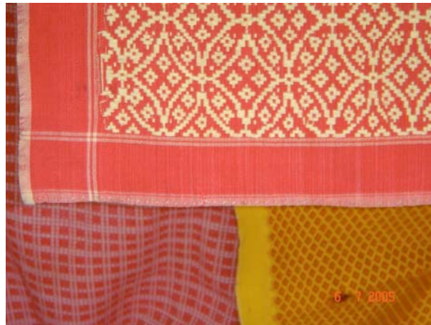
ผ้าพื้นบ้านในวิถีชีวิตและวัฒนธรรมดั้งเดิมบ้านนาหมื่นศรี