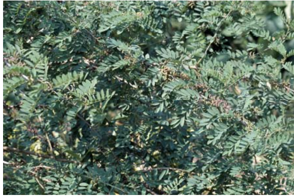
ต้นครามถั่ว พันธุ์ฝักตรง พบที่ปัตตานี