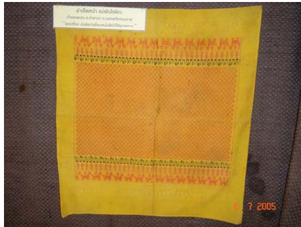
ผ้าปูกราบพระของแม่พัน โชติกะ