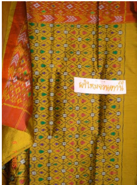
ผ้าจวนตานี