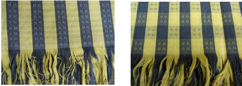
ผ้าฝ้ายยกดอกบนฝ้ายลายล่อง กลุ่มทอผ้าบ้านกระแสนธุ์