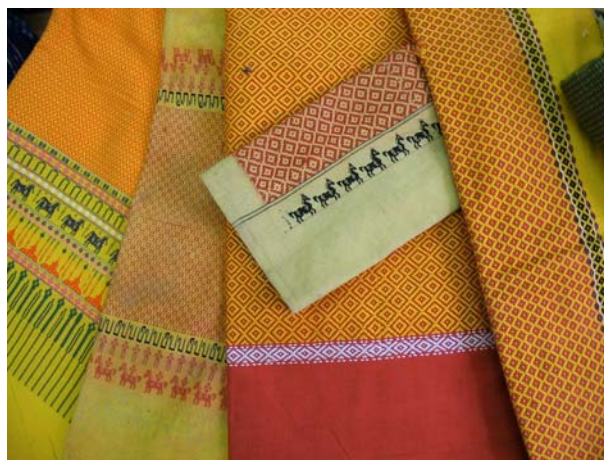
ผ้าพื้นบ้านในวิถีชีวิตและวัฒนธรรมดั้งเดิม บ้านเทพเสน อ.ท่าศาลา จ.นครศรีธรรมราช