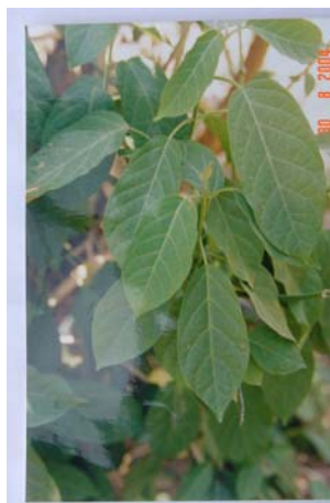
ใบเปือกที่ขอนแก่น