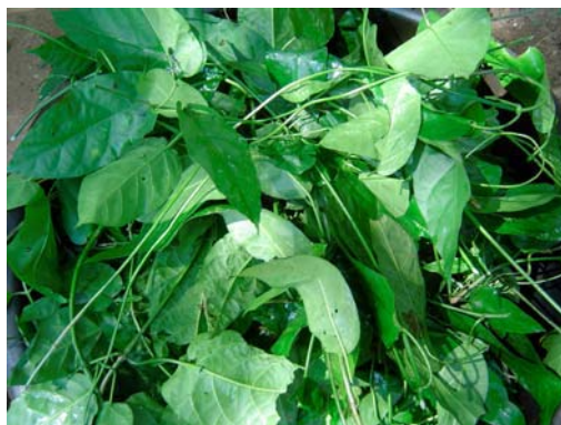
ย่านครามที่บ้านคีรีวง