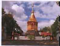
พระธาตุดอยสะกาน

ทิศตะวันออก ได้แก่ พระธาตุดอยฮวก(ภูดอยฮวก) บอกไม้ฮวก(ไม้ไผ่) ที่เรียกว่า หัวยเล็ก (หัวยเล็ก)ปัจจุบันเป็นสำนักงานเทศบาลตำบลแม่แจ่ม 1