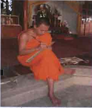
ภาพที่ 3.6 รูปเนรน้อยจารธรรม

ในอดีตภิกษุสามเณรที่เข้ามาอยู่ในวัดก็จะฝึกเรียนอักษรขรรพัญชนะ ตัวหนังสือล้านนาให้อ่านออกเขียนได้เสียก่อน จึงจะได้เรียนบทสวดมนต์และวิชาการต่าง ๆ ไม่ว่าจะเป็นตำราการสร้างบ้านปลูกเรือนเขาเรียกว่า "สะล่า" การเรียนพีชสมุณไพโรรักษาคน เรียกว่า "หมอยา" แต่นี้จะขาดไม่ได้คือ แบบสวดมนต์หรือศาสนพิธีหรือพิธีกรรมที่จำเป็นในชีวิตประจำวันได้แก่ สูตรล้านนา