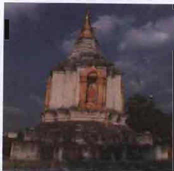
พระธาตุช่างเคิง