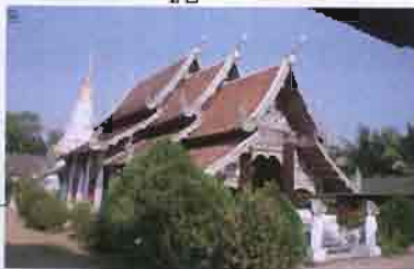
ภาพที่ 3.12 รูปพระวิหารสามจัว

"กุฏิที่แปลกไปจากที่อื่นก็คือ วัดพุทธเอ็น จะเป็นกระตึกเป็นเหมือนศาลา แต่จะปิดทั้ง 4 ด้านมีประตูเดียว และแบ่งเป็นสามห้อง ห้องแรกเป็นห้องเก็บของใช้ เช่น อาสนะ พรหมณี สัปทน เสื้อ หมอน ห้องที่สอง เป็นห้องเก็บพระพุทธรูปและเครื่องบูชาต่าง ๆ ห้องที่สาม เป็นห้องนอนเจ้าอาวาส ห้องที่สี่ เป็นห้องโถงยาวเป็นที่นอนของภิกษุสามเณรและเด็กวัดกระตึกไม่มีหน้าต่างมีแต่เครื่องหมายบอก พอเห็นแสงและอากาศถ่ายเทเท่านั้น วัสดุที่ใช้เก็บ คือ อิฐมอнок่อนโต ๆ เป็นดินที่เผาเองกว้างประมาณ 5 นิ้ว ยาวประมาณ 10 นิ้ว พอก่อนเสร็จก็ฉาบด้วยปูนขาวมุงหลังคาด้วยดินขอ" 45