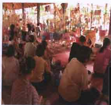
ภาพที่ 3.10 รูปประเพณีทำบุญสลากภัต

เดือนสิบ (เดือน 8 ใต้) จะมีประเพณีเข้าพรรษา