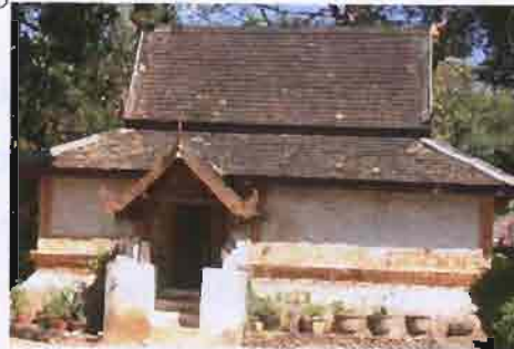
ภาพที่ 3.7 รูปหอธรรมที่คูบาเตจ๊ะได้สร้าง

การสวดมนต์นั้นจะสวด ตามลำดับวันเรียกว่า "สวดประจำวัน"