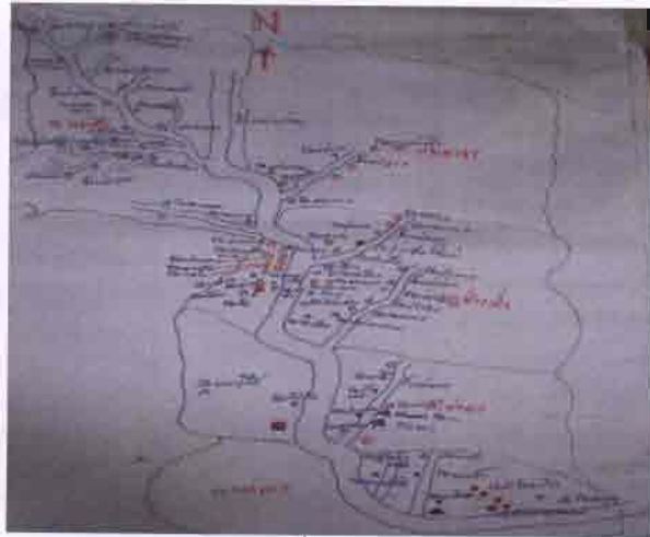
3.4 แผนที่วัดราง วัดนาง

ในสมัยนั้นมีชนเผ่าละว้าหรือลัวะ อาศัยอยู่ในเมืองแจ่มและดินแดนแถบนี้เป็นจำนวนมาก ชนเผ่าดังกล่าวจะเคารพนับถือและยึดมั่นในพระพุทธศาสนาเป็นอย่างมาก เมื่อไปตั้งถิ่นฐานอยู่ที่ใดจะสร้างวัดขึ้น เพื่อเป็นสถานที่ประกอบพิธีทางศาสนา