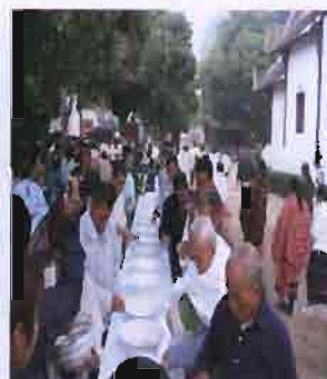
ภาพที่ 3.8 รูปเผาหั่วพระเจ้า

เดือนสี่ (เดือน 2 ใต้) จะมีประเพณีทางข้าวใหม่เผาหั่วพระเจ้า หลังจากเก็บ เกี่ยวข้าวในนาแล้ว ก่อนที่จะเอาข้าวใหม่นั้นมากินจะต้องถวายวัดก่อน โดยเอาข้าวเปลือกบ้างข้าวสาร บ้างไปกองรวมกันที่วัด ข้าวสุกก็นำเอาไปใส่บาตรพระพร้อมกับการทานขันข้าวอุทิศไปให้บรรพบุรุษที่