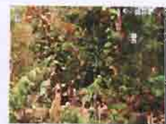
พระธาตุดอยฮวก