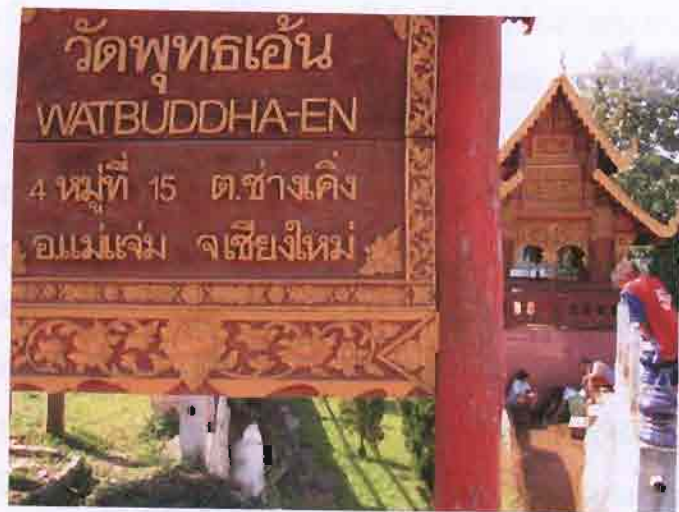
ภาพที่ 3.3 วัดพุทธเอ็น หรือเรียกว่า วัดพุทธเอ็น

นอกจากนั้นแล้ว หลวงพ่อนวนตำเล่าว่า “หลังจากพระพุทธเจ้าได้เสด็จมาที่พระบาทตากผ้า พระองค์ได้เสด็จมาที่พระบาทยังหวัด แล้วเสด็จมาที่วัดพระเกิด เพื่อรอให้ศีลแก่ยักษ์ที่กินคนในจอมทอง จากนั้นก็ได้มาที่พระบาทแม่หมิง มาช่วงนั้นน้ำขุนไม่สามารถจับได้ พระองค์ก็อธิษฐานให้น้ำจันออกมาที่น้ำแม่อกฮู ในการเสด็จมาครั้งนั้นพระพุทธองค์ได้นำพระอรหันต์มาด้วย 8 รูป รวมทั้งพระกัจจายนะเถระด้วย พระองค์ได้พักที่ดอยสะกาน แล้วให้พระสงฆ์อยู่พักแม่น้ำแจ่มข้างละ 4 รูป น้ำแจ่มของพระสงฆ์ที่อยู่ฝั่งวัดพุทธเอ็นไม่มีน้ำจันท์ พระพุทธองค์เลยบ้วนน้ำลายให้พระอรหันต์เป็นน้ำบ่อทิพย์ แล้วเอ็นออกไปว่าไม่ต้องข้ามมานะ เดิมวัดพุทธเอ็นเรียกว่า “วัดพุทธเอ็น”