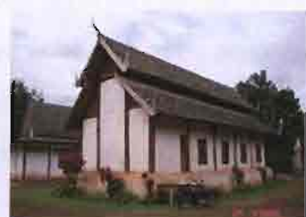
ภาพที่ 3.14 รูปพระวิหารหนึ่งจัว