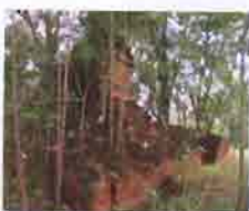
พระธาตุม่อนดินดั่ง