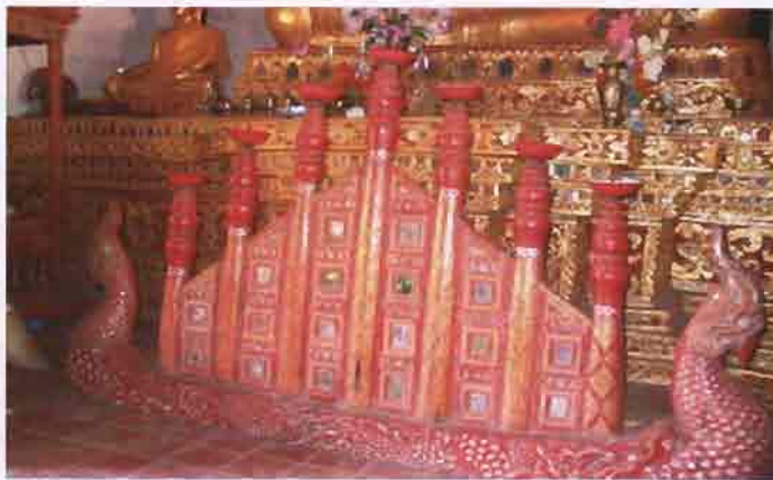
ภาพที่ 3.15 รูปสัตภัณฑ์ ที่ใช้ก่อนโต๊ะหมู่บูชาจะเข้ามา

เมื่อธรรมมาสน์เข้ามา ก็เริ่มมีโต๊ะหมู่บูชาเข้ามาปี พ.ศ. 2495 สมัยอดีต วัดในอำเภอแม่แจ่มและ ละวัดไม่มีโต๊ะหมู่บูชาหน้าประธาน เวลาจะไหว้พระรับศีลในวันทำบุญใช้สัตภัณฑ์ หมายถึงเขารอบพระ เมรุ หรือเทียบกับโพชฌงค์ 7 ประการ ในปัจจุบันนี้ในพระวิหารหน้าประธานจะมีโต๊ะหมู่บูชา เกือบทุกวัด ในอำเภอแม่แจ่ม บางวัดมีโต๊ะหมู่ 7 โต๊ะหมู่ 9