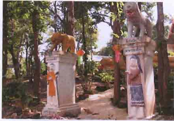
ภาพที่ 3.1 รูปปั้นที่วัดพระธาตุดอยสะเกง

เมื่อได้ทราบความเช่นนั้น จึงแบ่งพื้นที่การปกครองให้ โดยถามพ่อค้าที่ผ่านมาจากทางนั้น ขุนน้ำกับสบน้ำนี้ครึ่งกันตรงไหน พ่อค้าบอกว่าครึ่งกันตรงนี้แหละ พระพุทธเจ้าจึงกองไม้ ชิดเป็นรอย แล้วตัดสินให้สิงห์ผู้ปกครองเขตเหนือ สิงห์ผู้น้องปกครองเขตใต้รอยไม้เท่านั้น