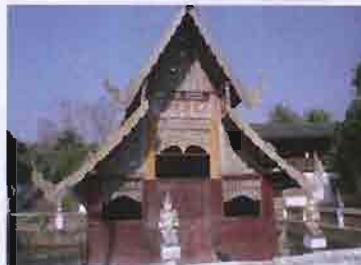
ภาพที่ 3.5 รูปหัวหมวดอุโบสถในอดีต

การกล่าวถึงการจัดหัวหมวดอุโบสถ ดังมีปรากฏข้อความในการจัดหมวดอุโบสถของ เชียงใหม่ มีข้อความตอนหนึ่งว่า