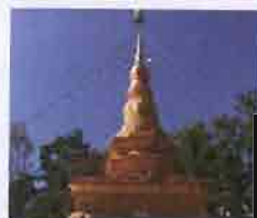
พระธาตุดอยภูใต้