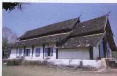
ภาพที่ 3.13 รูปพระวิหารสองจัว