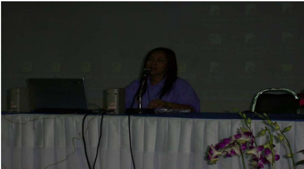
ผู้ประสานงาน ..นำเสนอผลการดำเนินงาน “โครงการต่อสู้เพื่อเอาชนะความยากจนภาคประชาชน” (ศตจ.ปชช.)