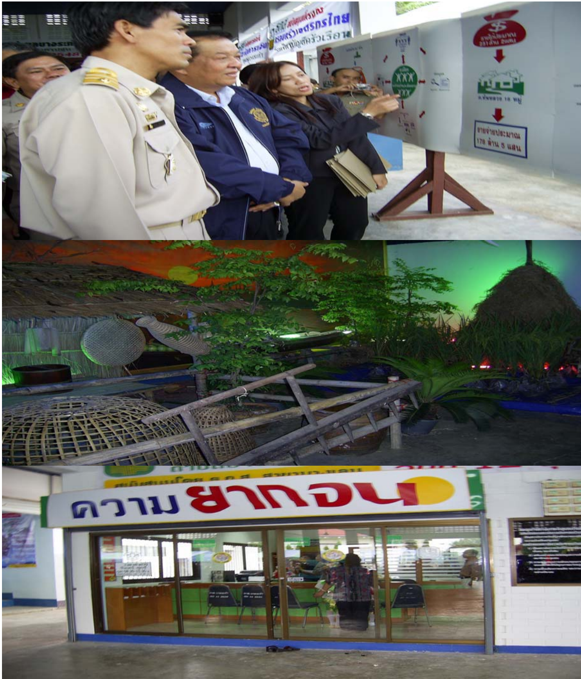
(สถาบันการเงินชุมชนตำบลบางระกำ อำเภอสамพราน)