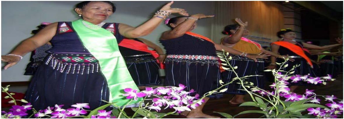
การแสดงตำบลคอนข่อย อำเภอกำแพงแสน (ไทยทรงดำ)

การแสดงภูมิปัญญาชาวบ้านด้านการอนุรักษ์ เพลงพื้นบ้าน และศิลปวัฒนธรรมการดนตรี และการร้องรำ ดั้งเดิมของไทย ที่นำภาคภูมิใจในความเป็นไทย