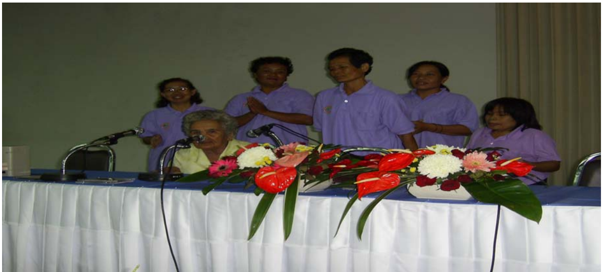
การขับร้องเพลงพื้นบ้านของผู้สูงอายุ ตำบลทัพหลวง อำเภอเมือง