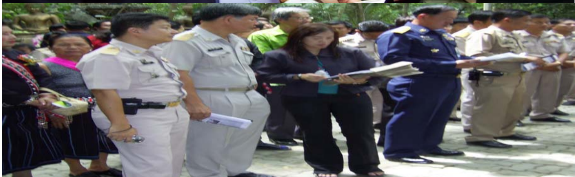
(วัดดอนทอง ตำบลดอนข่อย)

ภาคประชาชน..และข้าราชการ ร่วมประสานการดำเนินการต้อนรับด้วยความอบอุ่น.....และเยี่ยมชม กิจกรรมต่างๆ เช่น ผลิตภัณฑ์สินค้าไทยทรงดำ และเกษตรผสมผสาน กับชีวิตพอเพียง.