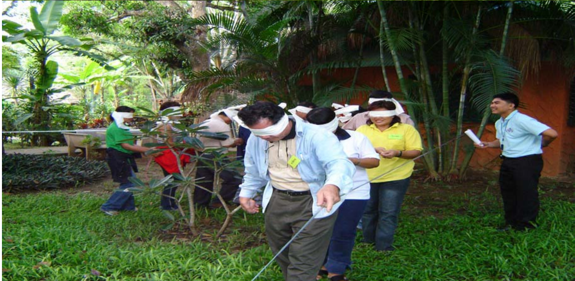
กิจกรรมเสริมสร้างการเรียนรู้...การปิดตาเดินตามผู้นำ