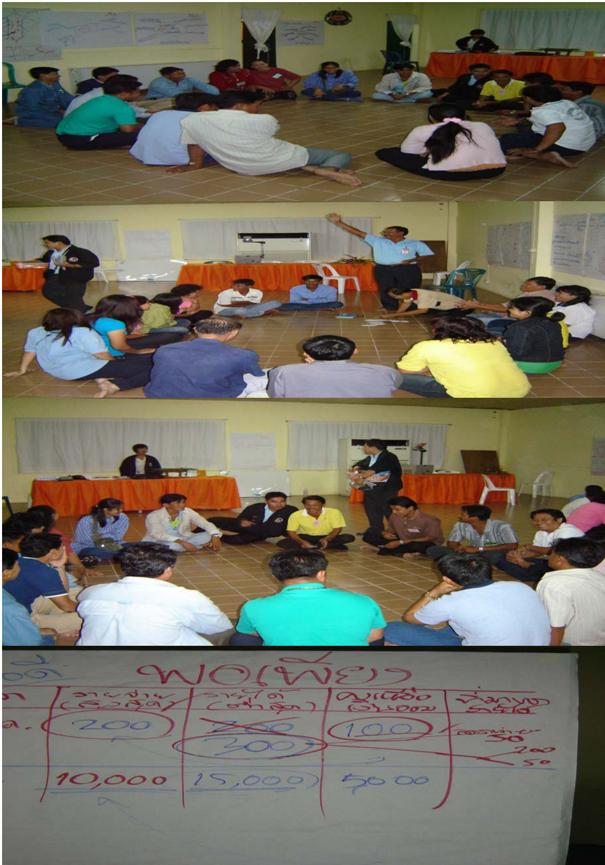
กิจกรรมวัดใจ.....การเรียนรู้...พอเพียงกับทุนนิยม