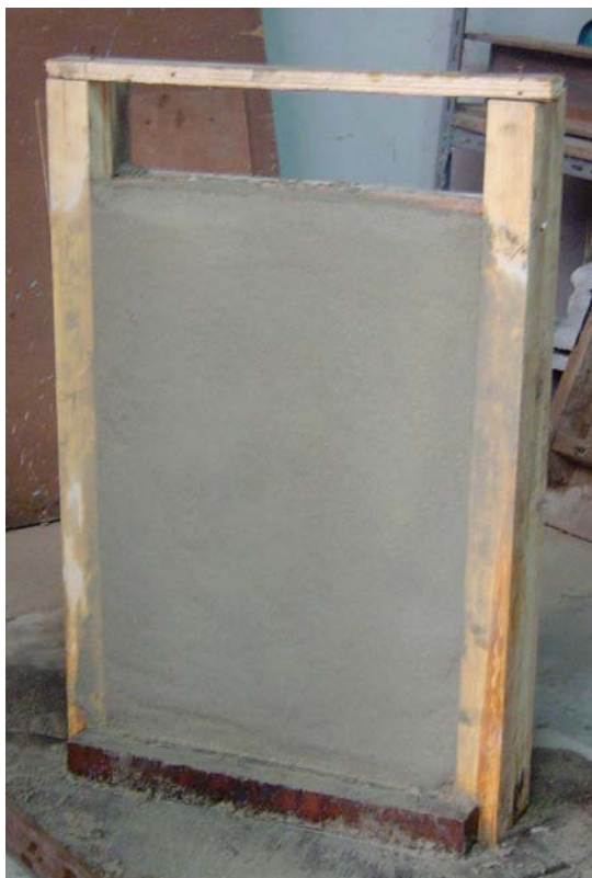
(ก) ก่อนถอดโครงไม้