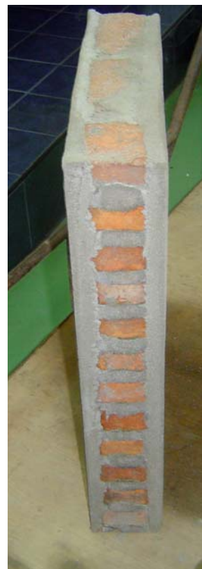
(ข) หลังถอดโครงไม้