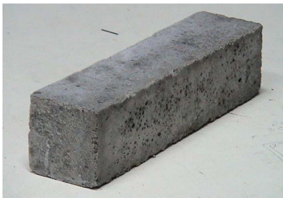
(ข) กำลังรับแรงดัด