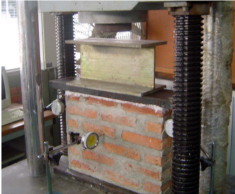
0) แผงกำกับตัวอย่างบนแท่นอุปกรณ์การทดสอบพร้อมทั้งติดตั้งมาตรวัดการเคลื่อนที่