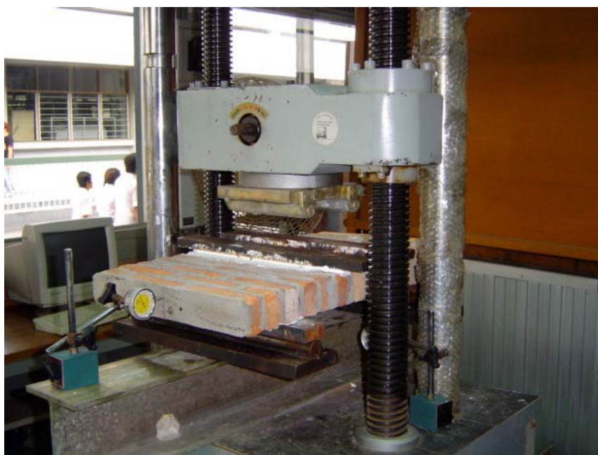
(ก) การติดตั้งตัวอย่างกำแพงเพื่อทดสอบแรงดัด

การวัดค่าการแอ่นตัวทำได้หลังจากให้แรงกดจากเครื่องทดสอบ ในแนวดิ่งด้วยอัตราแรงกดสม่ำเสมอลงบนตัวอย่างผนังก่ออิฐ โดยผลของมาตรวัดการแอ่นตัวที่ 1,2,3 และ 4 จะแสดงค่าในอุปกรณ์บันทึกข้อมูล (Data Logger) พร้อมทำการจดค่าแรงที่ได้ทุกๆ 5 วินาที จนกระทั่งตัวอย่างผนังก่ออิฐเกิดการวิบัติจึงจะหยุดการทดสอบและการอ่านค่า แล้วนำค่าที่ได้มาเขียนกราฟแสดงความสัมพันธ์ระหว่างแรงดัดกับการยุบตัวเช่นเดียวกันกับการทดสอบกำลังรับแรงอัด