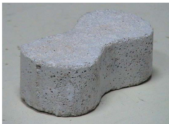
(ค) กำลังรับแรงดึง

รูปที่ 3.1 ก้อนตัวอย่างเพื่อการทดสอบกำลังการรับแรง