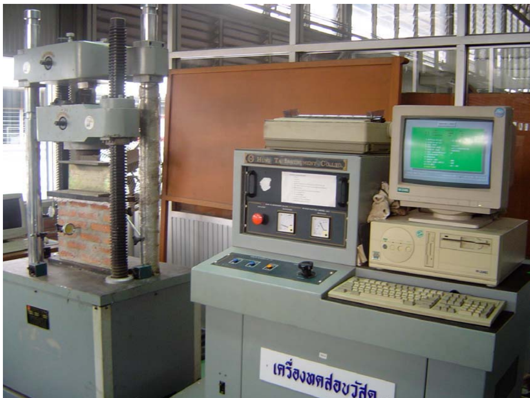
0) ภาพรวมของการทดสอบ และอุปกรณ์บันทึกขนาดแรงและการเคลื่อนที่

รูปที่ 3.3 การติดตั้งตัวอย่างเพื่อทำการทดสอบกำลังรับแรงอัด