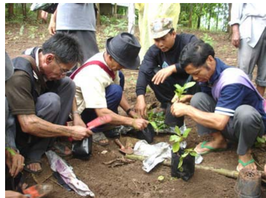
ฝึกอบรมเพาะพันธุ์สมุนไพรหมอไทใหญ่