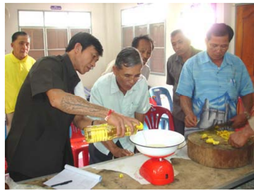
การฝึกอบรมถ่ายทอดความรู้หมอไทใหญ่ กลุ่มหมอยา “ฝึกแปรรูปยา”