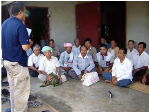
ประชุมหมอไทใหญ่เพื่อเตรียมความพร้อม