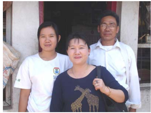
ทายาทหมอไทใหญ่ที่ได้รับทุน เข้าเรียนต่อโปรแกรมการแพทย์แผนไทย ณ วิทยาลัยการแพทย์พื้นบ้านฯ มรช.