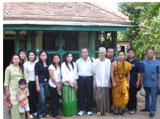
ถ่ายรูปพร้อมกับหมอไทใหญ่เชียงตุง 30 เมษายน 2550