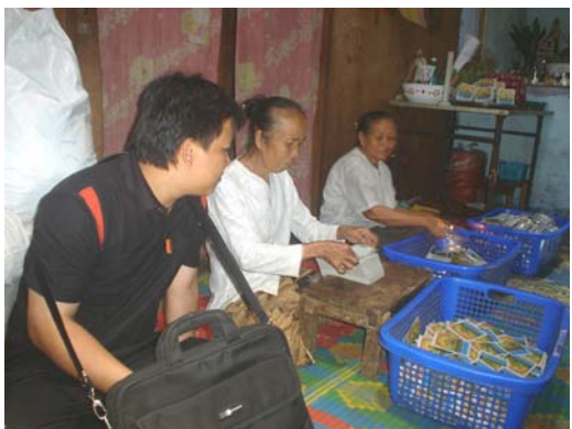
เยี่ยมชมโรงงานผลิตยาของหมอไทใหญ่ เชียงตุง 29 เมษายน 2550