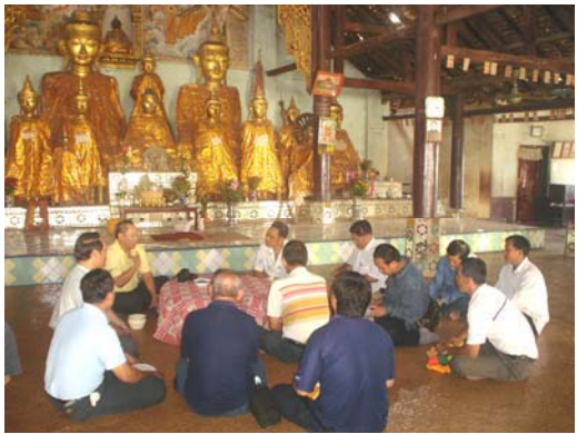
ประชุมพบปะหมอไทใหญ่เชียงตุง เมียนมาร์ 28 เมษายน 2550