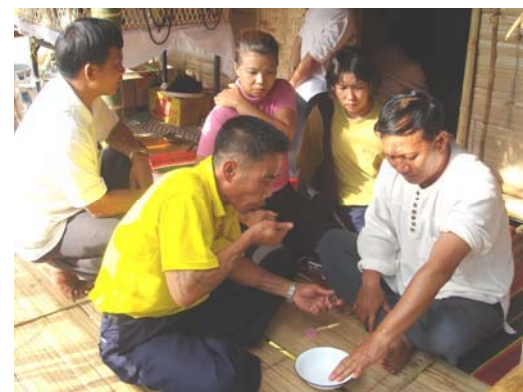
บริการสุขภาพ ในงานมหกรรม 5-9 มกราคม 2550