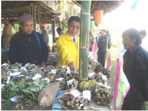
แสดงตัวอย่างตำรับยาสมุนไพร ในงานมหกรรม 5-9 มกราคม 2550