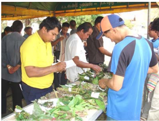
การฝึกอบรมถ่ายทอดความรู้หมอไทใหญ่ กลุ่มหมอยาเรียนรู้สมุนไพรไทใหญ่