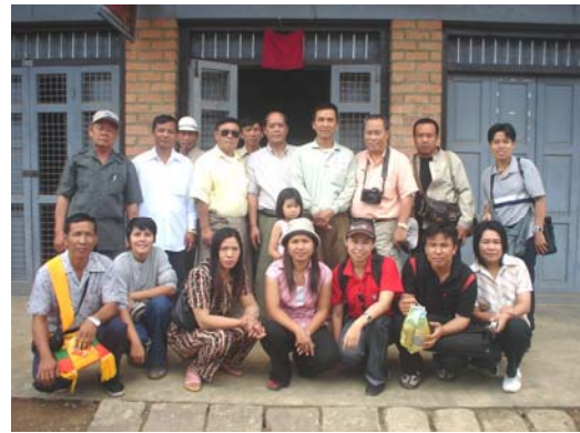
เยี่ยมชมโรงงานผลิตยาของหมอไทใหญ่ เชียงตุง 29 เมษายน 2550