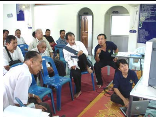
ตรวจสอบข้อมูลสมุนไพรไทใหญ่