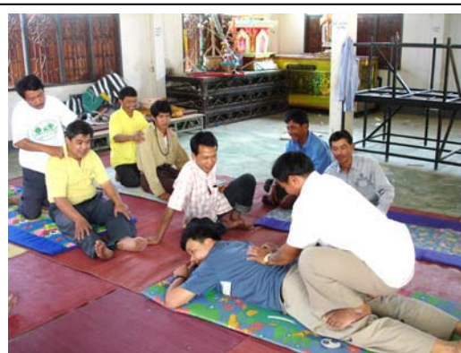
การฝึกอบรมถ่ายทอดความรู้หมอไทใหญ่ ครูหมอไทใหญ่ถ่ายทอดความรู้การบีบมัน