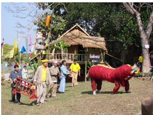
แสดงวัฒนธรรมไทใหญ่ “รำโต” ในงานมหกรรม 5-9 มกราคม 2550