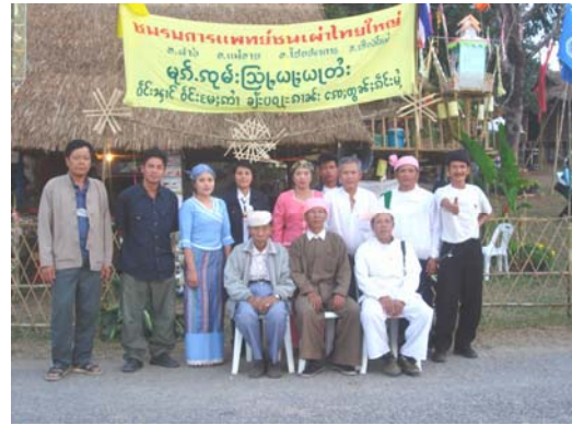
เครือข่ายหมอไทใหญ่ ในงานมหกรรม 5-9 มกราคม 2550