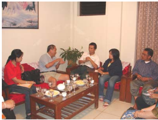
ประชุมร่วมกับหมอไทใหญ่ในเชียงใหม่ เรื่องการรับทายาหมอไทเข้าศึกษาต่อ ที่ วิทยาลัยการแพทย์พื้นบ้านฯ มรช.