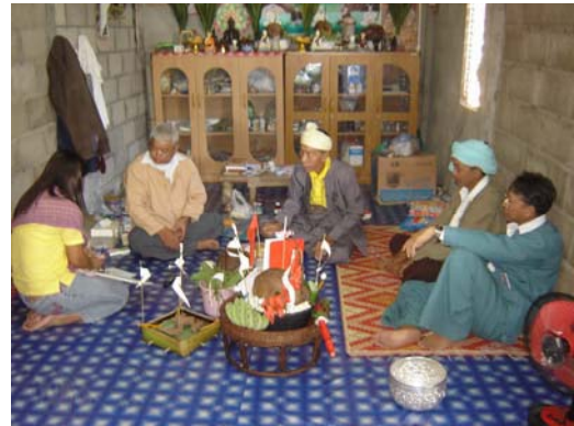
เก็บข้อมูลด้านพิธีกรรมหมอไทใหญ่