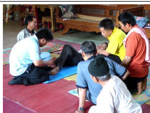
การฝึกอบรมถ่ายทอดความรู้หมอไทใหญ่ กลุ่มหมอกายเรียนรู้ “การตอกเส้น”