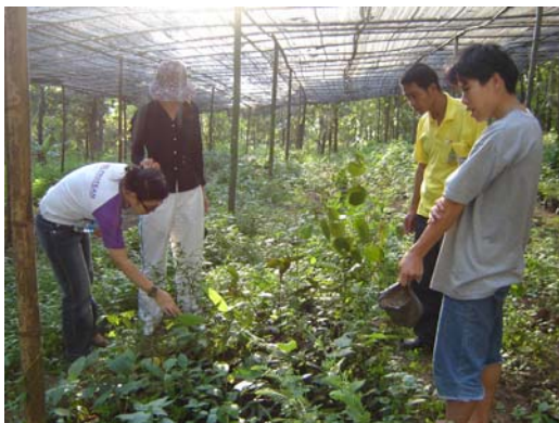
ศูนย์รวบรวมพันธุ์ของเผ่าไทใหญ่