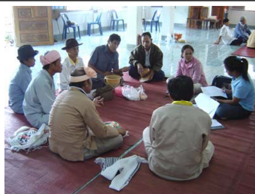
เก็บข้อมูลหมอยาสมุนไพรไทใหญ่