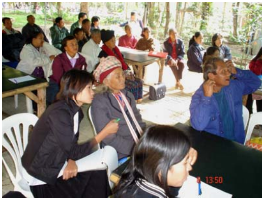
หมอชนเผ่าละหู่เข้าร่วมพัฒนาโครงการ