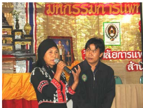
รายงานผลงานวิจัยการแพทย์ชนเผ่าละหู่ ในงานมหกรรม 5-9 มกราคม 2550