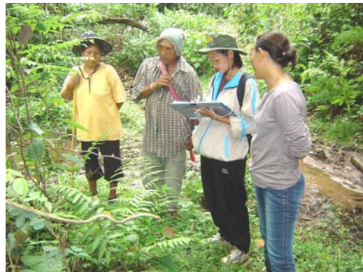
สำรวจสมุนไพรชนเผ่าละหู่ บ.ห้วยชมพู