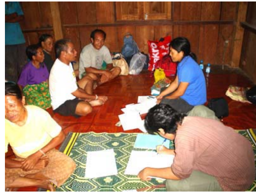
เก็บข้อมูลการดูแลรักษาสุขภาพ บ.ห้วยป่าไร่