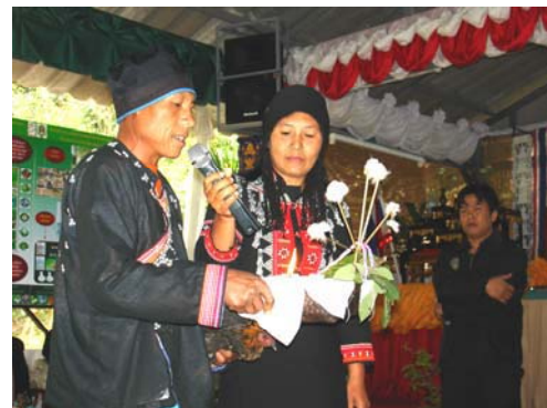
สาธิตการดูแลรักษาสุขภาพด้วย “พิธีกรรมสู่ขวัญ” ในงานมหกรรม 5-9 มกราคม 2550