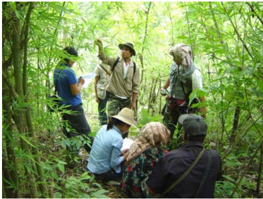
สำรวจสมุนไพรชนเผ่าละหู่ บ.ห้วยป่าไร่