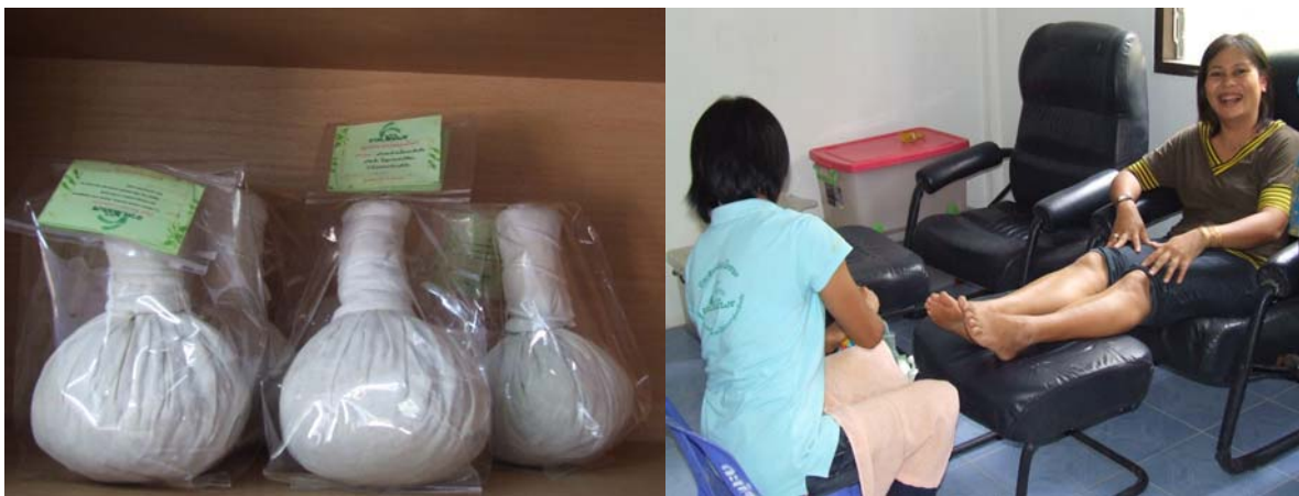
ตัวอย่างผลิตภัณฑ์ ด้านจิตใจและอารมณ์

ภาพที่ 4.11 ตัวอย่างผลิตภัณฑ์การท่องเที่ยวเชิงสุขภาพแบบสมัยใหม่ในจังหวัด สุรินทร์ (ต่อ)