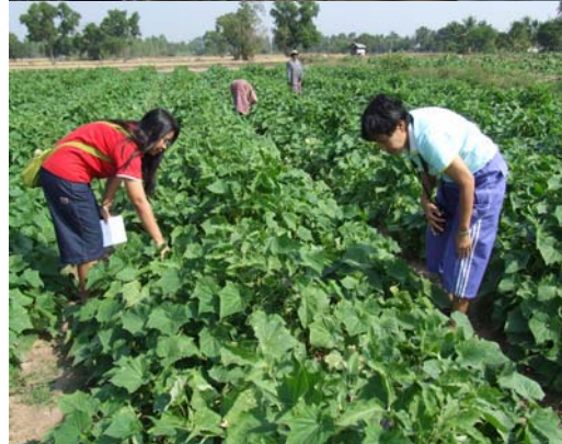
ตัวอย่างผลิตภัณฑ์อาหาร