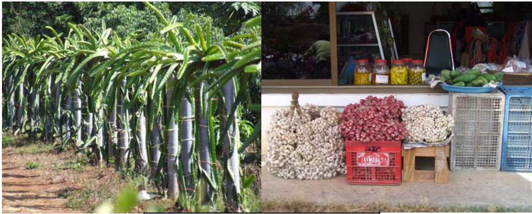
ตัวอย่างผลิตภัณฑ์อาหาร