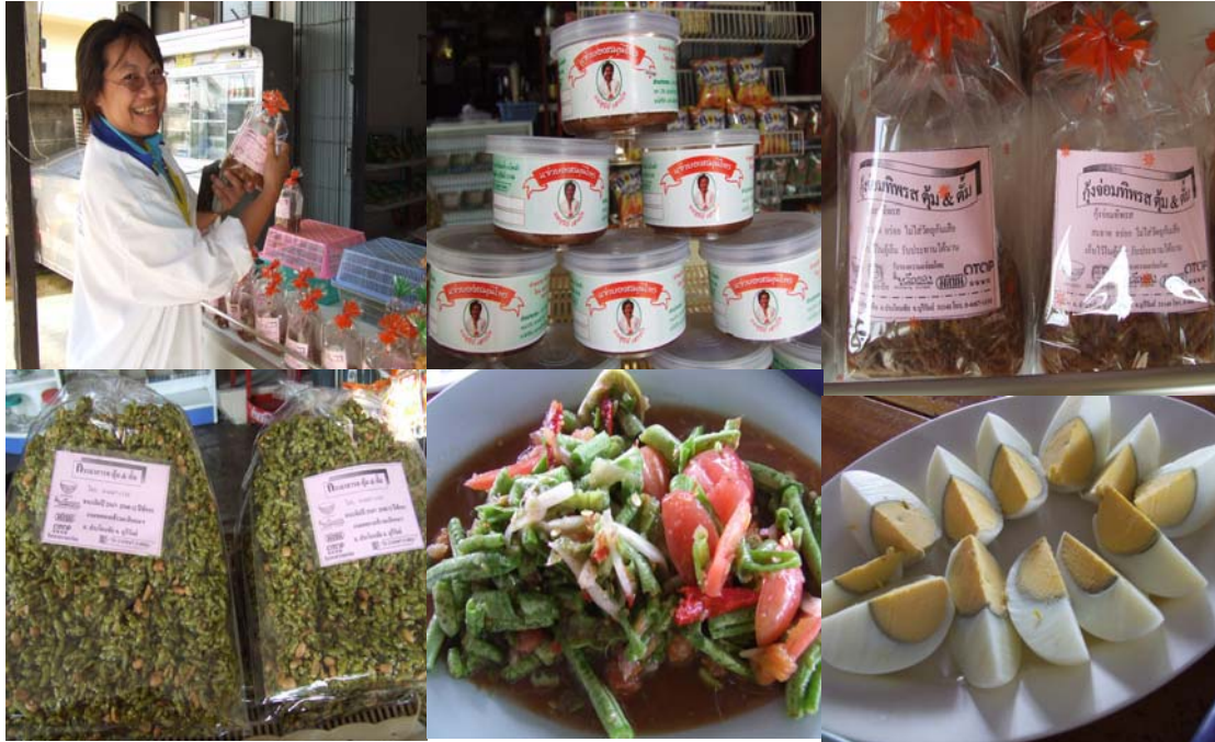
ตัวอย่างผลิตภัณฑ์อาหาร