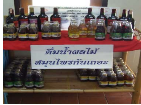
ตัวอย่างผลิตภัณฑ์อาหาร