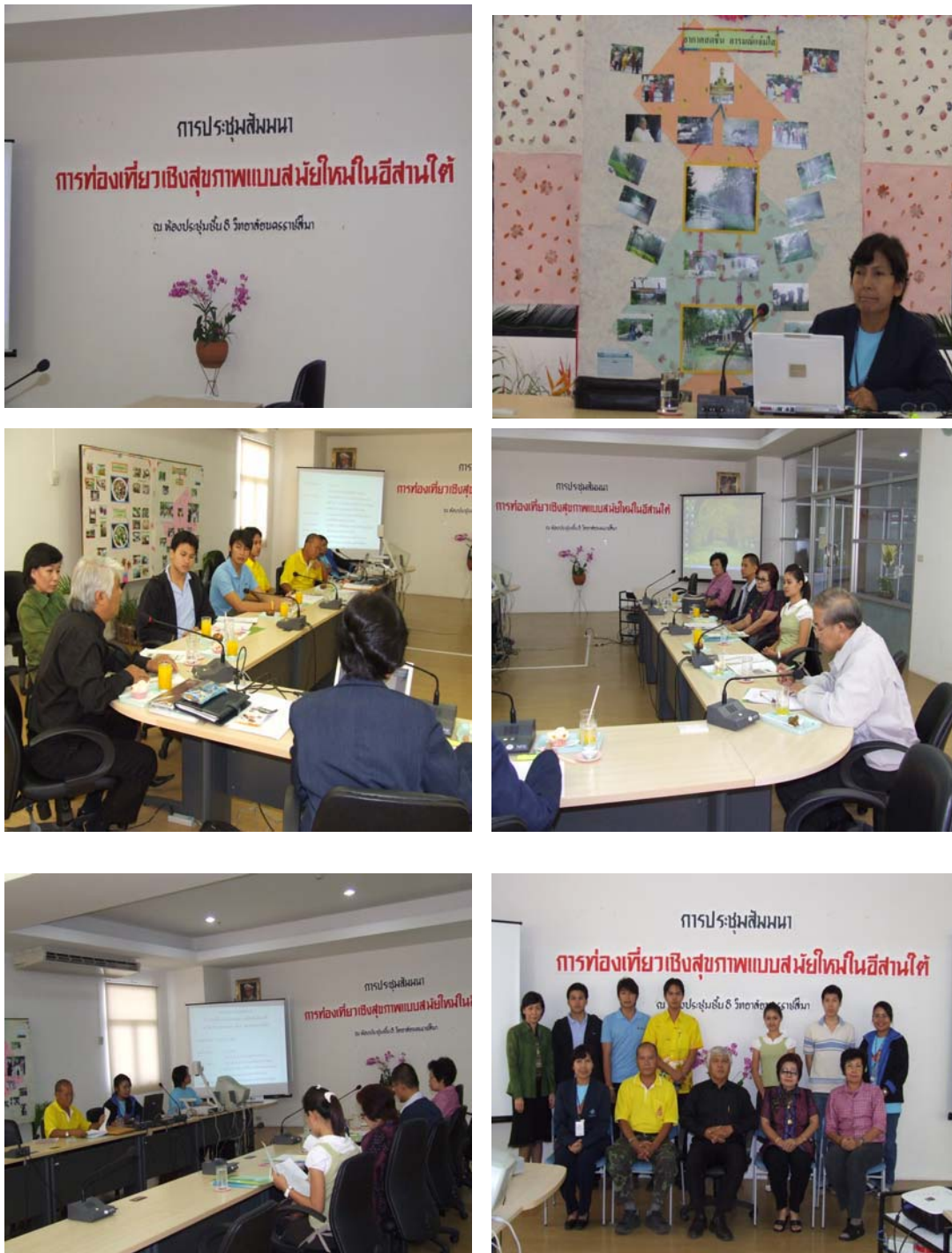
ภาพที่ 4.9 การประชุมสัมมนาผู้ทรงคุณวุฒิ ผู้ประกอบการการท่องเที่ยว ผู้บริหารแหล่งท่องเที่ยวในอีสานใต้