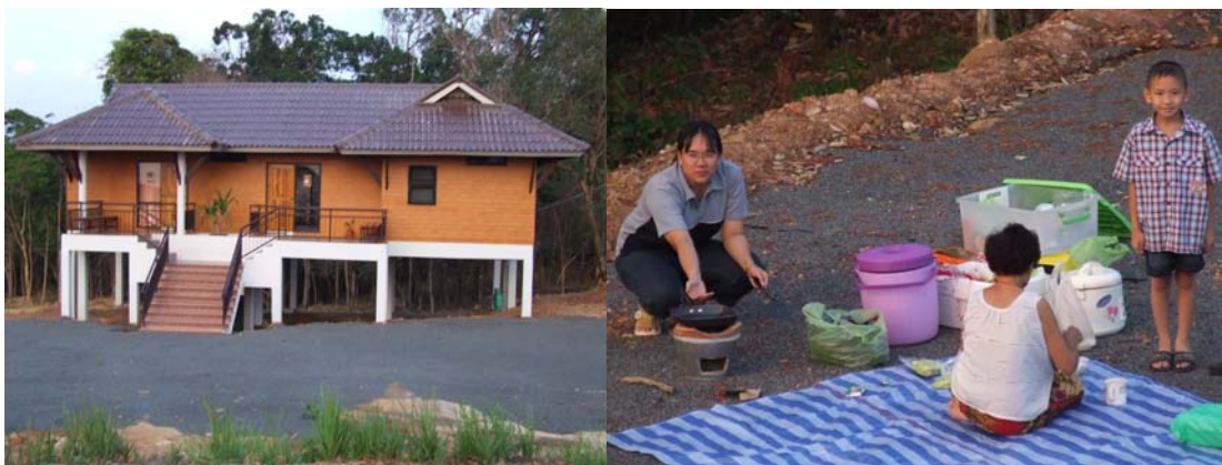
ตัวอย่างผลิตภัณฑ์ที่พักอาศัย