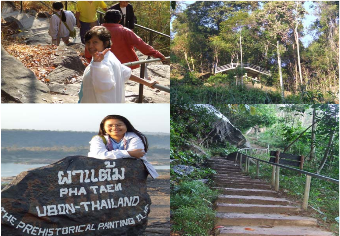
ตัวอย่างผลิตภัณฑ์ การออกกำลังกาย