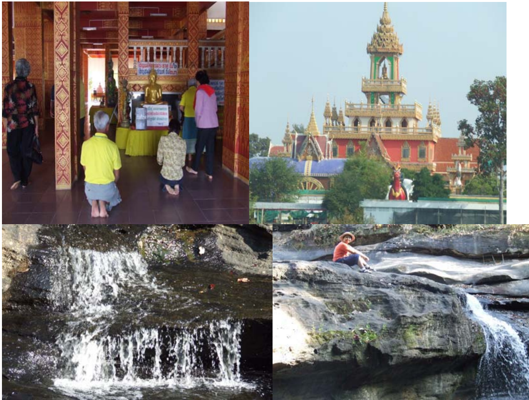
ตัวอย่างผลิตภัณฑ์ด้านจิตใจและอารมณ์