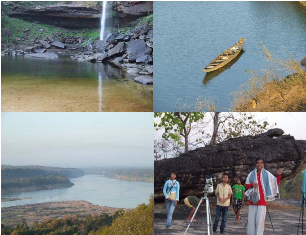
ตัวอย่างผลิตภัณฑ์ ด้านจิตใจและอารมณ์

ภาพที่ 4.12 ตัวอย่างผลิตภัณฑ์การท่องเที่ยวเชิงสุขภาพแบบสมัยใหม่ในจังหวัด อุบลราชธานี