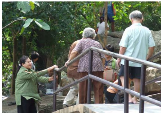
ภาพที่ 4.14 ตัวอย่างผลิตภัณฑ์การท่องเที่ยวเชิงสุขภาพแบบสมิในจังหวัด ชัยภูมิ