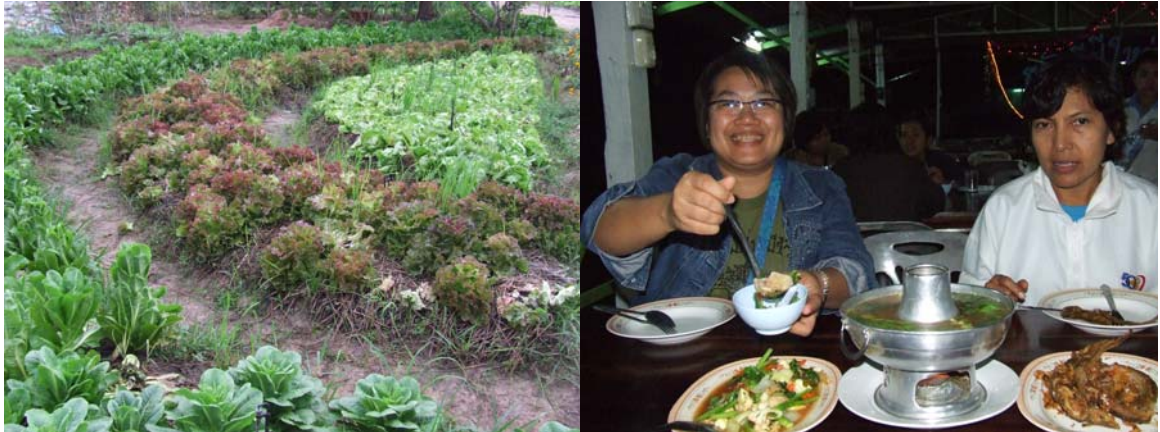
ตัวอย่างผลิตภัณฑ์อาหาร ร้านอาหารที่ใช้ผักปลอดสารพิษซึ่งปลูกรอบบริเวณร้านอาหาร