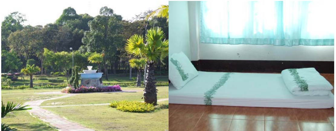
ตัวอย่างผลิตภัณฑ์ที่พักอาศัย ในบรรยากาศธรรมชาติ