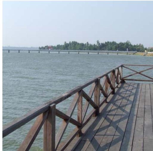
ตัวอย่างผลิตภัณฑ์ที่พักอาศัย อากาศสดชื่น