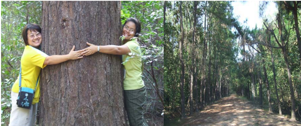
ตัวอย่างผลิตภัณฑ์ การออกกำลังกาย