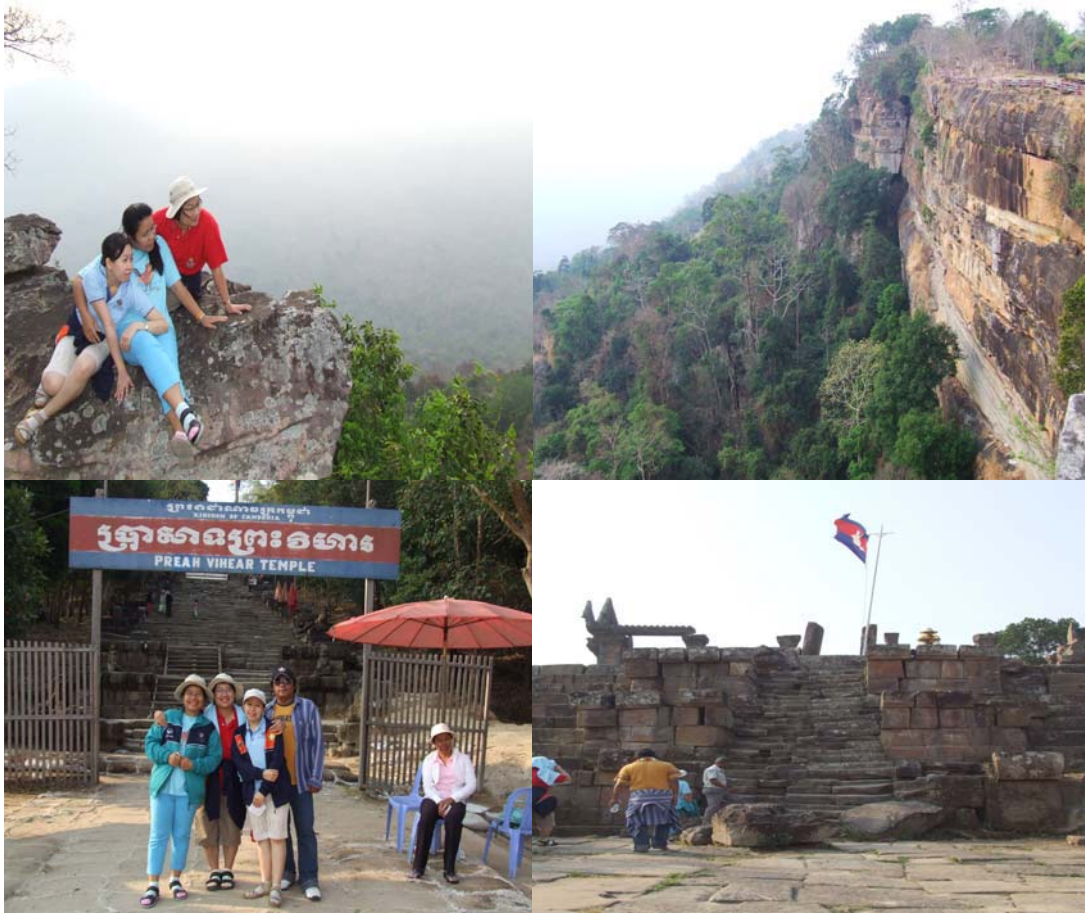
ตัวอย่างผลิตภัณฑ์ด้านจิตใจและอารมณ์