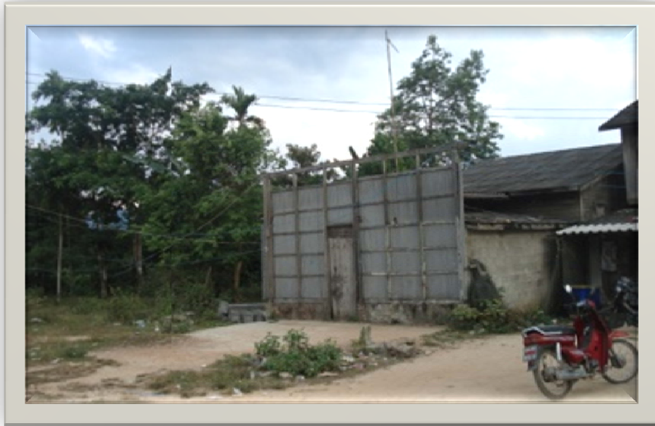
สภาพบ้านที่ถูกรื้อถอน