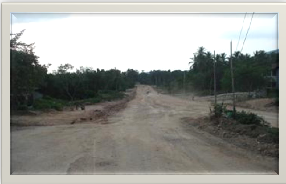
ถนนสี่เลนตัดผ่านบ้านตะโหนดแต่ยังสร้างไม่เสร็จ

ในหน้าฝนของทุกปีถนนสี่เลนที่ยังไม่มีการลาดยาง ถนนเป็นดินแดงจะกลายดินเลนไปมาไม่สะดวกและปัญหาจากการขยายถนนให้กว้างกว่าเดิมทำให้บ้านที่ติดริมถนนต้องรื้อ ย้ายจึงเกิดการอพยพไปปลูกบ้านในพื้นที่ใหม่เป็นผลทำให้เกิดการห่างไกลระหว่างกลุ่มเครือญาติ ต่อมาชาวบ้านได้ร้องทุกข์ถึงความยากลำบากในการดำเนินชีวิตต่อปัญหาถนนสี่เลนที่ทำไม่เสร็จต่อ สอ.บต (ศูนย์อำนวยการบริหารจังหวัดชายแดนภาคใต้)