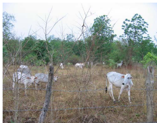
ภาพที่ 4 การเลี้ยงโคฝูงในแปลงหญ้าธรรมชาติ

(4) การเลี้ยงโคขุน เป็นการเลี้ยงโคเนื้อเพื่อให้ได้น้ำหนักส่งฆ่าและคุณภาพที่ตลาดต้องการ การเลี้ยงโคขุนในจังหวัดตาก ประกอบด้วยโค 2 สายเลือด ได้แก่โคลูกผสมบราห์มันเลือดสูง และโคพันธุ์ตาก (ลูกผสมชาโรเลส์) การขุนโคลูกผสมบราห์มัน ผู้ขุนโคจะไปคัดเลือกโคจากตลาดนัดโคกระบือ ขนาดน้ำหนักประมาณ 250-300 กิโลกรัม มาดำเนินขุนในคอก พร้อมถ่ายพยาธิ ตรวจโรค ฉีดวัคซีน และให้อาหารข้น (ในอัตราต่ำ) ประมาณ 3 เดือน หรือน้ำหนักประมาณ 380-400 กิโลกรัม จึงนำออกจำหน่ายส่งตรงไปยังโรงฆ่าสัตว์ สำหรับโคพันธุ์ตาก (ลูกผสมชาโรเลส์) การขุนจะเน้นที่อาหารข้นเป็นหลัก ร่วมกับอาหารหยาบ ในบริเวณคอกเลี้ยง พร้อมดูแลสุขภาพสัตว์อย่างดี โดยน้ำหนักเข้าขุนประมาณ 300 กิโลกรัม ใช้เวลาขุนประมาณ 6-8 เดือน