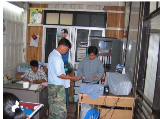
ภาพที่ 24 สถานที่ตั้งสหกรณ์โคเนื้อจังหวัดตาก จำกัด และห้องทำงาน