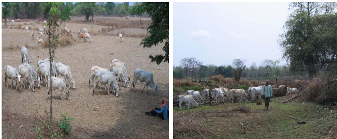
ภาพที่ 7 โคพื้นเมืองไทยใหญ่ที่เลี้ยงอยู่ทั่วไปในจังหวัดตาก

(2) โคลูกผสมบราห์มัน เป็นโคที่มีการเลี้ยงอยู่ทั่วไปในจังหวัดตาก มีลักษณะประจำพันธุ์ที่ชัดเจนโดยทั่วไปคือ สีขาว หนอกใหญ่ ทรนโรคและแมลง