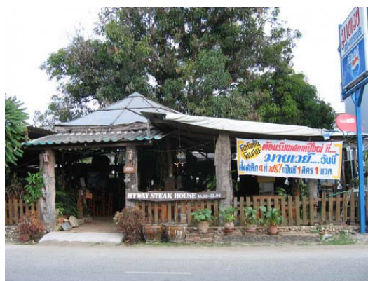
ภาพที่ 22 ร้านจำหน่ายสเต็ก

กล่าวโดยสรุป ตลาดเนื้อโคของจังหวัดตากมีอยู่ไม่มากนัก ผู้บริโภคมีแนวโน้มการบริโภคเนื้อลดลง เนื่องจากความเชื่อทางศาสนา รวมถึงความเชื่อที่ว่า การบริโภคเนื้อโคทำให้เกิดอาการแสลง (ข้อมูลจากผู้ประกอบการโรงงานลูกชิ้นเนื้อโค) อย่างไรก็ตาม ความต้องการเนื้อโคขุนคุณภาพดีของสหกรณ์โคเนื้อ จังหวัดตาก มีปริมาณเพิ่มขึ้น นอกจากนี้ ในกลุ่มผู้บริโภคที่มาจากภาคตะวันออกเฉียงเหนือ ความต้องการบริโภคเนื้อโคยังปกติ ประมาณได้ว่าในพื้นที่อำเภอเมือง บ้านตาก สามเงา และวังเจ้า ปริมาณการบริโภคเนื้อโค ซึ่งส่วนใหญ่เป็นโคไทย น่าจะอยู่ประมาณวันละไม่เกิน 15 ตัว ซึ่งนับว่าน้อยมาก ดังนั้น โคที่เลี้ยงส่วนใหญ่จึงเข้าสู่ตลาดนัด และนำไปจำหน่ายในพื้นที่อื่น