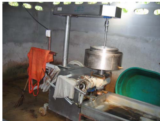
ภาพที่ 18 โรงงานแปรรูปเนื้อ (ลูกชิ้น) อำเภอสามเงา