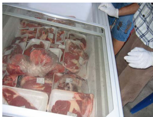
ภาพที่ 21 ร้านจำหน่ายเนื้อและการจำหน่ายเนื้อโคขุนของสหกรณ์โคเนื้อ จังหวัดตาก

(2.1.5) ร้านสเต็ก ในอำเภอเมืองตาก มีร้านสเต็กตั้งอยู่ 2 แห่ง ในตลาด 1 แห่ง และที่ศูนย์วิจัยและบำรุงพันธุ์สัตว์ตาก 1 แห่ง โดยนำเนื้อโคพันธุ์ตากจากศูนย์วิจัยฯ และส่งเสริมให้เกษตรกรรับไปเลี้ยง แล้วผ่านกระบวนการแปรรูป ณ โรงฆ่ามาตรฐานของศูนย์วิจัยฯ มาจำหน่าย