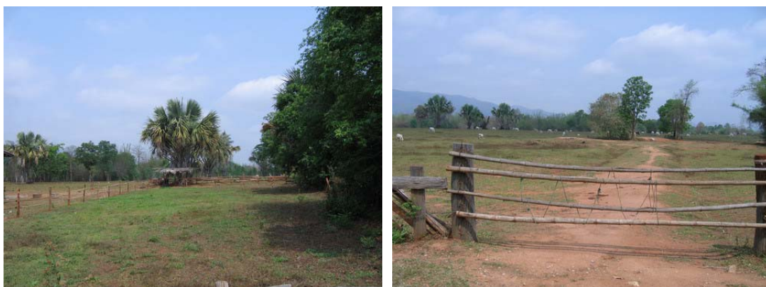
ภาพที่ 11 แปลงหญ้าที่ปัจจุบันมีการล้อมคอกเพื่อการเลี้ยงโคโดยเฉพาะ

จังหวัดตากตั้งอยู่ในภาคเหนือตอนล่าง มีพื้นที่มากเป็นอันดับ 4 ของประเทศ (16,404.6 ตร.กม. หรือ 10,254,156 ไร่) แต่พื้นที่ส่วนใหญ่เป็นป่าไม้และภูเขาสูง โดยเฉพาะด้านตะวันตก สำหรับด้านตะวันออก จัดเป็นที่ราบเชิงเขา สลับกับที่ราบลุ่มแม่น้ำปิง มีการใช้พื้นที่เพื่อทำการเกษตรประมาณร้อยละ 9-10 โดยมีพืชเศรษฐกิจที่สำคัญคือข้าวโพดเลี้ยงสัตว์ ถั่วเขียว และข้าวนาปี ดังนั้น พืชอาหารหลักของการเลี้ยงโคในจังหวัดตากจึงประกอบด้วยหญ้าธรรมชาติที่ขึ้นอยู่ทั่วไปในเขตวนอุทยาน ชายเขา ทุ่งหญ้าสาธารณะ และพื้นที่ว่างเปล่า รวมถึงหญ้าที่ผู้เลี้ยงนำไปปลูกในแปลงเลี้ยงสัตว์ ที่สำคัญคือหญ้าลูซี่ ถั่วฮามาต้า และหญ้าแพงโกล่า อย่างไรก็ตาม หญ้าเหล่านี้ จะอุดมสมบูรณ์ในช่วงฤดูฝน และลดน้อยลงในช่วงฤดูแล้ง ผู้เลี้ยงต้องจัดเตรียมหญ้าแห้ง (สำหรับผู้ที่มีพื้นที่ปลูกหญ้าได้จำนวนมาก) และฟางข้าวเสริม ซึ่งนำมาจากจังหวัดกำแพงเพชร ในรูปของฟางอัดฟ่อน รวมถึงการนำสัตว์เข้าไปเลี้ยงในบริเวณที่นา และที่ไร่ ที่เก็บเกี่ยวผลผลิตออกหมดแล้ว