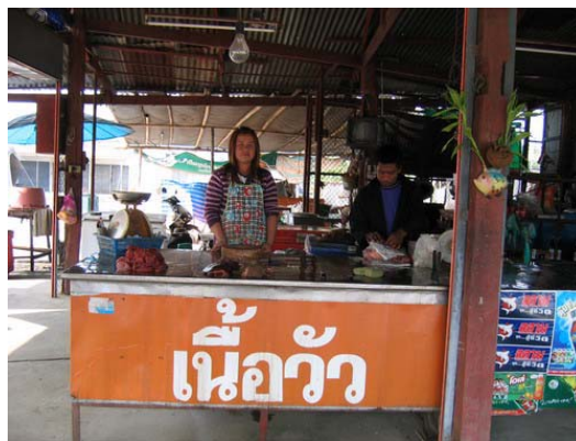
ภาพที่ 19 สภาพการจำหน่ายเนื้อในตลาดสดเทศบาลวังเจ้า

(2.1.3) ตลาดสดในอำเภอบ้านตาก และสามเงา ตลาดจำหน่ายเนื้อกระจายอยู่ในตลาดของเทศบาล ตลาดละ 1-2 ราย ดังตัวอย่างกรณีร้านจำหน่ายเนื้อที่ตลาดร้อยโทล้วน อำเภอบ้านตาก ผู้จำหน่ายเนื้อรับเนื้อแช่เย็นมาจำหน่าย วันละ 5-20 กิโลกรัม โดยรับมาจากผู้แปรรูปสภาพที่เป็นมุสลิม ทำให้มั่นใจว่าเนื้อที่ได้มาสะอาด ไม่ได้นำโคที่ตายด้วยอุบัติเหตุเข้ามาจำหน่าย ทำการจำหน่ายทั้งวัน ในรูปของเนื้อสดและเนื้อเค็ม โดยราคาเนื้อสดกิโลกรัมละ 110 บาท เนื้อเค็มกิโลกรัมละ 160 บาท เสียค่าการตลาดกิโลกรัมละ 2.77 บาท และมีการสุ่มตรวจเนื้อจากกระทรวงสาธารณสุขประจำ 2-3 เดือนต่อครั้ง