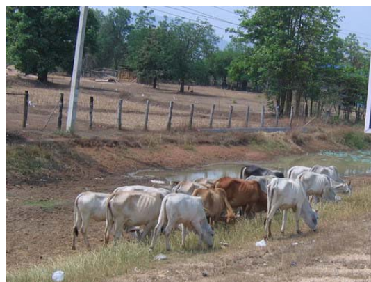
(ข) การปล่อยเลี้ยงในพื้นที่สาธารณะ