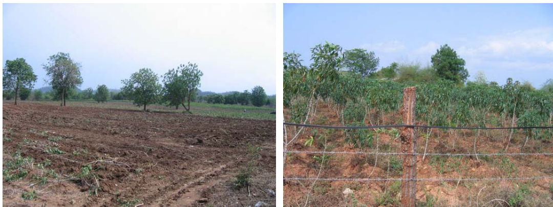
ภาพที่ 13 พื้นที่ปลูกมันสำปะหลังที่ขยายเข้าไปในพื้นที่เลี้ยงโคต้นน้ำเดิม

อย่างไรก็ตาม สภาพทุ่งหญ้าธรรมชาติและพื้นที่สาธารณะสำหรับการเลี้ยงโคต้นน้ำได้ลดลง เพราะฟาร์มเลี้ยงโคเกือบทุกฟาร์มได้ทำการล้อมรั้วเพื่อทำการเลี้ยงโคกันอย่างเป็นสัดส่วน นอกจากนี้ พื้นที่ได้ถูกนำไปใช้ปลูกพืชเศรษฐกิจเพิ่มมากขึ้น โดยเฉพาะมันสำปะหลัง