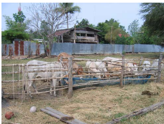
(ก) การเลี้ยงในคอก

(2) การเลี้ยงแม่โคเพื่อผลิตลูกโคแล้วนำไปเลี้ยงต่อหรือเพื่อนำไปขุน แม่โคเหล่านี้ประกอบด้วยโคพื้นเมืองและลูกผสมบราห์มัน จะถูกนำไปเลี้ยงบริเวณพื้นที่สาธารณะ บริเวณอุทยานแห่งชาติ รวมถึงการเลี้ยงในคอกที่ล้อมรั้ว โดยผสมพันธุ์ตามธรรมชาติ รวมถึงการผสมเทียมโดยเจ้าหน้าที่ของกรมปศุสัตว์ และหรือปศุสัตว์อาสา เริ่มมีทั้งการผสมข้ามด้วยน้ำเชื้อพันธุ์ยุโรป (โคพันธุ์ชาโรเลส์) ซึ่งจะได้ลูกโคที่สามารถนำไปเลี้ยงขุนได้ เนื่องจากได้ลูกผสมที่มีโครงร่างดี ประสิทธิภาพการใช้อาหารสูง และเนื้อคุณภาพดี ฟาร์มที่เลี้ยงแม่โคผลิตลูกโค จะเริ่มจำหน่ายลูกโคเพศผู้เมื่ออายุได้ประมาณ 8 เดือน จนถึงอายุ 1 ปีครึ่ง