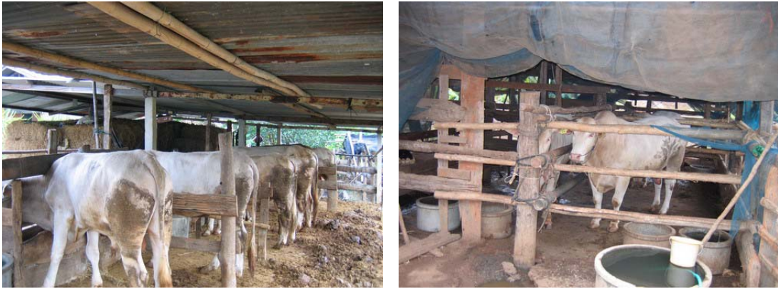
ภาพที่ 5 การขุนโคลูกผสมชาโรเลส์