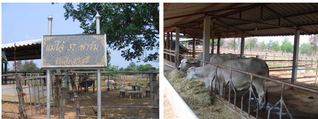
ภาพที่ 1 ฟาร์มที่ทำการผลิตพ่อ-แม่พันธุ์

พันธุ์โคพันธุ์ตากขึ้น จำหน่ายให้ผู้เลี้ยงที่สนใจ รวมถึงการผลิตน้ำเชื้อจากพ่อพันธุ์ดี ส่วนน้ำเชื้อโคพันธุ์ดี กรมปศุสัตว์ให้การสนับสนุนฟรี พร้อมเจ้าหน้าที่ผสมเทียมประจำอำเภอทุกอำเภอ