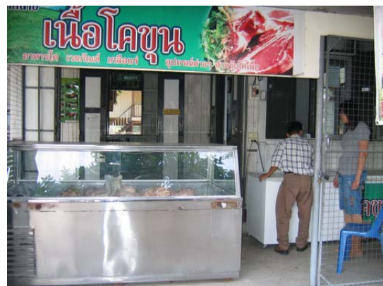
ภาพที่ 25 ป้ายแสดงกิจกรรมและร้านจำหน่ายเนื้อโคขุน