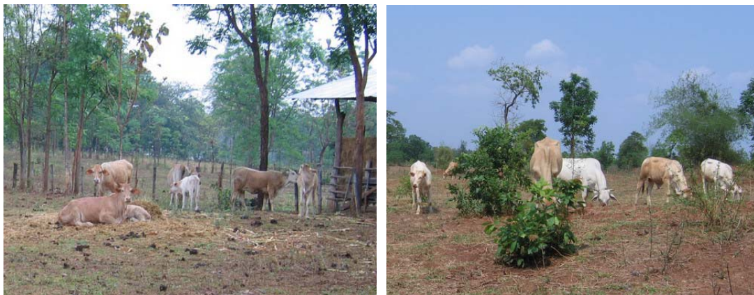
ภาพที่ 9 การเลี้ยงแม่พันธุ์ชาโรเลส์ในฟาร์มเลี้ยงของเกษตรกร

นับตั้งแต่ปี พ.ศ. 2549 เป็นต้นมา ความต้องการโคต้นน้ำลูกผสมชาโรเลส์มีมากขึ้น สำนักงานปศุสัตว์จังหวัดตาก จึงดำเนินการเพิ่มปริมาณโคลูกผสมโดยจัดหาน้ำเชื้อเพื่อนำไปผสมเทียมให้กับแม่โคลูกผสมบรรพบุรุษของเกษตรกร และจัดฝึกปศุสัตว์อาสาเพื่อเป็นผู้ปฏิบัติงานในพื้นที่ให้แก่เกษตรกรที่ต้องการผสมเทียมโดยตรง ผลการดำเนินงานประสบความสำเร็จ โดยสามารถจำนวนโคลูกผสมชาโรเลส์เพิ่มขึ้นในประมาณปีละ 100 ตัว อย่างไรก็ตาม ยังพบว่าโคลูกผสมที่ได้ยังไม่เป็นที่พอใจของเกษตรกร โดยเฉพาะที่ใช้แม่พันธุ์ที่มีเลือดโคพื้นเมืองสูง