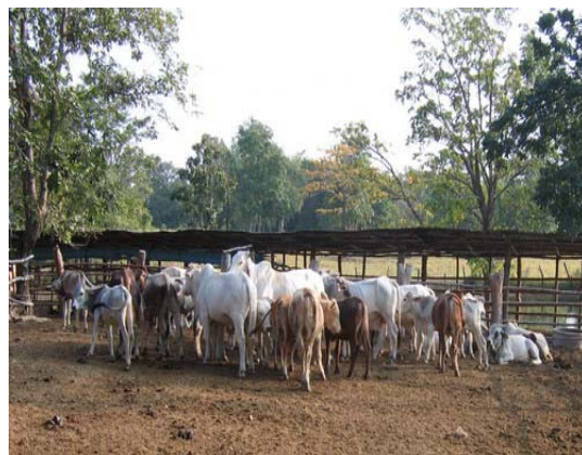
ภาพที่ 3 การเลี้ยงโคฝูงในแปลงปลูกหญ้า