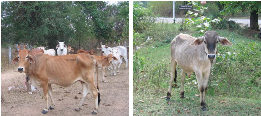
ภาพที่ 6 แม่พันธุ์โคพื้นเมืองที่เลี้ยงอยู่ทั่วไป (ซ้าย) และโคพื้นเมืองอายุ 12 เดือน คัดออกจากฝูง (ขวา) ซึ่งมีราคาตัวละ 3,500 บาท

(1) โคพื้นเมือง เป็นพันธุ์ที่แข็งแรง อดทน เลี้ยงง่าย ทนทานต่อสภาพอากาศร้อน ทนโรคและแมลงต่าง ๆ โดยเฉพาะเห็บ ปรับตัวเข้ากับสภาพแวดล้อมได้ดี หากินเก่ง มีความสมบูรณ์พันธุ์สูง เพศเมียเป็นสัตว์อย่างสม่ำเสมอ ผสมติดง่าย คลอดลูกง่าย เลี้ยงลูกเก่ง ให้ลูกดก และอายุยืน แต่มีขนาดเล็ก อย่างไรก็ตาม ปัจจุบันโคพื้นเมืองแท้ ๆ ในจังหวัดตากเริ่มมีจำนวนลดลง ส่วนใหญ่จะเป็นลูกผสมบราห์มันเลือดต่ำ และโคไทยใหญ่