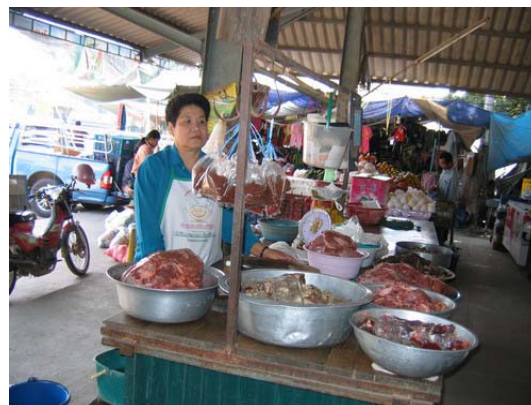
ภาพที่ 20 สภาพตลาดและการจำหน่ายเนื้อในตลาดสดอำเภอบ้านตาก

(2.1.4) ร้านจำหน่ายเนื้อโคขุนของสหกรณ์โคเนื้อ จังหวัดตาก สหกรณ์โคเนื้อ จังหวัดตาก ได้ส่งเสริมให้สมาชิกดำเนินการขุนโคลูกผสมชาโรเลส์ เมื่อได้ขนาดที่เหมาะสมแล้ว จะทำการรับซื้อโคมีชีวิต แล้วนำเข้าแปรรูปและตัดแต่งเพื่อจำหน่ายอยู่ในรูปของเนื้อในบรรจุภัณฑ์แช่แข็ง ณ ที่ทำการของสหกรณ์ฯ โดยเสียค่าใช้จ่ายในการฆ่าและบรรจุภัณฑ์ตัวละ 1,500 บาท ตั้งราคาจำหน่ายเนื้อตามคุณภาพซากและชิ้นส่วนเนื้อ ราคาจำหน่ายเนื้อเฉลี่ยกิโลกรัมละ 160 บาท