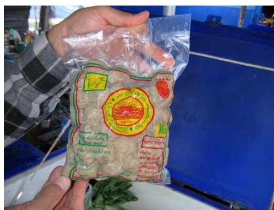
ภาพที่ 17 สภาพการจำหน่ายลูกชิ้นในตลาดสดเทศบาลเมืองตาก (ซ้าย) และวังประจวบ (ขวา)