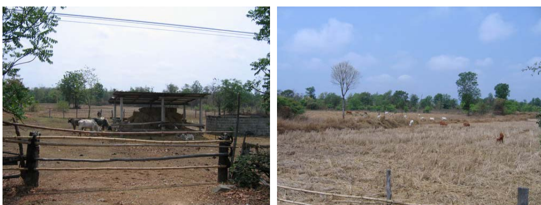
ภาพที่ 12 ฟางข้าว และตอซังข้าว อาหารเสริมที่สำคัญในช่วงฤดูแล้ง