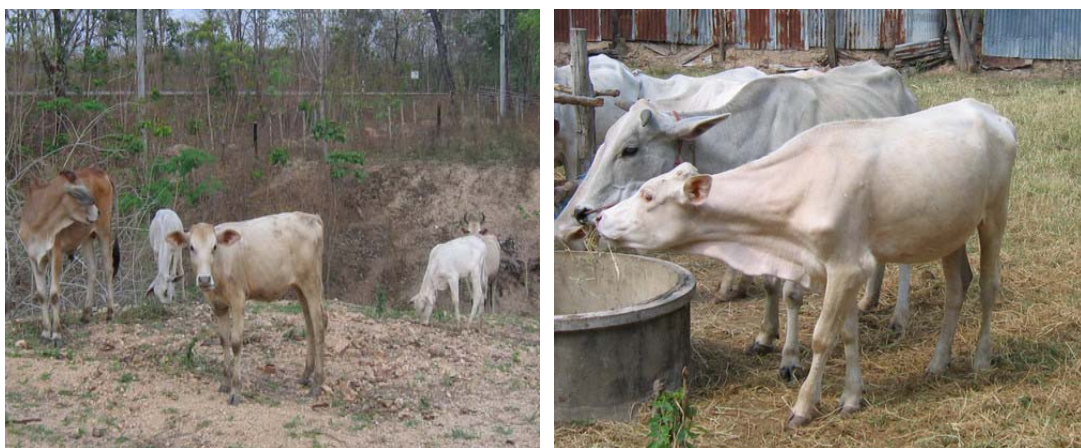
ภาพที่ 10 โคลูกผสมชาโรเลส์ที่ได้จากแม่โคลูกผสมเลือดพื้นเมืองสูง

นับตั้งแต่ปี พ.ศ. 2549 เป็นต้นมา ความต้องการโคต้นน้ำลูกผสมชาโรเลส์มีมากขึ้น สำนักงานปศุสัตว์จังหวัดตาก จึงดำเนินการเพิ่มปริมาณโคลูกผสมโดยจัดหาน้ำเชื้อเพื่อนำไปผสมเทียมให้กับแม่โคลูกผสมบรรพบุรุษของเกษตรกร และจัดฝึกปศุสัตว์อาสาเพื่อเป็นผู้ปฏิบัติงานในพื้นที่ให้แก่เกษตรกรที่ต้องการผสมเทียมโดยตรง ผลการดำเนินงานประสบความสำเร็จ โดยสามารถจำนวนโคลูกผสมชาโรเลส์เพิ่มขึ้นในประมาณปีละ 100 ตัว อย่างไรก็ตาม ยังพบว่าโคลูกผสมที่ได้ยังไม่เป็นที่พอใจของเกษตรกร โดยเฉพาะที่ใช้แม่พันธุ์ที่มีเลือดโคพื้นเมืองสูง