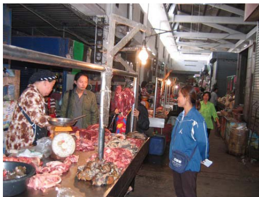
ภาพที่ 16 สภาพการจำหน่ายเนื้อในตลาดสดเทศบาลเมืองตาก