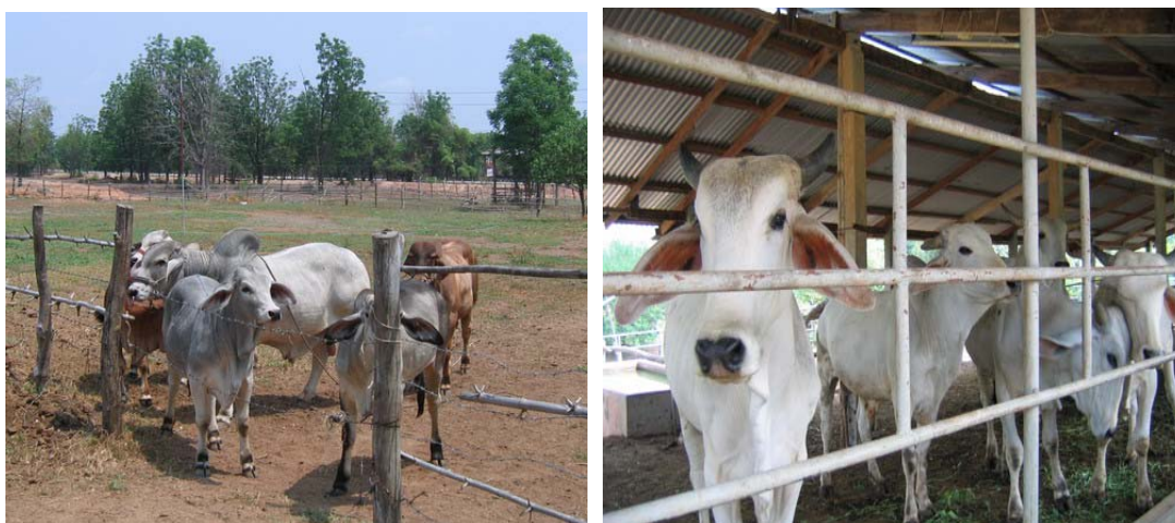
ภาพที่ 8 โคลูกผสมบราห์มันในฟาร์มเลี้ยง (ซ้าย) และในคอกเลี้ยง (ขวา)

(2) โคลูกผสมบราห์มัน เป็นโคที่มีการเลี้ยงอยู่ทั่วไปในจังหวัดตาก มีลักษณะประจำพันธุ์ที่ชัดเจนโดยทั่วไปคือ สีขาว หนอกใหญ่ ทรนโรคและแมลง