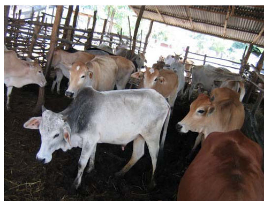
ภาพที่ 14 กิจกรรมต่าง ๆ ในตลาดนัดมารวย