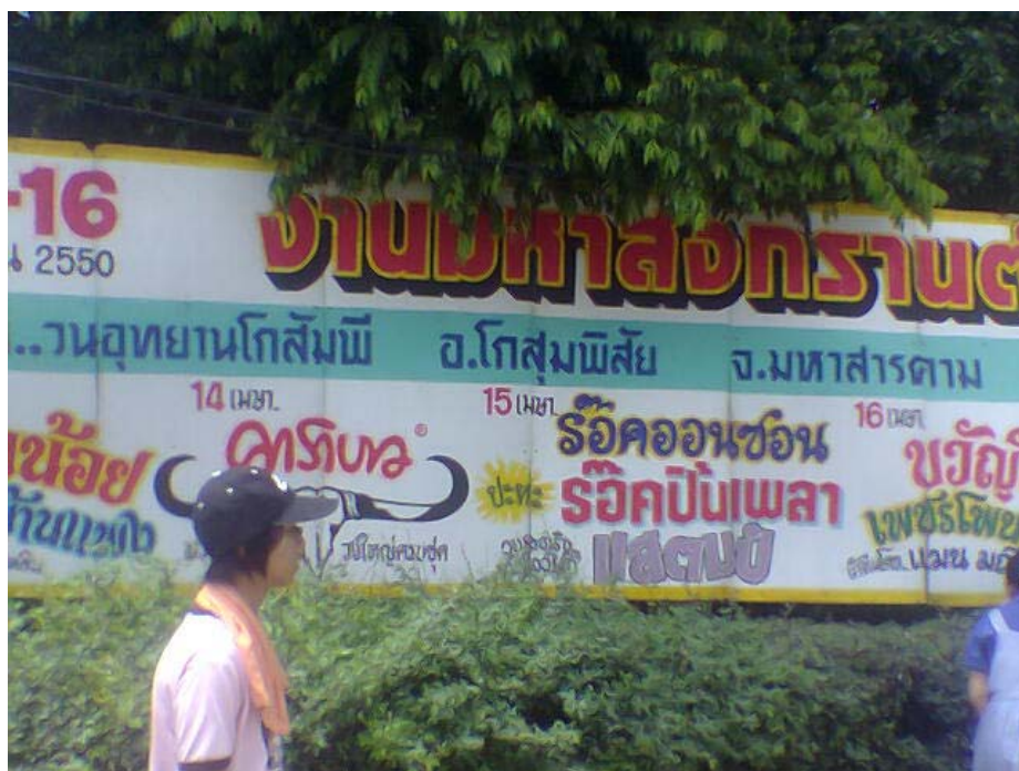
ภาพที่ 20 งานสงกรานต์ใน โกสุมพิสัย