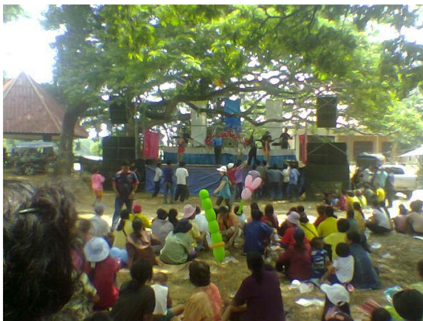
ภาพที่ 21 การแสดงในเทศกาลสงกรานต์ในบุงลิ่ง

ผู้คนหันมาเที่ยวงานสงกรานต์ในวนอุทยานโกสัมพี ที่ชาวบ้านคุ้มกลาง คุ้มใต้ คุ้ม สังข์ ผลัดเปลี่ยนกันจัด เป็นเวลา 5-7 วัน มีนักท่องเที่ยวจากทั่วทุกจังหวัดและชาวต่างชาติให้ความสนใจเป็นจำนวนมากทุกปี