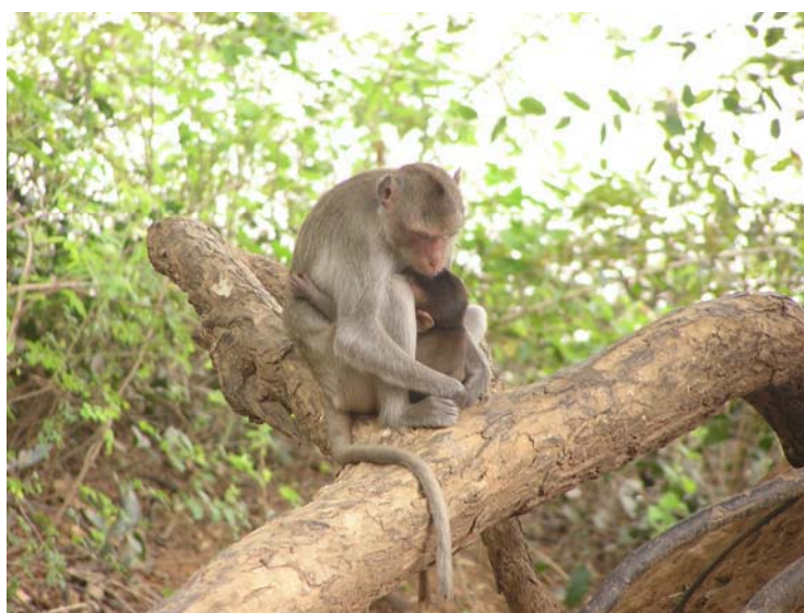
ภาพที่ 18 ลิงแสมในวนอุทยาน โกสัมพี

ลิงที่อาศัยอยู่ในวนอุทยานโกสัมพีมีลิงที่อาศัยอยู่ในวนอุทยานโกสัมพีประมาณ 800 ตัว แต่ในช่วงปี พ.ศ.2535 มีลิงประมาณ 50 ตัวได้อพยพย้ายถิ่นเนื่องจากพื้นที่เล็กโดย้วยทวนน้ำขึ้น ไปอาศัยอยู่ที่ดอนปู่ตา บ้านโพนงาม ตำบลโพนงาม อำเภอโกสุมพิสัย จังหวัดมหาสารคาม แต่เนื่องจากป่าแห่งนี้อยู่ไกลหมู่บ้านมากประกอบกับลิงแสมกลุ่มนี้เคยมีผู้เคยเอาอาหารมาให้และเข้าไปกินอาหารตามบ้านคน จึงทำให้ลิงมีการอพยพอีกครั้งหนึ่งไปอยู่ที่ฝ่ายเขื่อนยางห่างจากที่เดิมไปอีกประมาณ 1 กิโลเมตร บริเวณนี้มีอาหารอุดมสมบูรณ์ และอยู่ใกล้ชุมชนทำให้ทราบว่าพื้นที่ในป่าวนอุทยานโกสัมพีไม่สอดคล้องกับจำนวนประชากรของลิงและอีกนัยหนึ่งแสดงให้เห็นว่าลิงแสมกลุ่มนี้มีพฤติกรรมที่เปลี่ยนไปจากธรรมชาติ มีความคุ้นเคยกับคนมากขึ้น เนื่องจากมีคนให้อาหาร การหยอกล้อ และการเข้าไปเยี่ยมชมของนักท่องเที่ยว ดังนั้นถึงแม้ว่าจะมีการอพยพแต่ก็จะหาที่ที่มีลักษณะสิ่งแวดล้อมที่มีลักษณะใกล้เคียงกับสิ่งแวดล้อมเดิม