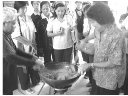
ภาพที่ 5 และ ภาพที่ 6 บรรยากาศการศึกษาดูงานบ้านป่าไผ่ ต.แม่โป่ง อ.ดอยสะเก็ด จ.เชียงใหม่