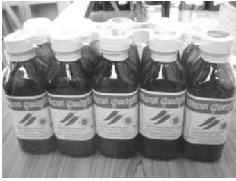
ภาพที่ 16 บรรจุกัญท์กลุ่ม พริกلاب้านสันคะยอม