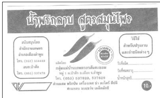
ภาพที่ 11 รูปแบบ โลโก้แบบเดิมของกลุ่มพริกฉาบบ้านสันคະຍອມ