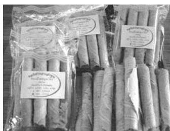
ภาพที่ 14 บรรจุภัณฑ์กลุ่ม ขนมทองม้วนบ้านใหม่ฯ