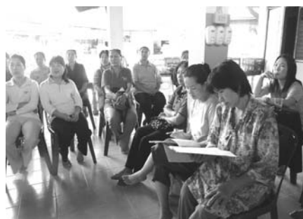
ภาพที่ 9 และ ภาพที่ 10 การหนุนเสริมเรื่องระบบบัญชี