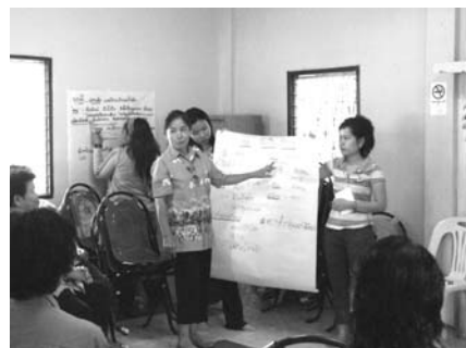
ภาพที่ 1 – 4 การสะท้อนข้อมูลเกี่ยวกับกลุ่มซึ่งเป็นผลจากการวิเคราะห์ SWOT ของทีมวิจัย