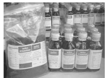
ภาพที่ 15 บรรจุภัณฑ์กลุ่ม พริกฉาบบ้านสันป่าสัก