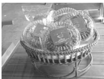
ภาพที่ 13 บรรจุภัณฑ์กลุ่ม หมูหวานบ้านสันคະຍອມ