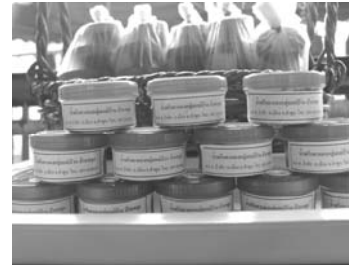
ภาพที่ 18 บรรจุกัญท์กลุ่ม น้ำพริกตาแดงบ้านหลุก