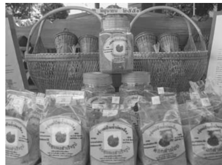
ภาพที่ 7 และ ภาพที่ 8 กลุ่มผลิตภัณฑ์ใหม่ที่เกิดจากการศึกษาดูงาน

นอกจากนั้นทีมวิจัยยังได้มีโอกาสชมการสาธิตทำสมุนไพรผง จากกลุ่มแม่บ้านเกษตรกร บ้าน ป่าไผ่ ซึ่งหลังจากการศึกษาดูงานครั้งนี้ ทำให้เกิดกลุ่มผลิตภัณฑ์ใหม่จากแม่บ้านเกษตรกร บ้านน้ำบ่อเหลืองคือกลุ่มสมุนไพรผง ซึ่งถือเป็นสิ่งที่น่าสนใจที่การดูงานครั้งนี้เป็นแรงกระตุ้นให้กับ