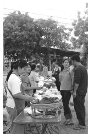
ภาพที่ 24 –27 บรรยากาศในการงานตลาดนัดแม่บ้านเกษตรกร

นอกจากการร่วมเรียนรู้ระหว่างกลุ่มที่วิจัยร่วมแล้ว ในช่วงการดำเนินการ กลุ่มแม่บ้านเกษตรกรมีการเชื่อมเครือข่ายระหว่างกลุ่มแม่บ้านเกษตรกรกลุ่มอื่นๆ ได้มีโอกาสเข้าร่วมเรียนรู้ด้วยกันและมีการหารือรวมกลุ่มกันเข้าร่วมการฝึกอบรมต่างๆ โดยมีการวางแผนงานเอง และการดึงเข้ากลุ่มที่วิจัย เช่นกลุ่มแม่บ้านเกษตรกรบ้านน้ำบ่อเหลือง กลุ่มแม่บ้านเกษตรกรบ้านทรายทอง