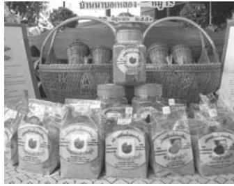
ภาพที่ 17 บรรจุกัญท์กลุ่ม สมุนไพรวบ้านน้ำบ่อเหลือง