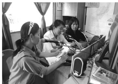
ภาพที่ 19 และ ภาพที่ 20 การใช้สื่อบอร์ดนิทรรศการและการประชาสัมพันธ์ผ่านวิทยุชุมชนในการประชาสัมพันธ์ผลิตภัณฑ์

1.7) การจัดทำแผนที่ 1 ตำบลหลายผลิตภัณฑ์ เริ่มต้นด้วยการนำแผนที่ตำบลป่าสัก มาร่วมกันกำหนดจุดและลงข้อมูลกลุ่มผลิตภัณฑ์ภายในตำบล ซึ่งแม่บ้านเกษตรกรก็ช่วยกันอย่างเต็มที่ ทำให้ได้มาซึ่งแผนที่ 1 ตำบลหลายผลิตภัณฑ์ ของตำบลป่าสัก ซึ่งเป็นแผนที่ที่หน่วยงานในพื้นที่ยังไม่ได้จัดทำ โดยประโยชน์ของแผนที่กลุ่มผลิตภัณฑ์นี้จะทำให้รู้จำนวนกลุ่มผลิตภัณฑ์ภายในตำบล และทราบว่าหมู่บ้านไหนมีผลิตภัณฑ์ชนิดใดซึ่งง่ายต่อการติดต่อและประชาสัมพันธ์