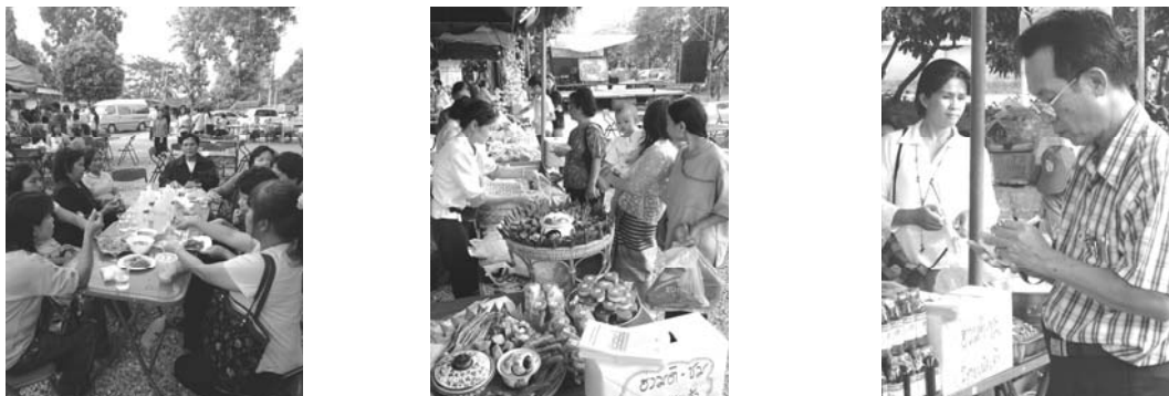
ภาพที่ 21-23 บรรยากาศภายในงานตลาดนัดแม่บ้านเกษตรกร

จากผลจากกิจกรรมทั้งหมดล้วนแต่เป็นแนวทางที่สามารถช่วยให้กลุ่มแม่บ้านเกษตรกรมีการบริหารจัดการกลุ่มที่ดีขึ้น ไม่ว่าจะเป็นการรู้จักการวางแผนงาน การผลิตผลิตภัณฑ์ที่มีคุณภาพ มีบรรจุภัณฑ์ที่เหมาะสม และการมีตลาดที่เพิ่มขึ้น