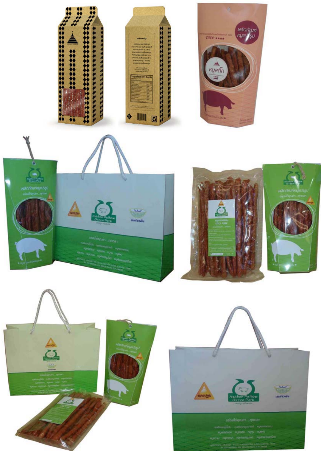
ภาพที่ 7 แสดงลักษณะบรรจุภัณฑ์ต้นแบบหมูแพ่งกรอบที่พัฒนาออกแบบใหม่