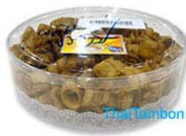
ภาพที่ 24 แสดงลักษณะบรรจุภัณฑ์เดิมกล้วยกรอบ กล้วยม้วน