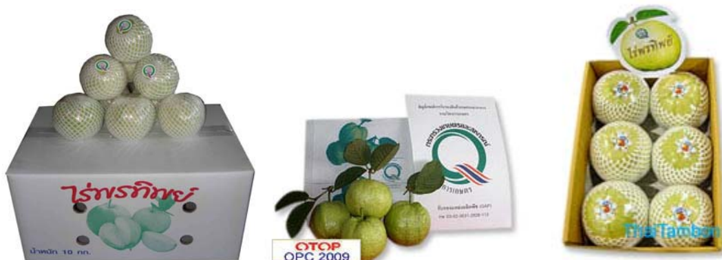
ภาพที่ 20 แสดงลักษณะบรรจุภัณฑ์เดิมฝรั่งสด