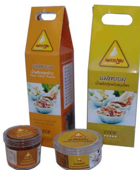
ภาพที่ 23 แสดงบรรจุภัณฑ์ต้นแบบน้ำพริกคูลูกข้าวที่พัฒนาออกแบบใหม่