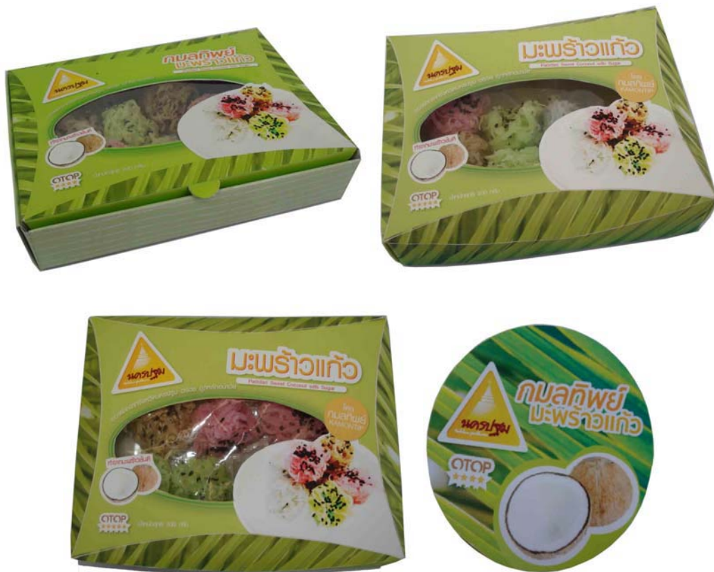
ภาพที่ 31 แสดงลักษณะบรรจุภัณฑ์ต้นแบบมะพร้าวแก้วที่พัฒนาใหม่

บรรจุภัณฑ์เบื้องต้นที่พัฒนาออกแบบสำหรับมะพร้าวแก้ว บรรจุภัณฑ์ชั้นในบรรจุถุงพลาสติกใสซีลปิดผนึกป้องกันอากาศและความชื้น