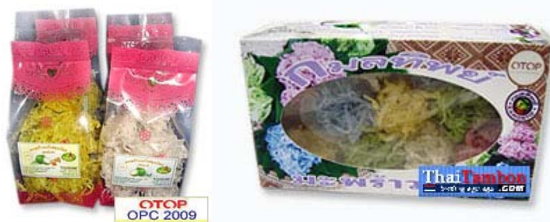
ภาพที่ 30 แสดงลักษณะบรรจุภัณฑ์เดิมมะพร้าวแก้ว