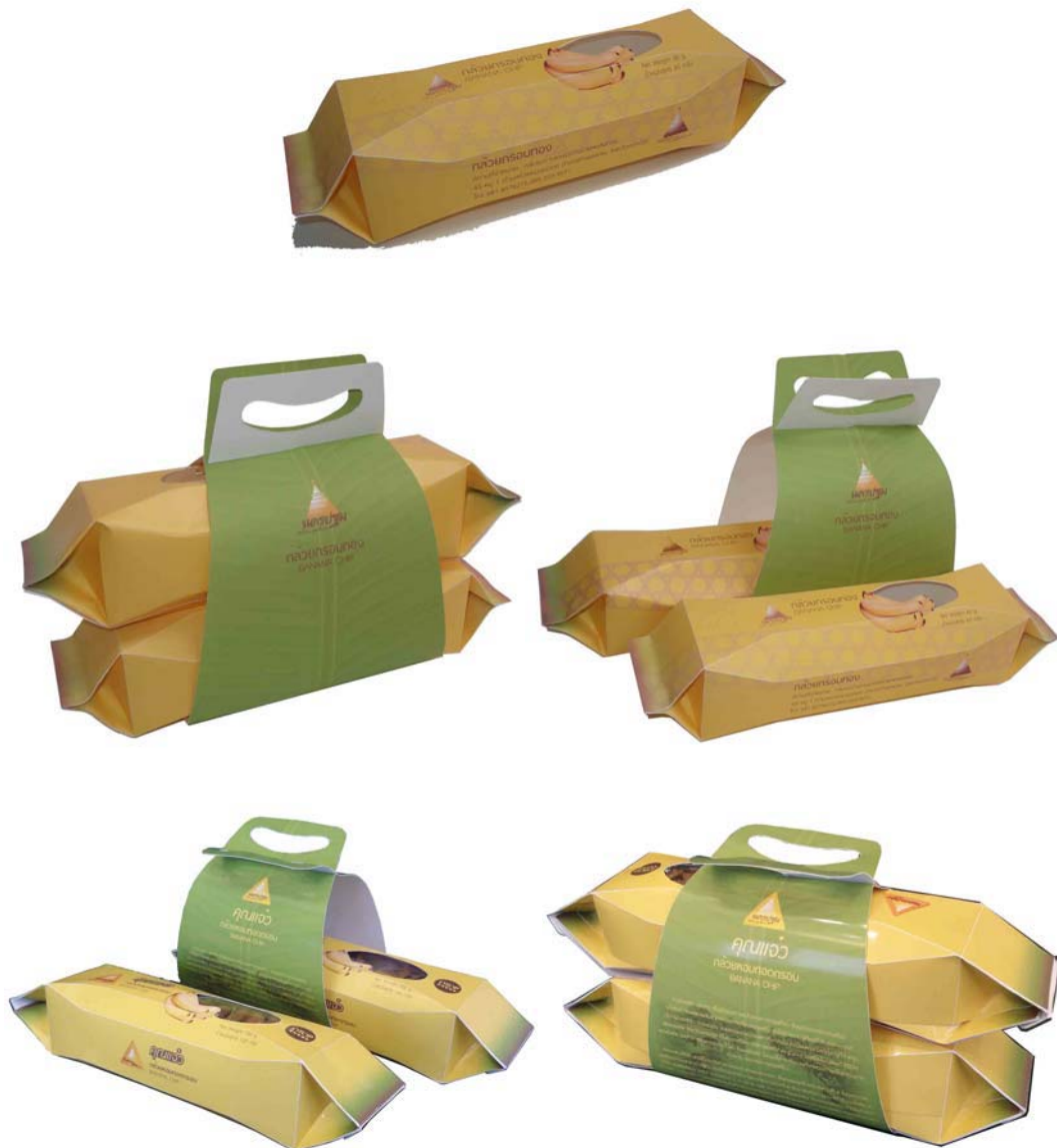
ภาพที่ 25 แสดงลักษณะบรรจุภัณฑ์ต้นแบบกล้วยหอมที่พัฒนาออกแบบใหม่

บรรจุภัณฑ์กล้วยกรอบเพื่อสร้างรูปทรงที่เป็นเอกลักษณ์จากวัตถุดิบกล้วยหอมทองของกลุ่มแม่บ้านชุมชนวัดสุวรรณ ตั้งอยู่ริมคลองมหาสวัสดิ์ ซึ่งเป็นแหล่งท่องเที่ยวทางการเกษตรที่ได้รับความนิยมและมีชื่อเสียง อีกทั้งมีประวัติเรื่องราวของคลองมหาสวัสดิ์และวิถีชุมชนที่น่าสนใจที่ได้ถ่ายทอดลงบนบรรจุภัณฑ์ เพื่อสื่อถึงเอกลักษณ์ของชุมชนและเผยแพร่ข้อมูลให้กับนักท่องเที่ยวได้เป็นอย่างดี