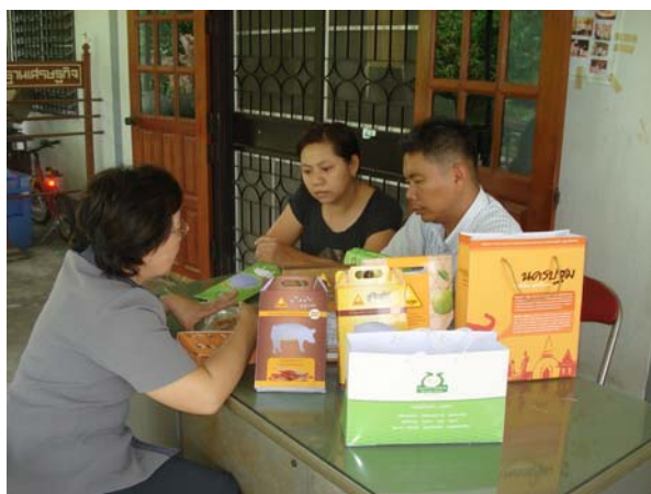
สัมภาษณ์ประเมินผลความพึงพอใจบรรจุภัณฑ์ก๊อีนพอร์ค