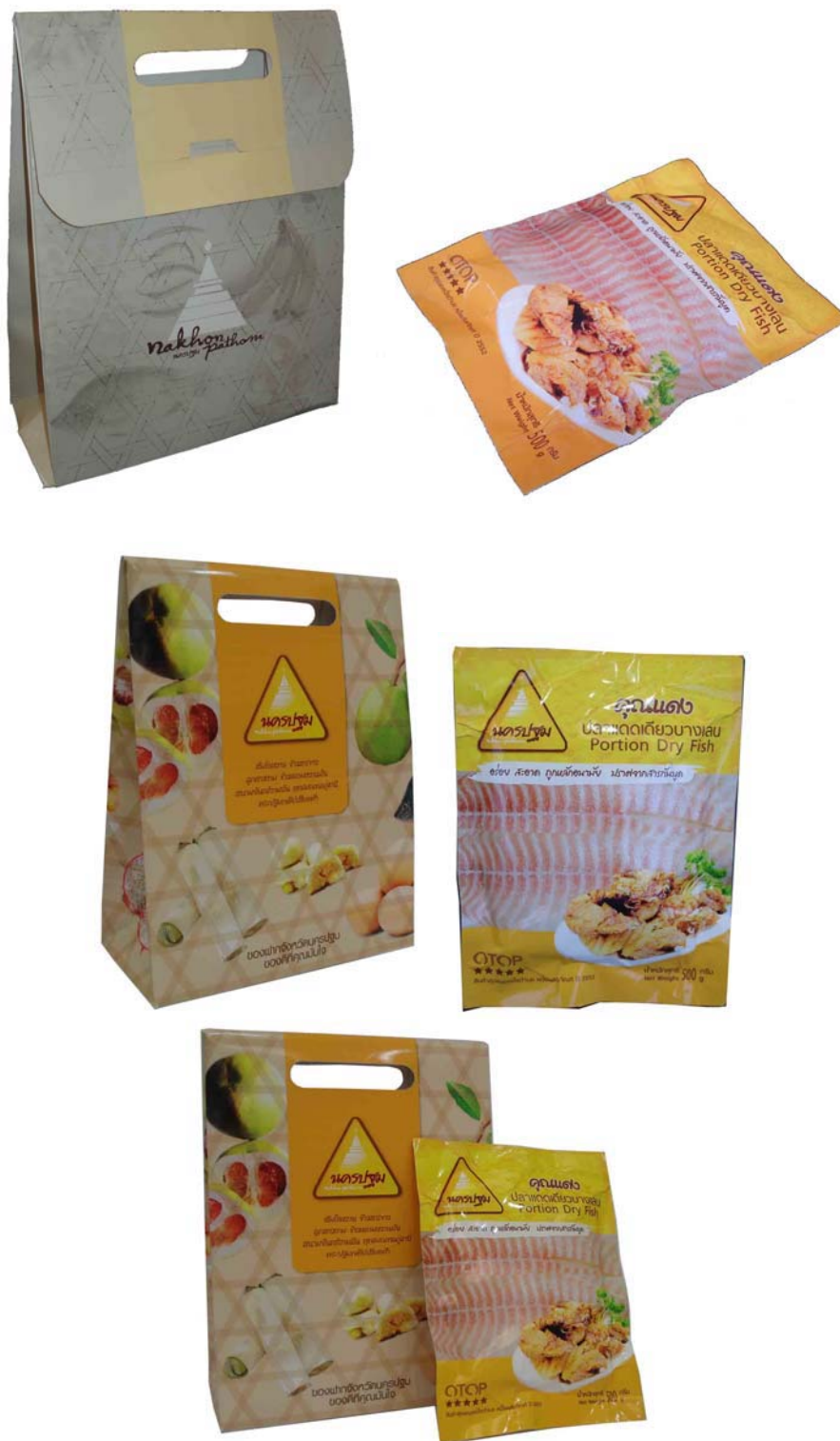
ภาพที่ 13 แสดงลักษณะบรรจุภัณฑ์ต้นแบบปลาแดดเดียวที่พัฒนาออกแบบใหม่