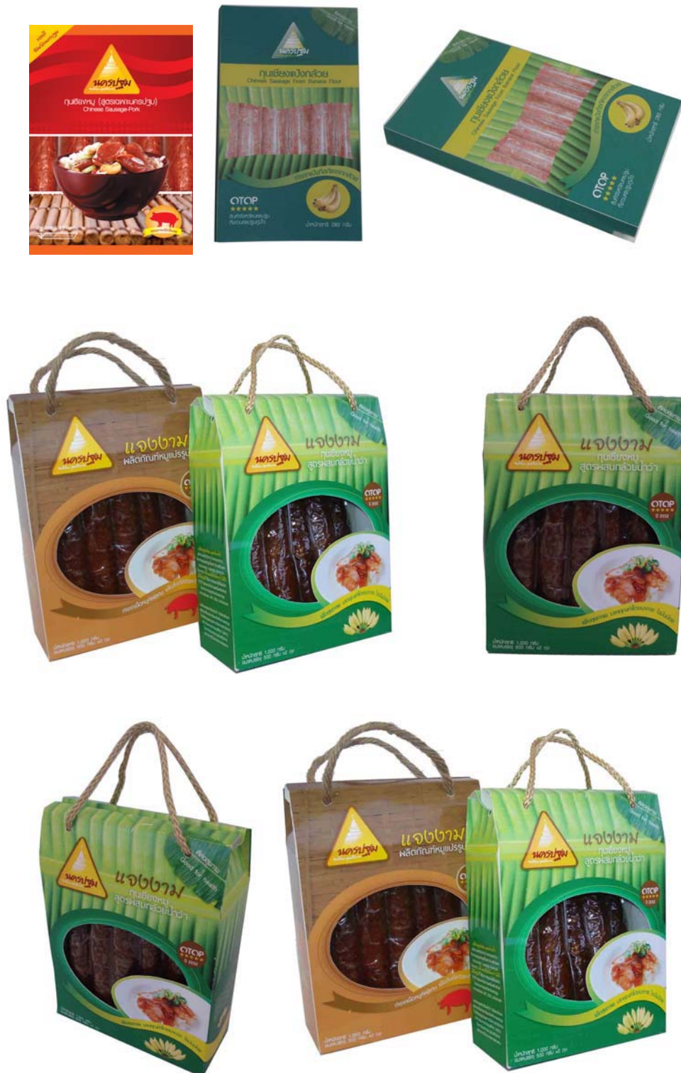
ภาพที่ 9 แสดงลักษณะบรรจุภัณฑ์ต้นแบบกุนเชียงที่พัฒนาออกแบบใหม่