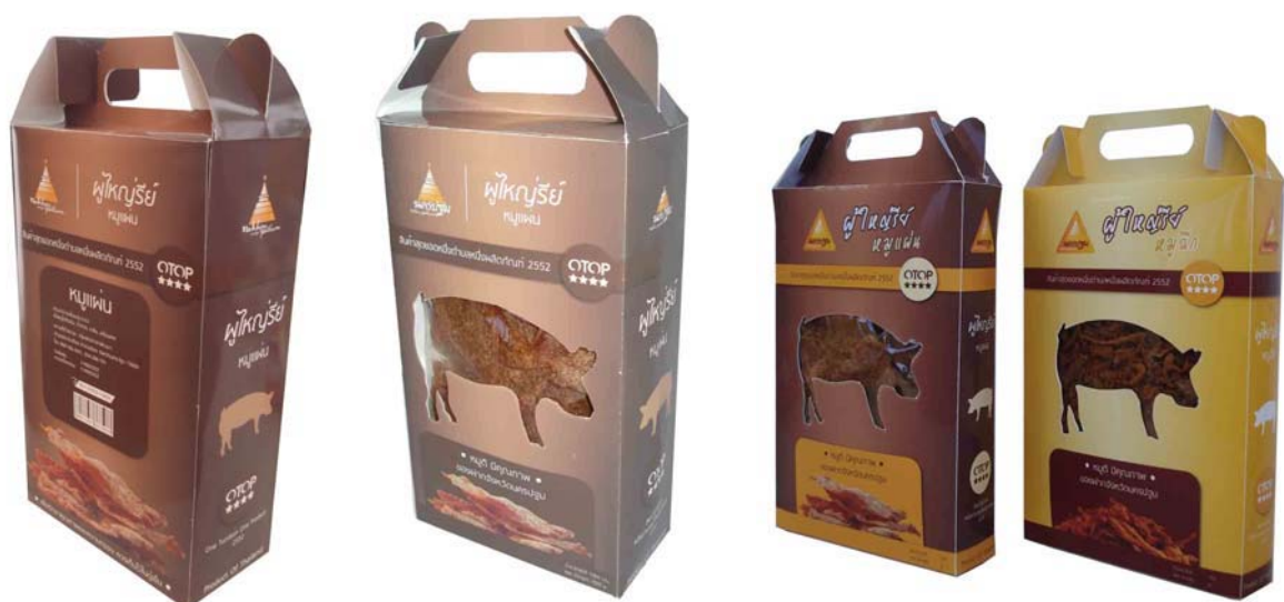
ภาพที่ 3 แสดงลักษณะบรรจุภัณฑ์ต้นแบบหมูแผ่นที่พัฒนาออกแบบใหม่

ลักษณะของบรรจุภัณฑ์ที่ออกแบบจะใช้สำหรับบรรจุขนาด 500 กรัมและ 1,000 กรัม โดยสีน้ำตาลจะเป็นบรรจุภัณฑ์สำหรับหมูแผ่น ส่วนสีเหลืองจะเป็นบรรจุภัณฑ์สำหรับหมูฉีกเส้นฝอยตราผู้ใหญ่วัย ซึ่งบรรจุภัณฑ์ที่ได้พัฒนามาจากรูปแบบและขนาดของบรรจุภัณฑ์เดิมแต่ได้มีการออกแบบกราฟฟิกเพื่อให้เหมาะสมสวยงามมากขึ้น