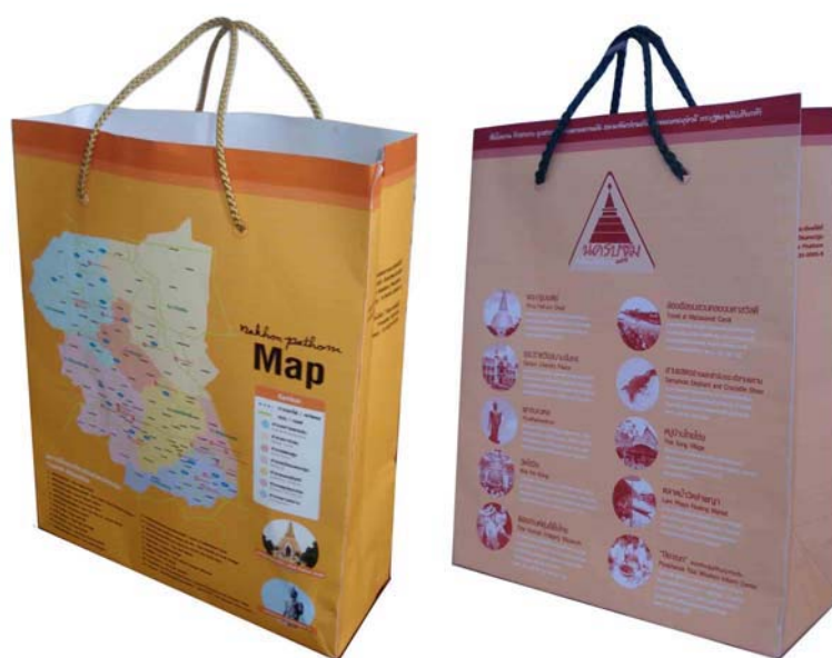
บรรจุภัณฑ์กลางทุ่งกระดาศ