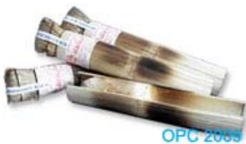
ภาพที่ 14 แสดงลักษณะบรรจุภัณฑ์เดิมข้าวหลาม