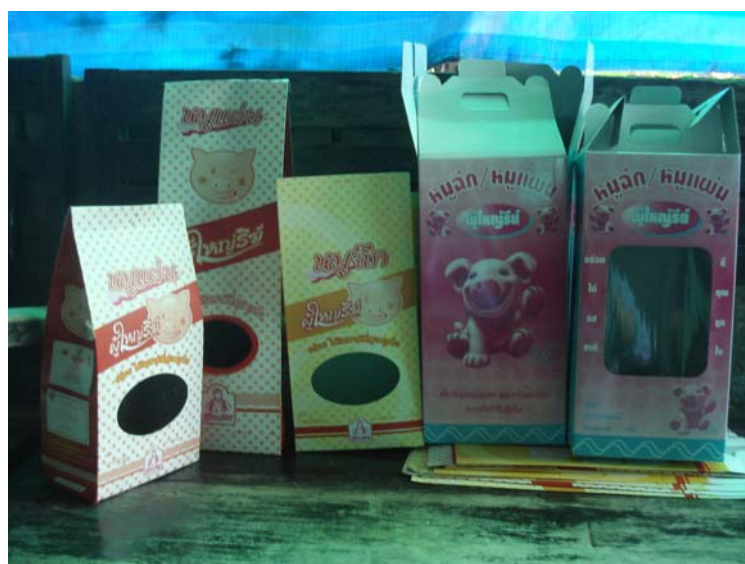
สัมภาษณ์ คุณอารีย์ วงษ์ศรี ผู้ผลิตถุงยางเพื่อสุขภาพ กลุ่มสตรีแม่บ้าน ตำบลสระกระเทียม 10 หมู่ 13 ตำบลสระกระเทียม อำเภอเมือง จังหวัดนครปฐม