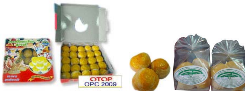
ภาพที่ 10 แสดงลักษณะบรรจุภัณฑ์เดิมขนมเปี๊ยะอบเทียน