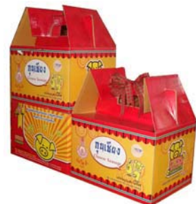
ภาพที่ 4 แสดงบรรจุภัณฑ์เดิมหมูหยอง