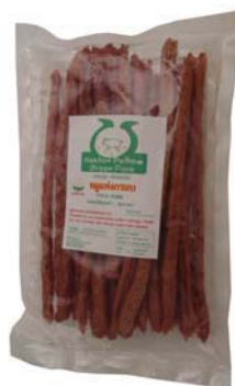
ภาพที่ 6 แสดงบรรจุภัณฑ์เดิมหมูแท่งกรอบ