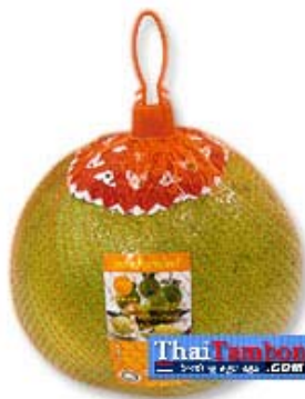
ภาพที่ 16 แสดงลักษณะบรรจุภัณฑ์เดิมของส้มโอ