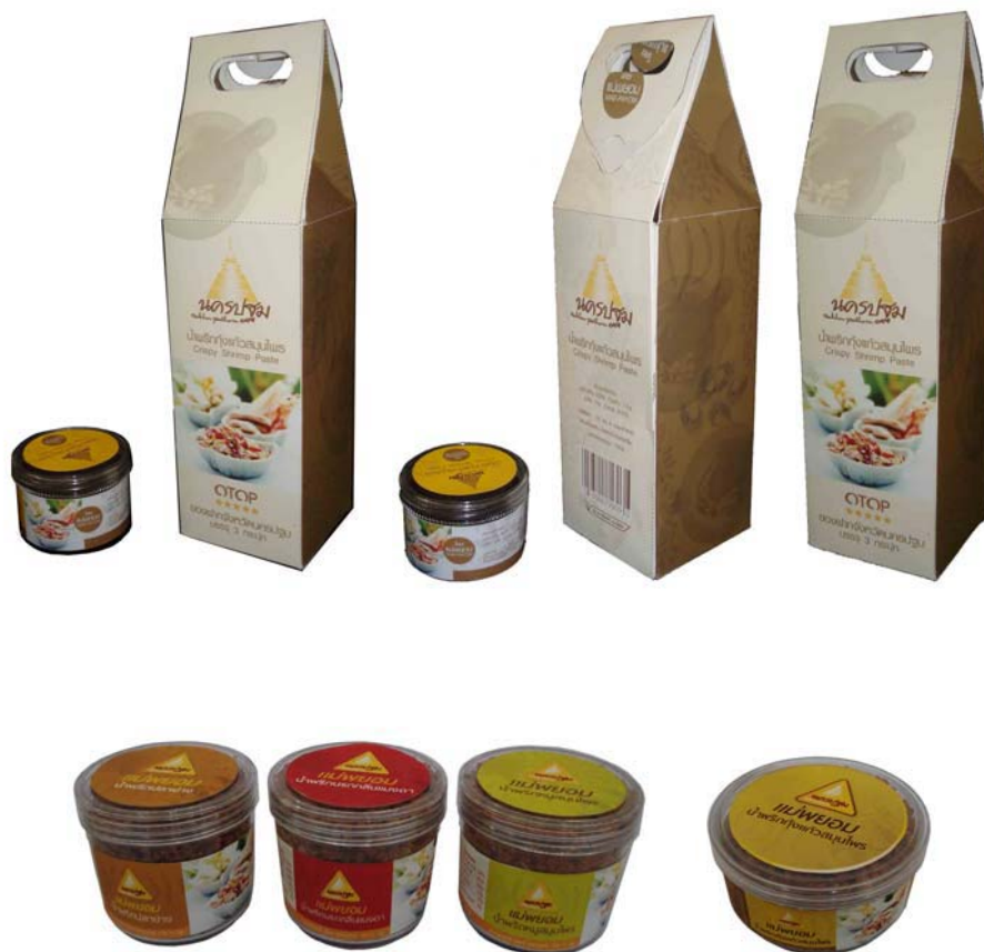
ภาพแสดงฉลากน้ำพริกประเภทต่างๆ