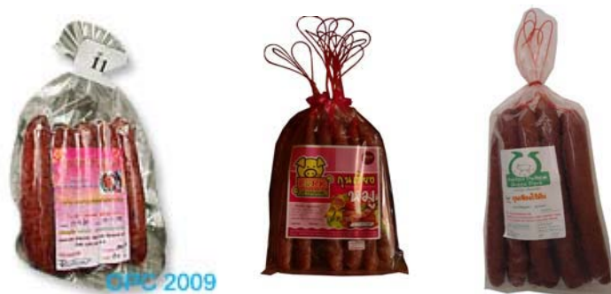
ภาพที่ 8 แสดงบรรจุภัณฑ์เดิมกุนเชียง