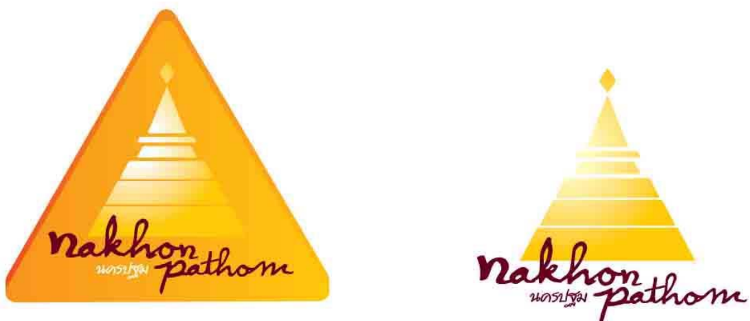
ภาพที่ 1 แสดงตราสัญลักษณ์ที่คัดเลือกเพื่อสื่อถึงจังหวัดนครปฐม

ผลการคัดเลือกสัญลักษณ์เพื่อส่งเสริมการท่องเที่ยวจังหวัดนครปฐม