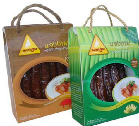
บรรจุภัณฑ์กุนเชียงหมู