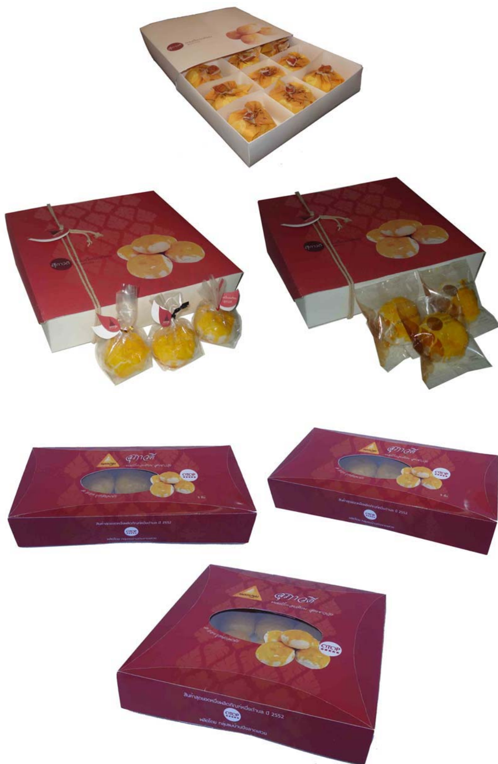
ภาพที่ 11 แสดงลักษณะบรรจุภัณฑ์ต้นแบบขนมเปี๊ยะอบเทียนที่พัฒนาออกแบบใหม่