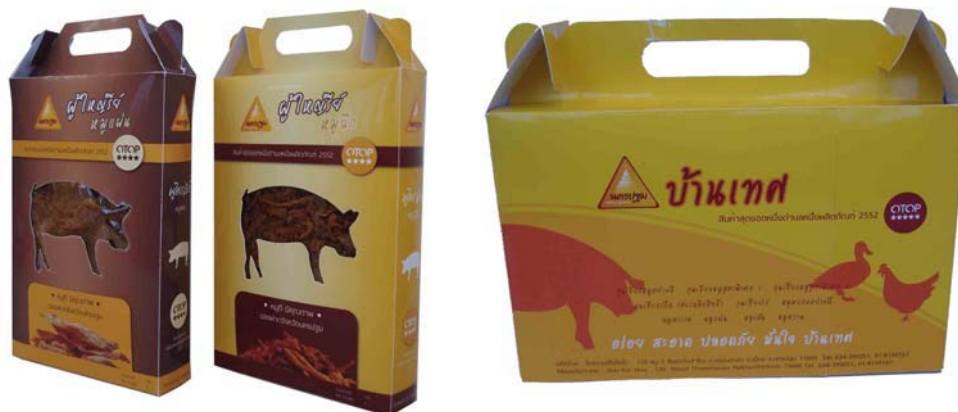
บรรจุภัณฑ์หมูแผ่น

ภาพแสดงการนำบรรจุภัณฑ์ที่ออกแบบไปทดลองใช้งานกับผลิตภัณฑ์สินค้า