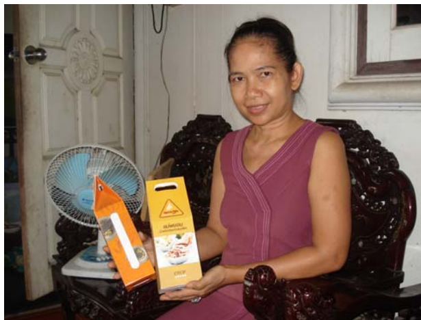
สัมภาษณ์ประเมินผลความพึงพอใจบรรจุภัณฑ์น้ำพริกแม่พยอม