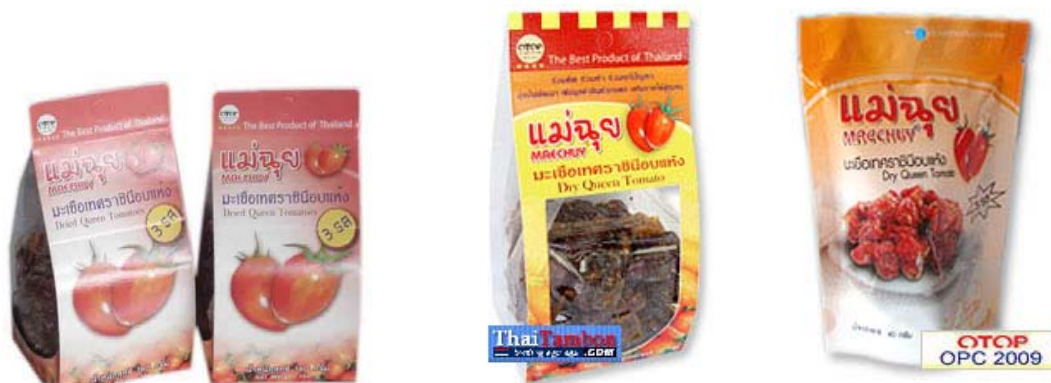
ภาพที่ 28 แสดงลักษณะบรรจุภัณฑ์เดิมมะเขือเทศอบแห้ง