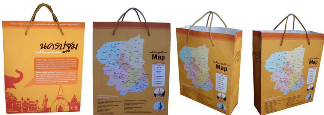
ภาพที่ 33 แสดงลักษณะบรรจุภัณฑ์กลางของจังหวัดนครปฐมแบบที่ 2

บรรจุภัณฑ์กลางนครปฐมที่ออกแบบเป็นถุงกระดาษ 2 รูปแบบที่สื่อถึงจังหวัดนครปฐมโดยใช้ภาพแหล่งท่องเที่ยวที่สำคัญมีชื่อเสียงของนครปฐมและภาพแผนที่การเดินทางของแหล่งท่องเที่ยวสำคัญที่มีชื่อเสียงและสถานที่แนะนำของจังหวัดนครปฐม