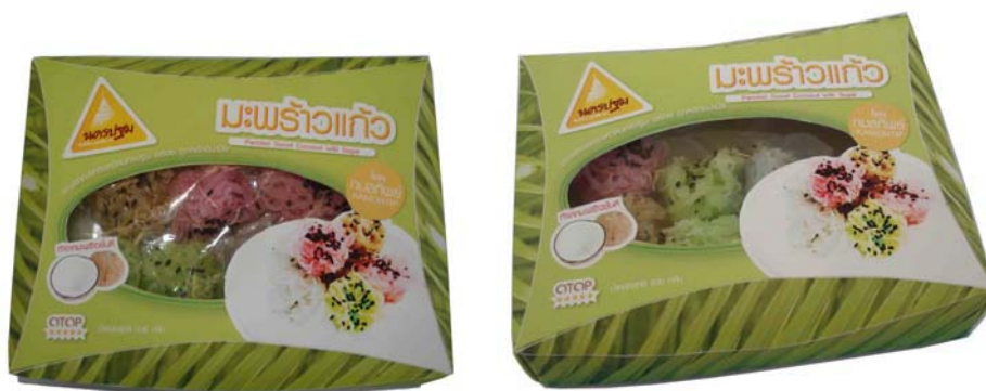
บรรจุภัณฑ์มะพร้าวแก้ว