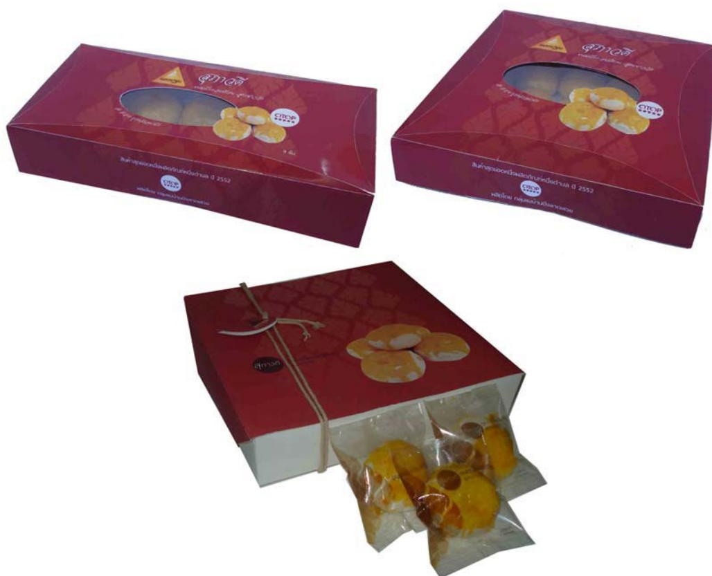
บรรจุภัณฑ์ขนมเปี๊ยะ

ภาพแสดงการนำบรรจุภัณฑ์ที่ออกแบบไปทดลองใช้งานกับผลิตภัณฑ์สินค้า