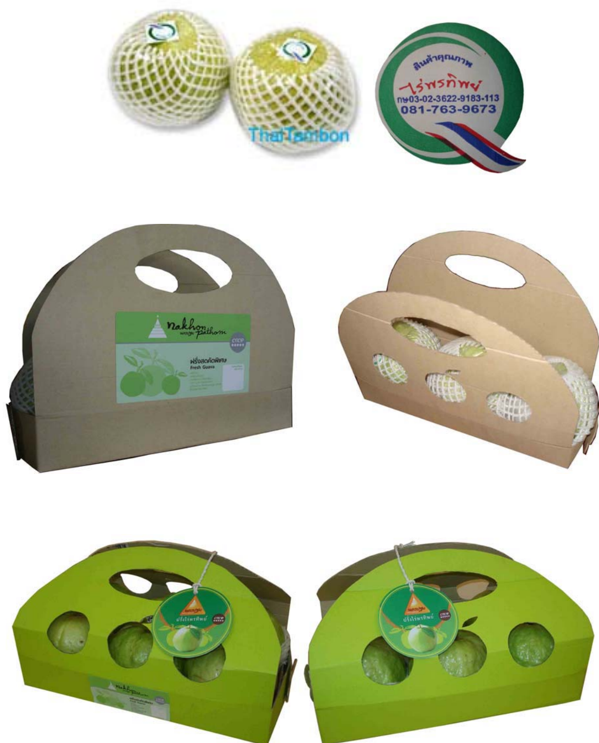
ภาพที่ 21 แสดงลักษณะบรรจุภัณฑ์ต้นแบบฝรั่งสดที่พัฒนาออกแบบใหม่