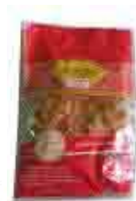
ภาพที่ 2 แสดงบรรจุภัณฑ์เดิมหมูแผ่น