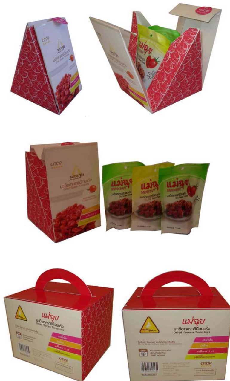
ภาพที่ 29 แสดงลักษณะบรรจุภัณฑ์ต้นแบบมะเขือเทศอบแห้งที่พัฒนาใหม่

การพัฒนาบรรจุภัณฑ์มะเขือเทศอบแห้งตราแม่จูนเพื่อการจำหน่ายแบบรวมรสเพื่อเป็นของฝาก ดังนั้นการออกแบบจึงนำแนวคิดนี้มาจัดทำบรรจุภัณฑ์ลักษณะเป็นกล่องสามเหลี่ยมบรรจุถุงมะเขือเทศ 3 ถุงๆละ 100 กรัม และกล่องบรรจุมะเขือเทศ 4 ถุงๆละ 250 กรัม จำนวน 4 ถุง ซึ่งแต่ละถุงจะมีรสชาติที่แตกต่างกัน เช่น รสดั้งเดิม รสบ๊วย รสเค็ม รสหวาน เป็นต้น