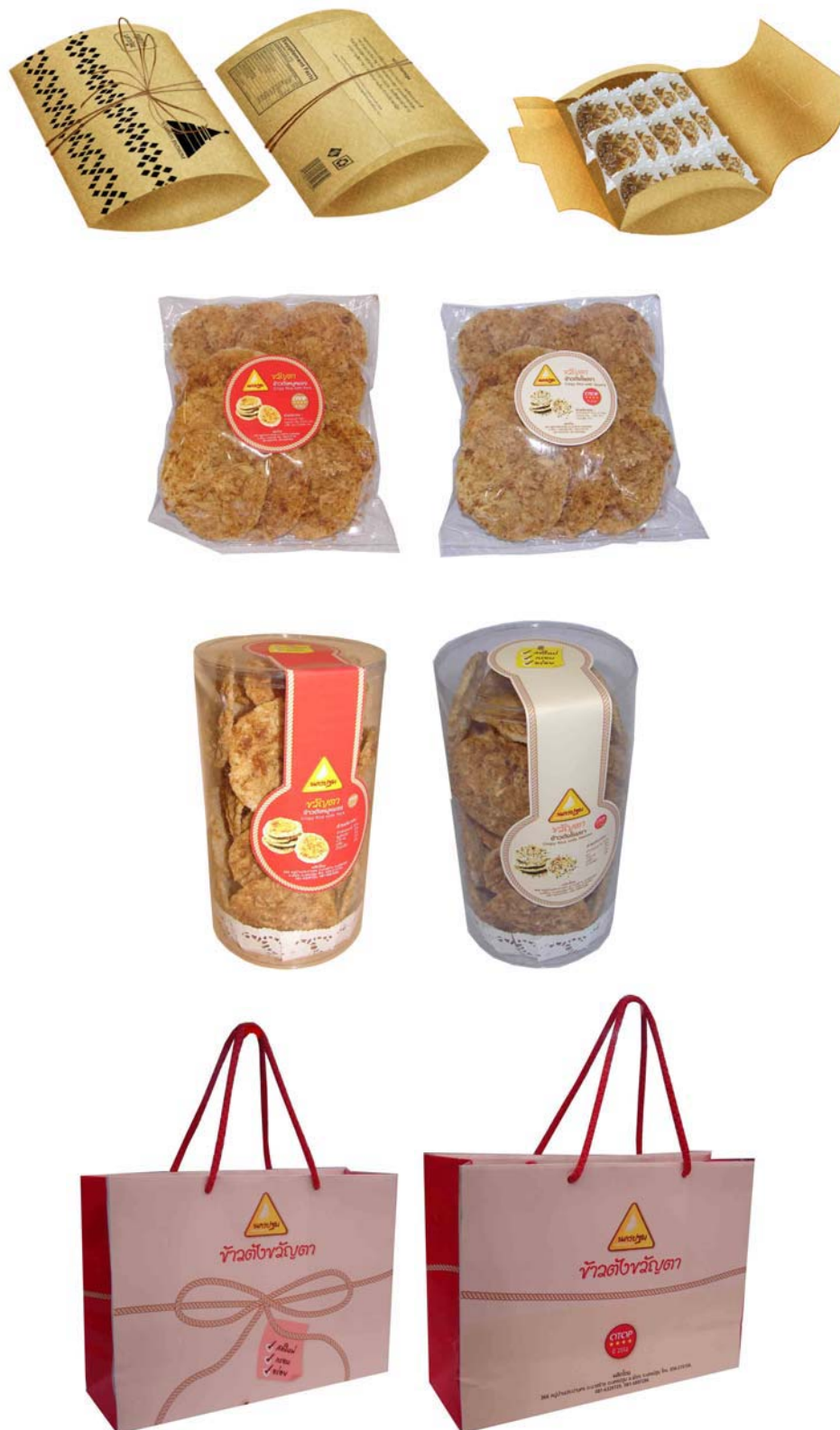
ภาพที่ 27 แสดงลักษณะบรรจุภัณฑ์ต้นแบบข้าวตังหมูหยองที่พัฒนาออกแบบใหม่