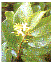
ชื่อพรรณไม้ จัน Diospyros decandra Lour