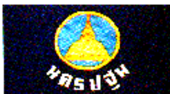
ธงประจำจังหวัดนครปฐม