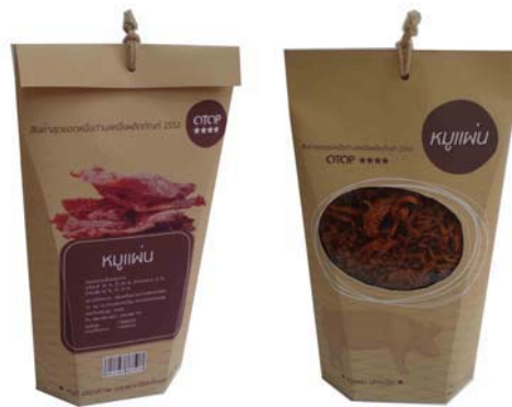
บรรจุภัณฑ์ต้นแบบหมูแผ่นบรรจุขนาด 200 กรัม