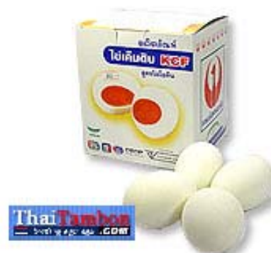
ภาพที่ 18 แสดงบรรจุภัณฑ์เดิมไข่เค็ม