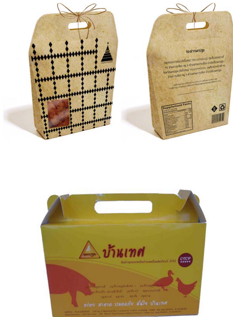
ภาพที่ 5 แสดงบรรจุภัณฑ์ต้นแบบหมูหยองที่พัฒนาออกแบบใหม่