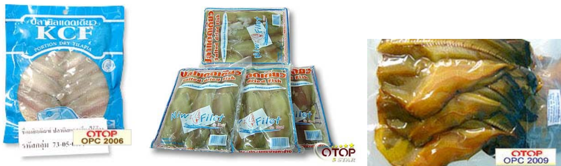
ภาพที่ 12 แสดงลักษณะบรรจุภัณฑ์เดิมของปลาแดดเดียว