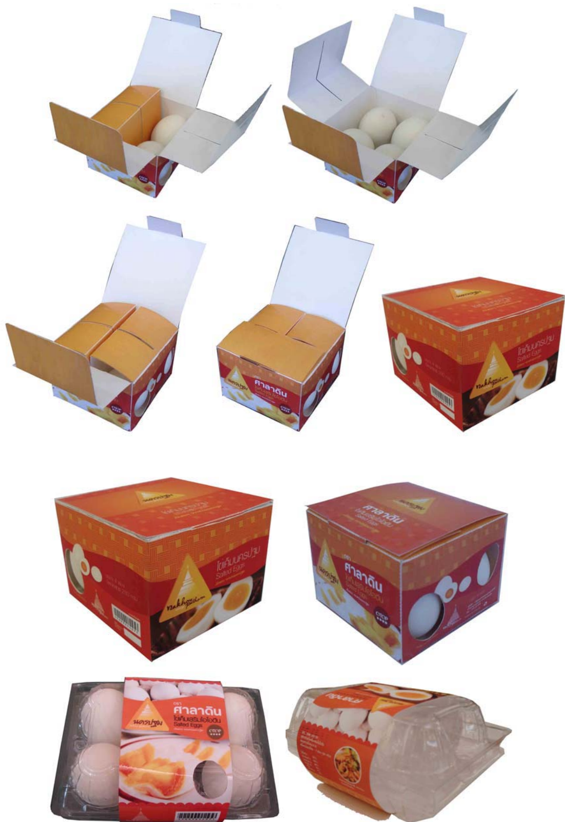
ภาพที่ 19 แสดงบรรจุภัณฑ์ต้นแบบไข่เค็มที่พัฒนาออกแบบใหม่