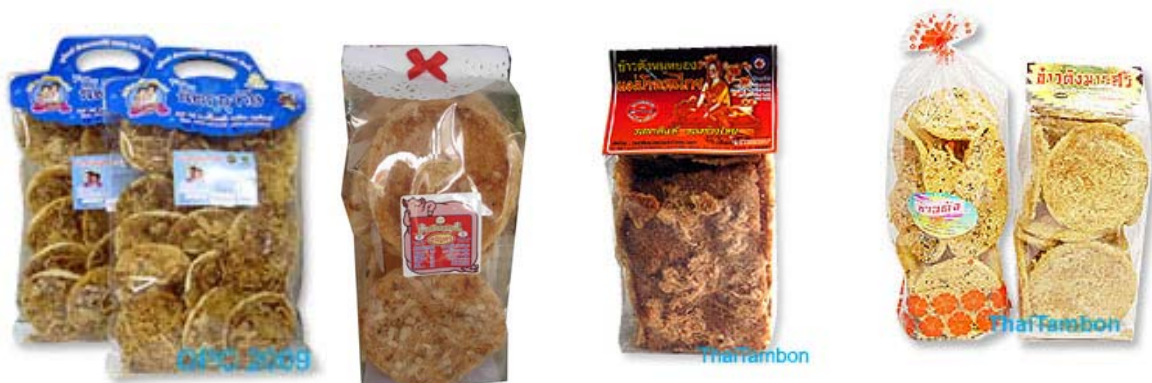
ภาพที่ 26 แสดงลักษณะบรรจุภัณฑ์เดิมของข้าวตังหมูหยอง