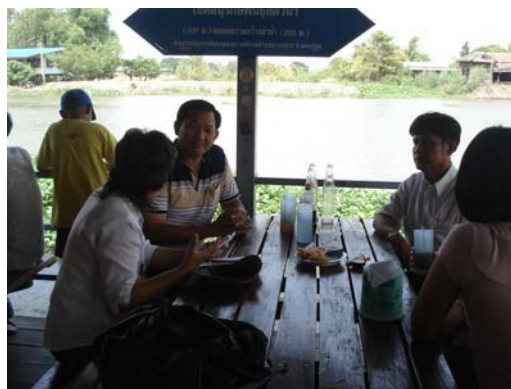
สัมภาษณ์นักท่องเที่ยวถึงศักยภาพบรรจุภัณฑ์และสินค้าที่ต้องการพัฒนาบรรจุภัณฑ์