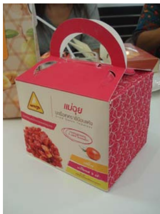
บรรจุภัณฑ์มะเขือเทศราชินีอบแห้ง

ภาพแสดงการนำบรรจุภัณฑ์ที่ออกแบบไปทดลองใช้งานกับผลิตภัณฑ์สินค้า