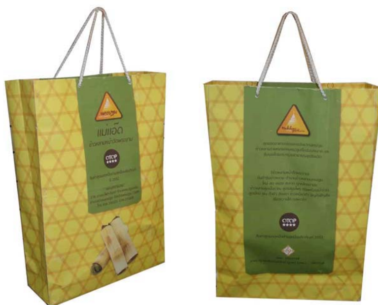
บรรจุภัณฑ์ข้าวหลาม