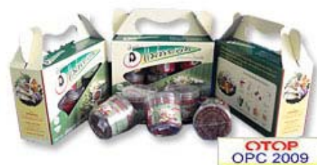
ภาพที่ 22 แสดงลักษณะบรรจุภัณฑ์เดิมน้ำพริกคลุกข้าว