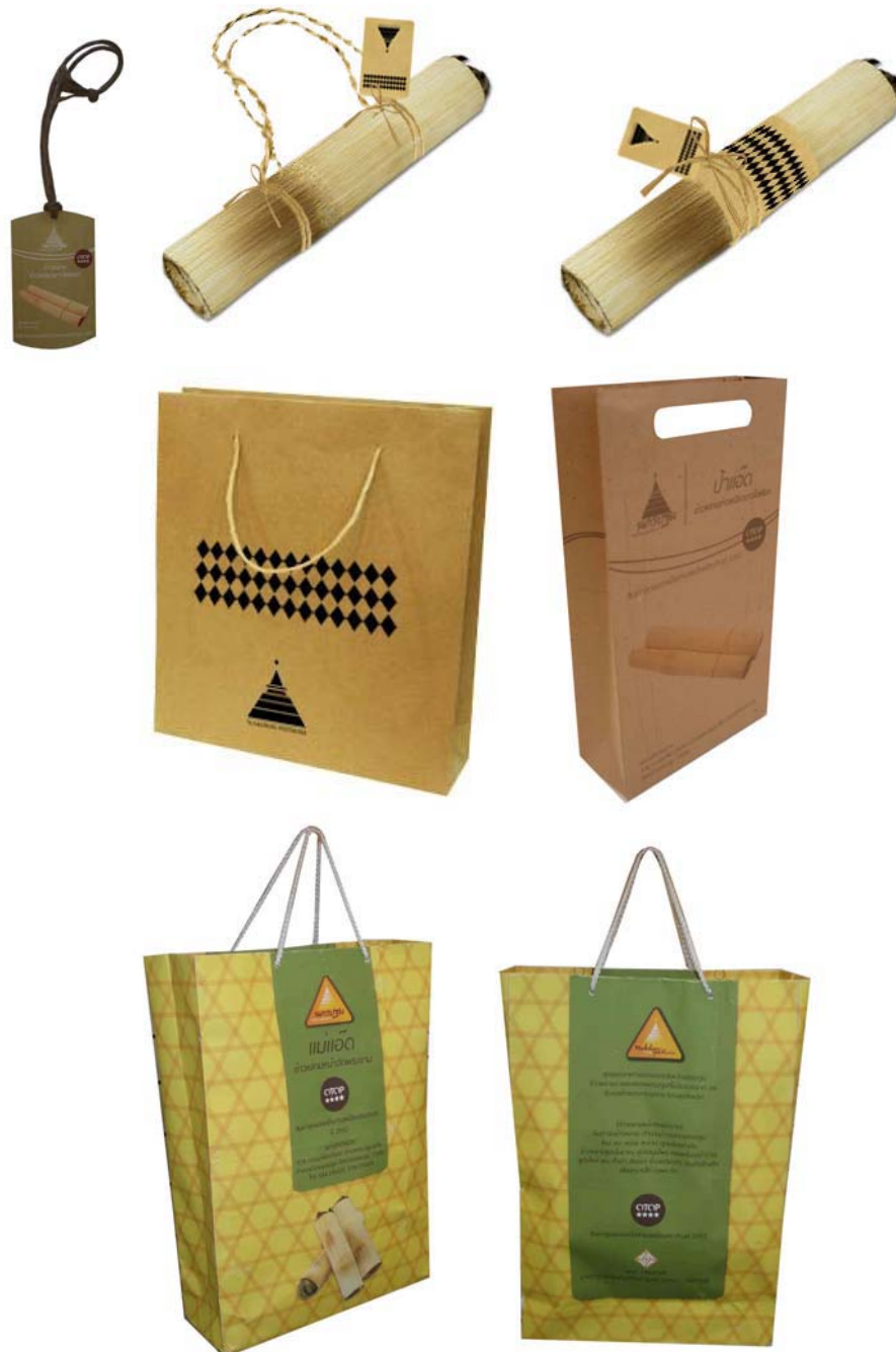
ภาพที่ 15 แสดงลักษณะบรรจุภัณฑ์ข้าวหลามที่พัฒนาออกแบบใหม่

การพัฒนาบรรจุภัณฑ์ข้าวหลาม โดยออกแบบป้ายฉลากแขวนบนกระบอกข้าวหลามและใช้ถุงกระดาษพิมพ์สี มีตราสัญลักษณ์สินค้าจังหวัดนครปฐมเพื่อสร้างความมั่นใจให้กับผู้ซื้อ เรื่องราวประวัติของสินค้าและผู้ผลิต