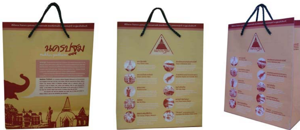
ภาพที่ 32 แสดงลักษณะบรรจุภัณฑ์กลางของจังหวัดนครปฐมแบบที่ 1

ผลงานการออกแบบบรรจุภัณฑ์กลางเป็นถุงกระดาษขนาดต่างๆ ได้ 2 รูปแบบ คือ