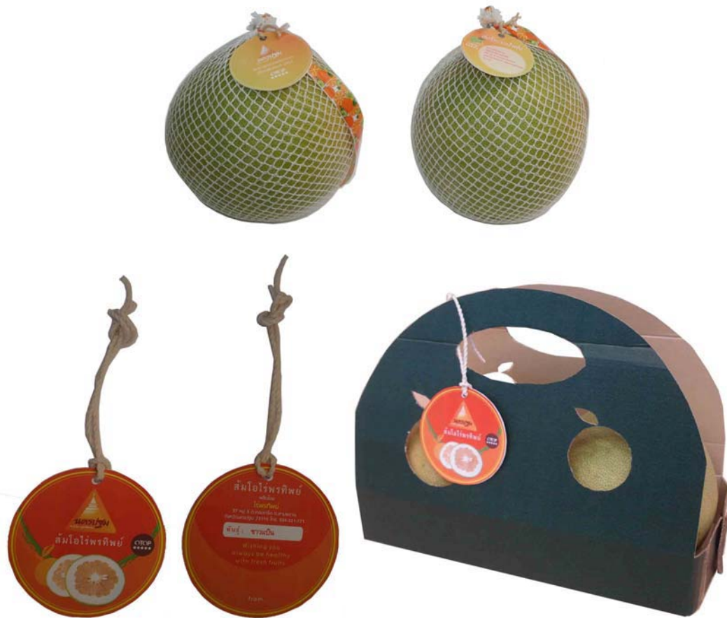
ภาพที่ 17 แสดงลักษณะบรรจุภัณฑ์ต้นแบบส้มโอที่พัฒนาออกแบบใหม่

ลักษณะบรรจุภัณฑ์ที่ออกแบบเป็นกล่องกระดาษลูกฟูกที่สามารถบรรจุผลส้มโอขนาดใหญ่ที่มีเส้นรอบวงประมาณ 18 นิ้ว น้ำหนักผลละประมาณ 2.5 กิโลกรัมได้ 2 ผล บรรจุภัณฑ์ที่ใช้เป็นกระดาษลูกฟูกสีเขียวเข้มพับเป็นกล่องเพื่อช่วยในการรับน้ำหนักส้มโอประมาณ 5-6 กิโลกรัม และเจาะช่องสำหรับหิ้วเพื่อสะดวกในการใช้งาน ติดป้ายแขวนสินค้าตราของผู้ผลิตเพื่อสร้างความมั่นใจให้ผู้ซื้อ ซึ่งบรรจุภัณฑ์ที่ออกแบบนี้สามารถนำไปใช้ร่วมกันได้ เพียงแต่ติดตราสัญลักษณ์หรือป้ายแขวนของผู้ผลิตแต่ละรายบนผลส้มโอ ส่วนป้ายสินค้าได้ออกแบบเป็นฉลากแขวนโดยใช้สัญลักษณ์ผลส้มโอบนแผ่นสีส้มเพื่อให้เกิดความโดดเด่นของรูปทรงและสี บนฉลากจะมีตราสินค้าของจังหวัดนครปฐม ชื่อแหล่งที่ผลิตและตรารับรองคุณภาพสินค้า OTOP ระดับ 5 ดาว ส่วนด้านหลังประกอบด้วยที่ตั้งของผู้ผลิตและได้ออกแบบให้สามารถใช้เป็นการดอวยพรเพื่อสุขภาพที่ดีจากผลไม้สดที่นำมาเป็นของฝากจากนักท่องเที่ยวได้อีกด้วย