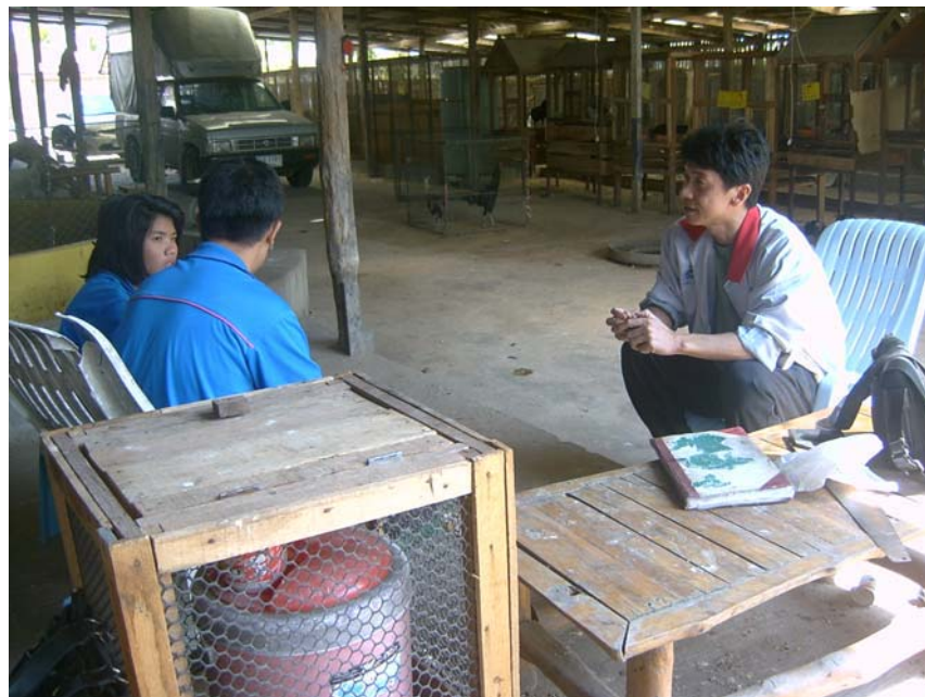
ยววิจัยสัมภาษณ์ผู้ให้ข้อมูลเรื่องเกลือบริโภค