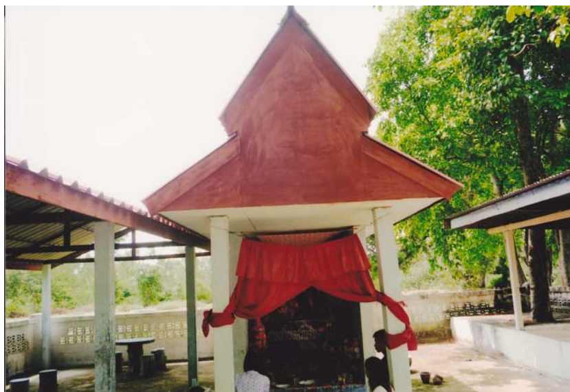
ภาพประกอบ 4 : ศาลเจ้าพ่อศรีนครเตาหลังใหม่บริเวณดอนหอ