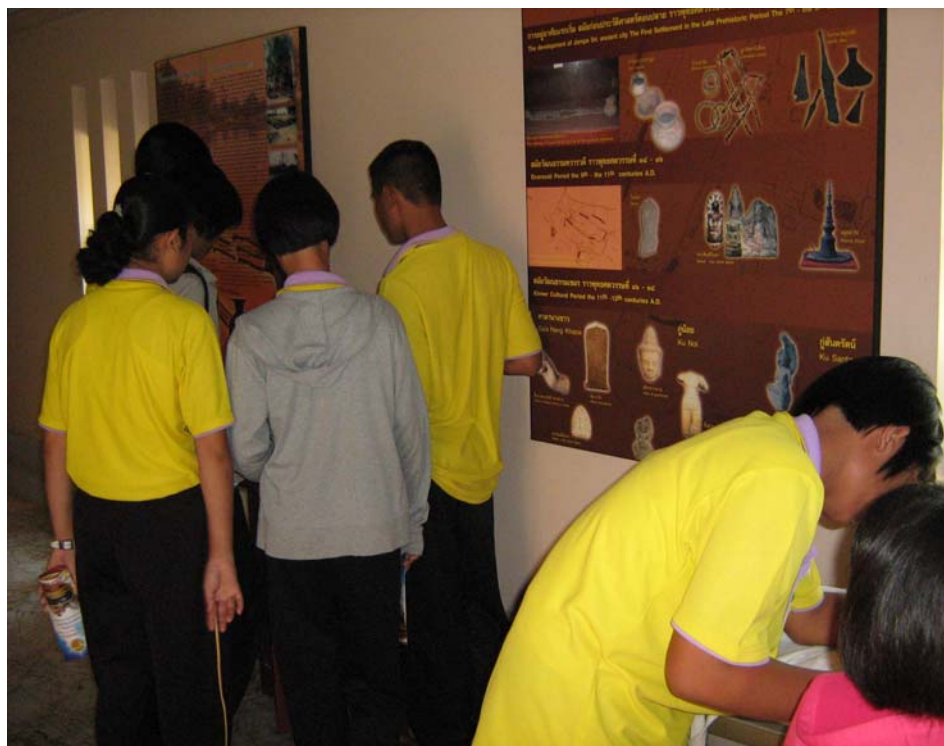
สืบค้นประวัติในพิพิธภัณฑ์