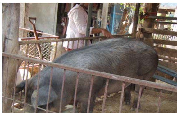
การเลี้ยงสัตว์