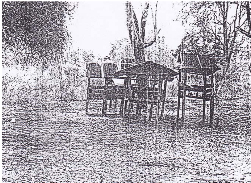
ภาพประกอบ 3 : หอสถาเจ้าพ่อต่างๆ ในบริเวณดอนหอ ที่มาของภาพ : อมาวสี เถียรถาวร. เจ้าพ่อศรีนครเตาฯ. หน้า 161.

นอกจากนี้ชาวบ้านยังได้ร่วมกันทำพิธีอัญเชิญดวงพระวิญญาณของเจ้าพ่อศรีนครเตา มาจากศาลเก่าบริเวณดอนตาปูให้มาประทับอยู่ที่ศาลหลังใหม่นี้ด้วย ซึ่งอย่างไรก็ดีชาวบ้าน ส่วนใหญ่ยังคงเชื่อว่าเจ้าพ่อศรีนครเตายังคงประทับอยู่ที่ศาลเดิมพร้อมกันนี้ยังได้เดินทางไป ๆ มา ๆ เพื่อประทับอยู่ที่ศาลหลังใหม่นี้ด้วย 80