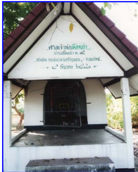
ศาลเจ้าพ่อเมืองเก่า

โปรดเกล้าฯ แต่งตั้ง ร.ศ. 98 หรือ พ.ศ. 2422 ตั้งเมืองฯ ที่บ้านนาข่า ร.ศ. 102 หรือ พ.ศ. 2426 ตั้งเมืองฯ ที่บ้านปะหลาน บริเวณต้นลำคาวนี้ ร.ศ. 112 หรือ พ.ศ. 2436” เป็นที่เคารพนับถือมาแต่โบราณตราบปัจจุบันและเป็นสถานที่ศึกษาค้นคว้าเกี่ยวกับประวัติศาสตร์ท้องถิ่นได้เป็นอย่างดี