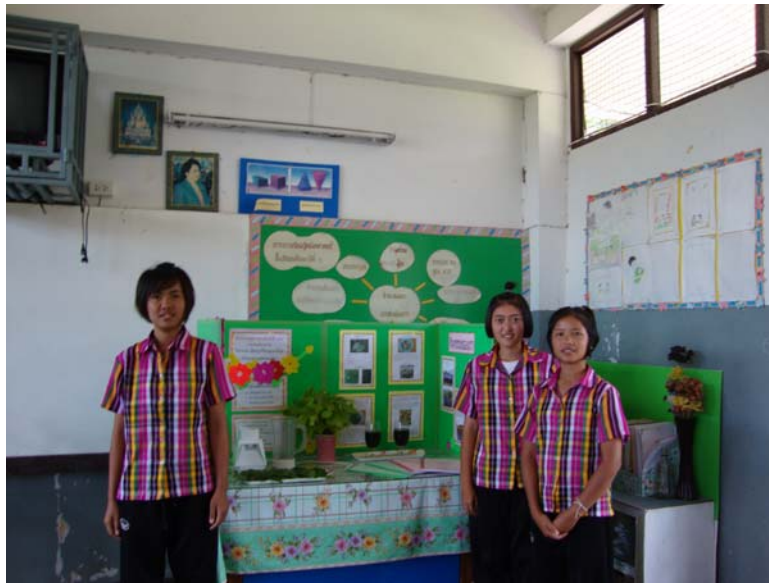
ศึกษาวิธีการและขั้นตอนการจัดทำโครงการพืชสมุนไพรโบราณ