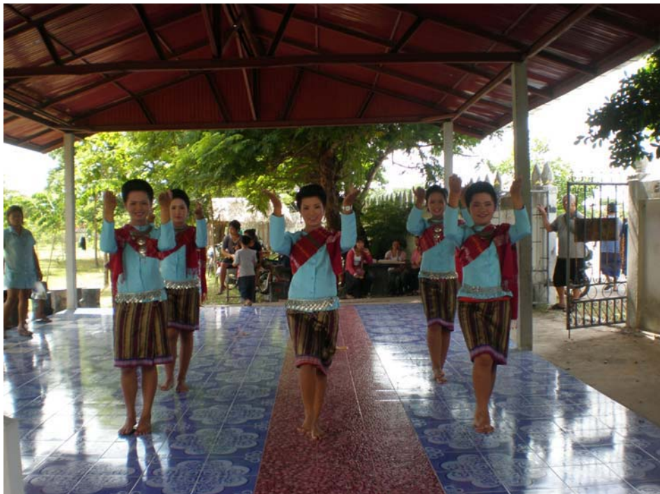
นักเรียนโรงเรียนบ้านบ่อใหญ่ รำถวายญาพ่อปู่