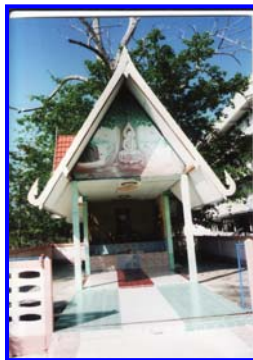
ศาลเจ้าพ่อบุญจันทร์ ในปัจจุบัน

เป็นยุคแห่งการเปลี่ยนแปลง พัฒนาทุกสิ่งทุกอย่างไม่ว่าจะเป็นเรื่องการมีส่วนร่วมของคน ในชุมชน ตลอดจนสิ่งก่อสร้างต่าง ๆ ภายในโรงเรียนมีการพัฒนาขึ้นมา รูปร่างของศาลได้มีการ การสร้างใหม่ประมาณปี พ.ศ. 2529 109 มีรูปทรงจัตุรมุขหลังคาด้วยกระเบื้อง ด้านหน้าเป็น รูปทรงสามเหลี่ยมผนังก่ออิฐฉาบปูน มีบริเวณประกอบพิธีกรรม มีประตูด้านหน้าข้างในศาล มีภาพวาดของเจ้าพ่อบุญจันทร์ตามนิมิต สิ่งของต่าง ๆ ที่มีผู้ถวาย มีถนนคอนกรีตเข้าไปยัง บริเวณศาลทำให้สะดวกต่อการเข้าไปประกอบพิธีกรรม บริเวณศาลเจ้าพ่อบุญจันทร์เป็นเขต ต้องห้าม มิให้นักเรียนมาเล่นส่งเสียงดังต้องมีความยำเกรงไม่กล้าบุกรุกเข้าไป เพราะถือว่าเป็น สถานที่อันศักดิ์สิทธิ์