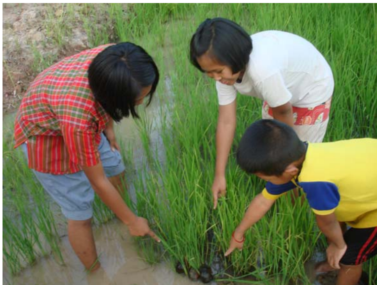
กำจัดหอยเชอร์รี่