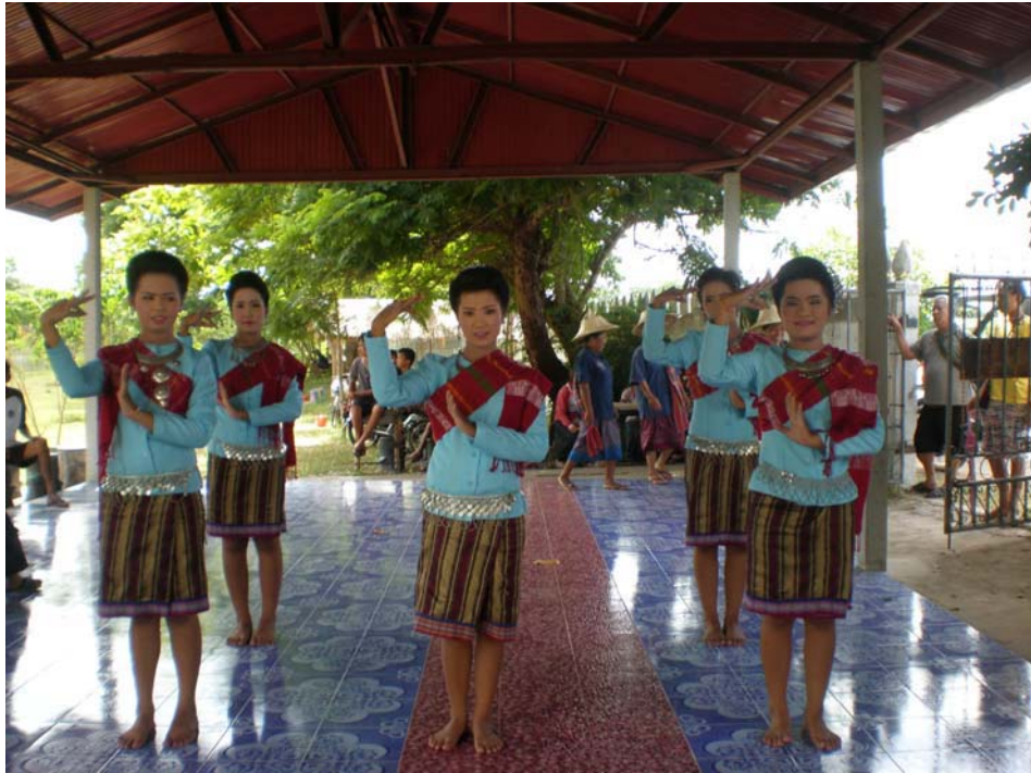
นักเรียนโรงเรียนบ้านบ่อใหญ่รำถวายญาพ่อปู่