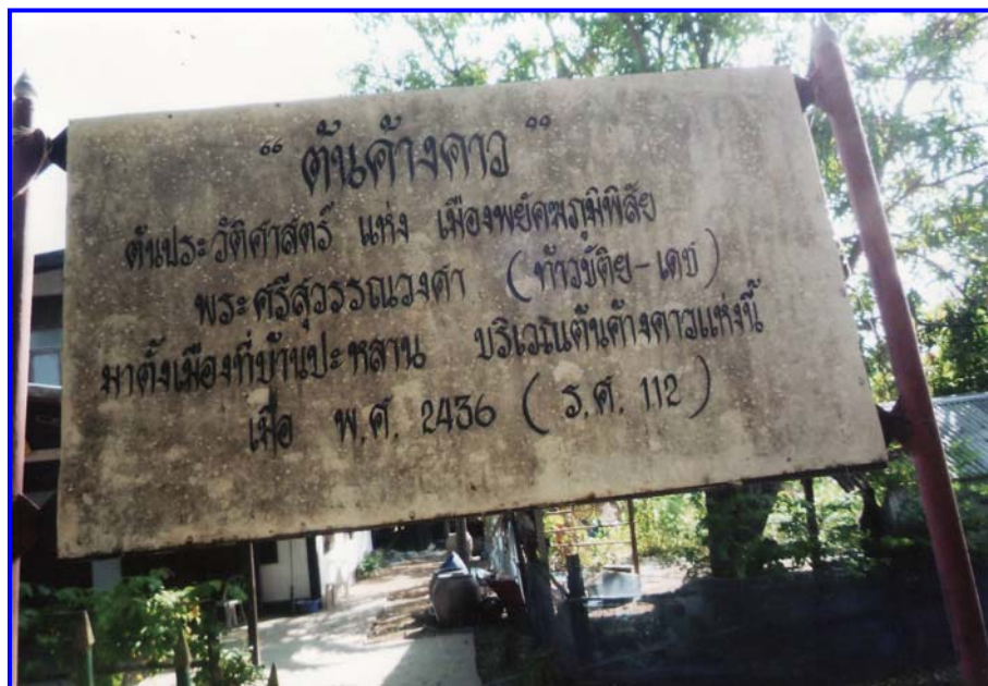
ป้ายต้นค้ำคาวเป็นหลักฐานพบประวัติศาสตร์

บริเวณต้นค้ำคาวมีศาลเก่าแก่และศาลใหม่เขียนข้อความว่า “ศาลเจ้าเมืองพยุหะ ภูมิพิสัย พระศรีสุวรรณวงศา (ท้าวขัตติย – เดช) (ร.ศ. 98 – 126 หรือ พ.ศ. 2422 – 2450)