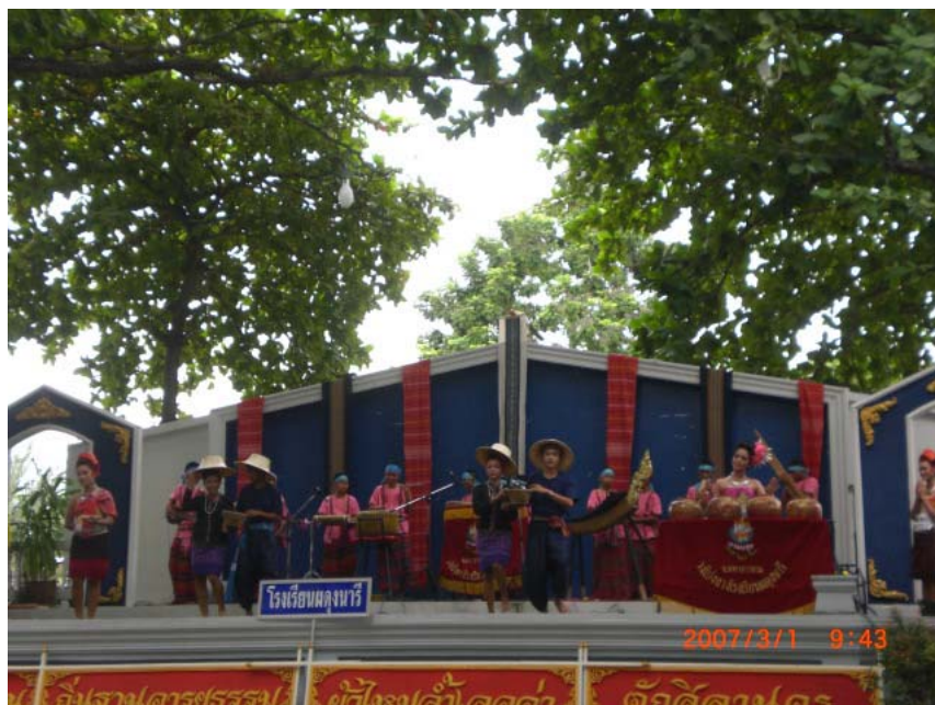
ท่าหวานข้าว

ยุคที่ 1 ทำรำทำนาครกมองแบบดั้งเดิม พ.ศ. 2537 – พ.ศ. 2547 ยุคการฟ้อนรำในช่วงนี้เป็น การประดิษฐ์ทำรำขึ้นมาฝึกนักเรียนหญิงที่เข้าเป็นสมาชิกวงโป่งกลาง ด้วยนโยบายของกรมสามัญศึกษาต้องการให้โรงเรียนมัธยมศึกษามีการเรียนการสอนเรื่องดนตรีพื้นเมือง