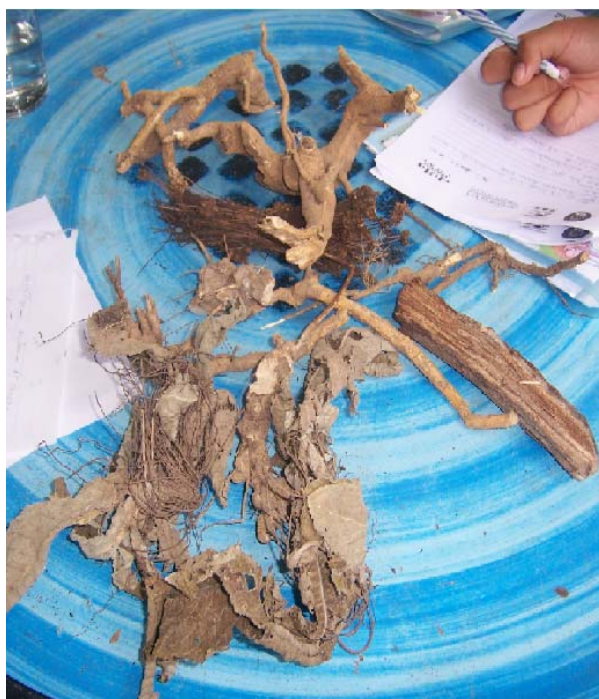
ตัวอย่างพืชสมุนไพรที่นำมาใช้เป็นยาสมุนไพร