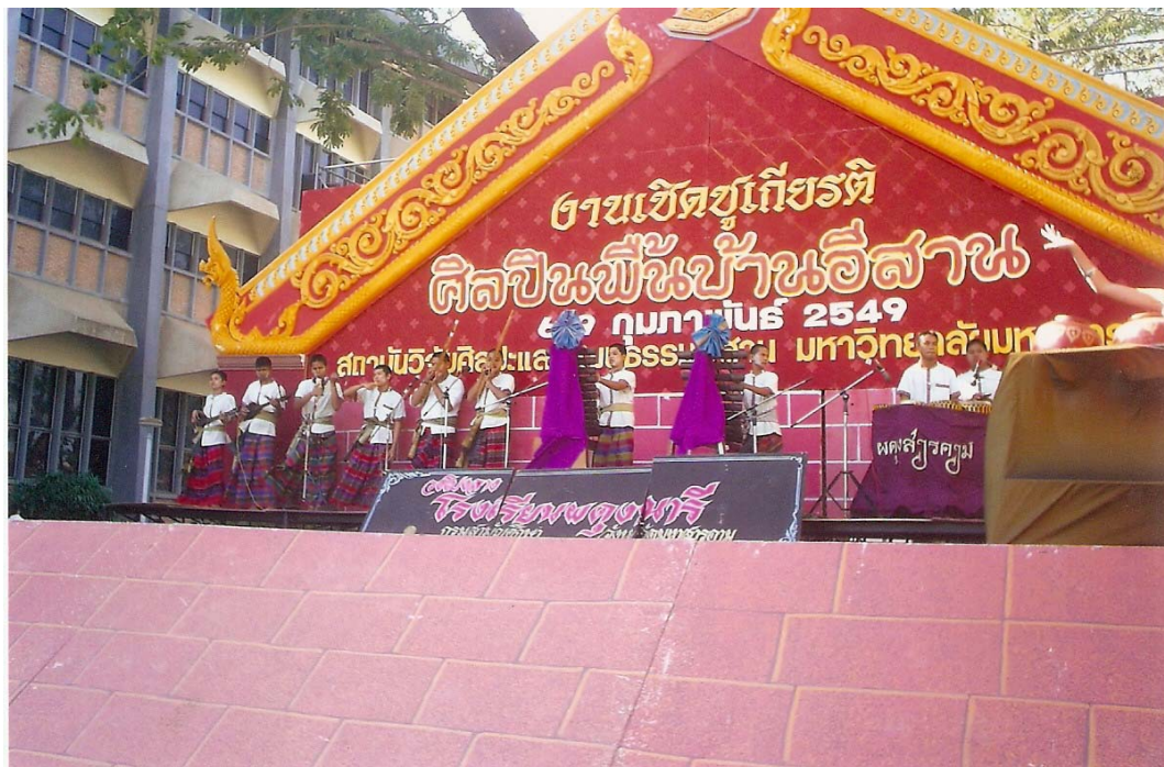
การแสดงวงโปงลางของโรงเรียนผดุงนารี