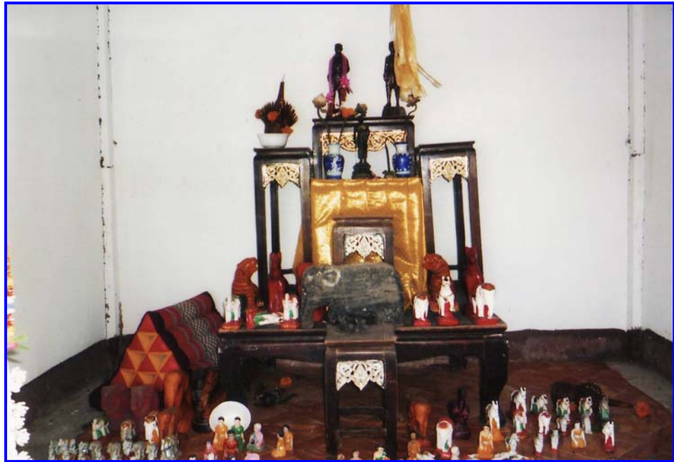
หุ่นปั้นจำลองเจ้าเมืองคนแรก (พระศรีสุวรรณวงศา)