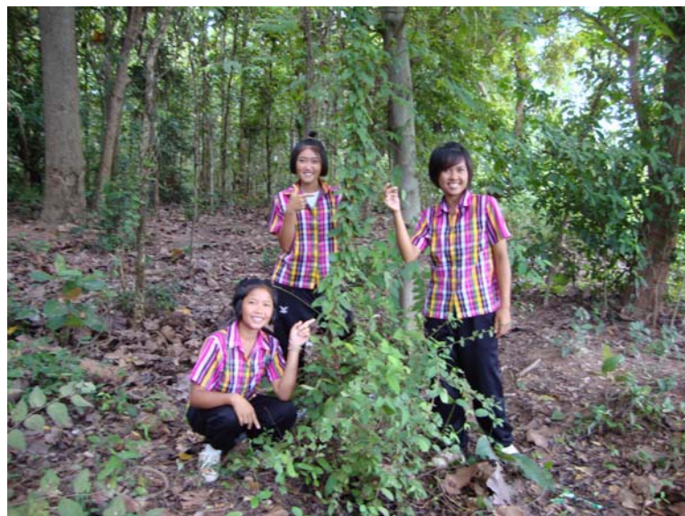
มีส่วนร่วมในการอนุรักษ์พืชสมุนไพรโบราณ