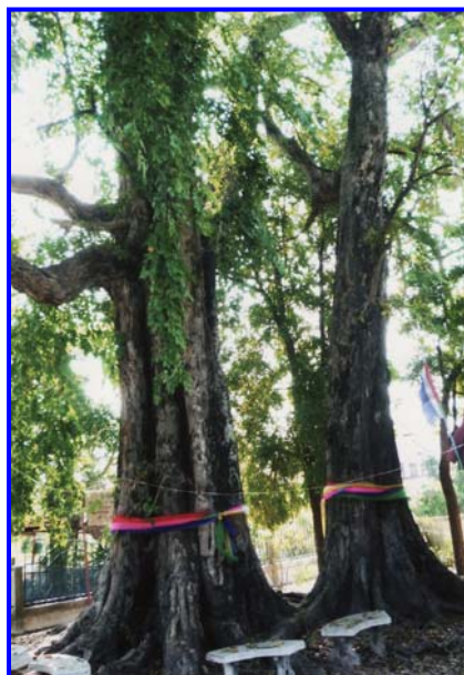
ต้นค้ำคว ซึ่งเป็นต้นไม้ประวัติศาสตร์อำเภอพยุหะภูมิพิสัย

ปัจจุบัน (พ.ศ. 2553) ต้นค้ำควอายุประมาณ 133 ปี สูงประมาณ 60 เมตร เป็นต้นไม้สูงสุดของอำเภอพยุหะภูมิพิสัย ระยะห่าง 10 กิโลเมตร สามารถมองเห็นส่วนปลายของต้น ขนาดลำต้นใช้ผู้ใหญ่ 5 คนจึงโอบรอบ วัดโดยรอบ 6.15 เมตร ขณะนี้มีต้นลูกเกิดขึ้นมาเคียงคู่เกิดมาหลายสิบปีแล้ว วัดโดยรอบได้ 3.85 เมตร