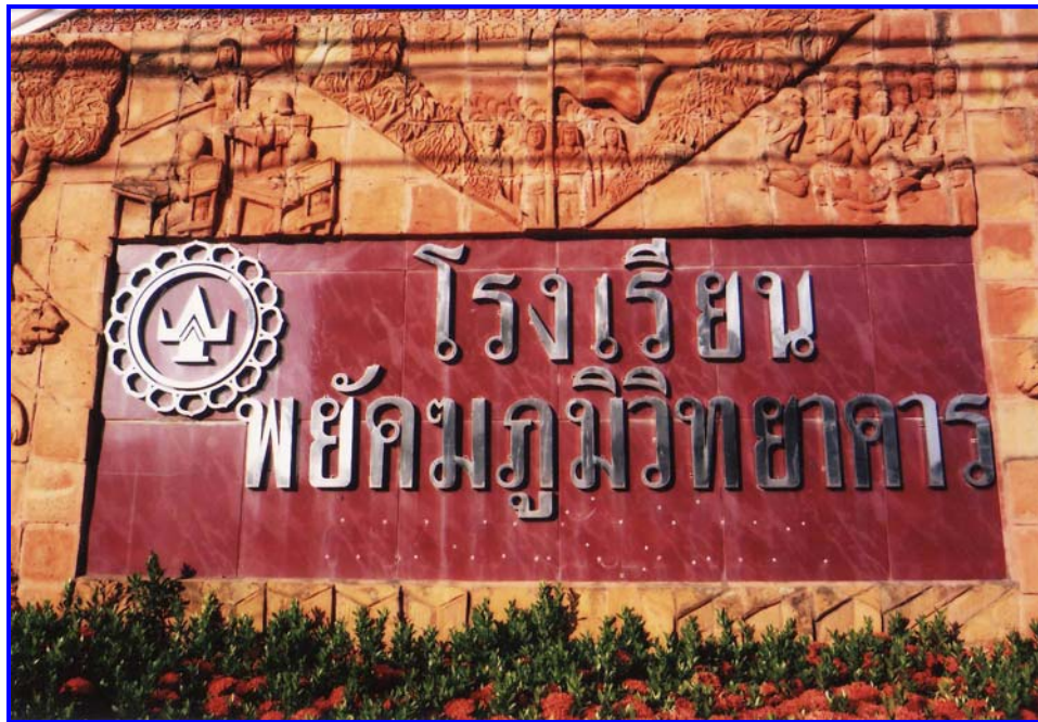
ป้ายโรงเรียนพยัคฆภูมิวิทยาคาร