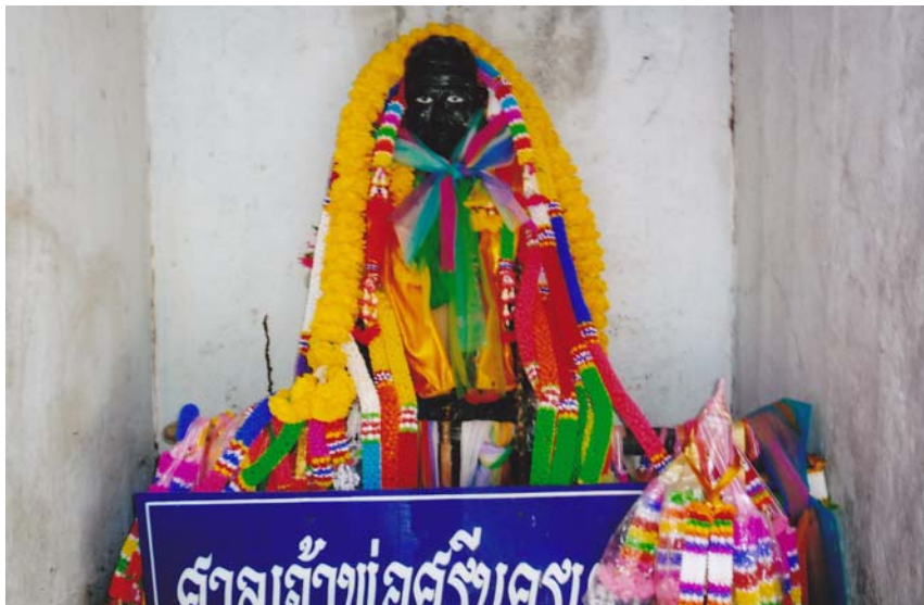
ภาพประกอบ 2 : รูปปั้นเจ้าพ่อศรีนครเตา

ความเชื่อในยุคนี้มีความเจริญต่าง ๆ เข้ามาในชุมชน เช่น ด้านการศึกษาด้านเทคโนโลยี หน่วยงานราชการเข้าสู่ชุมชน ทำให้ความเชื่อเปลี่ยนไปเนื่องจากคนได้รับการศึกษามากขึ้นทำให้มีความคิดเปลี่ยนไป การหาประโยชน์จากป่าชุมชนก็ลดน้อยลงเนื่องจาก ป่าถูกทำลายไปพร้อมความเจริญ สิ่งอำนวยความสะดวกทั้งเครื่องอุปโภค บริโภค ซึ่งทีมวิจัย ได้แบ่งมิติเวลาของยุคนี้จากการย้ายศาลเจ้าพ่อฯ จากคอนปู้ตามาที่คอนห่อปัจจุบันพร้อมกับสร้างโรงเรียนบ้านเมืองเตาในปี พ.ศ. 2512 ซึ่งเดิมบริเวณดังกล่าวเป็นป่าทึบมีต้นไม้หนาติดกัน จึงไม่มีใครกล้าเดินเข้าไป ศาลใหม่นี้สร้างที่บริเวณคอนห่อ หรือที่ชาวบ้านเรียกกันว่า “ห่อใน” ก่อด้วยปูนและปั้นรูปเจ้าพ่อศรีนครเตาในท่าประทับนั่ง บริเวณนี้เดิมก็เป็นที่ตั้งหอศาลของเจ้าพ่อต่าง ๆ ซึ่งถือเป็นบริวารโดยสร้างแต่เก่าก่อนอยู่แล้วด้วย