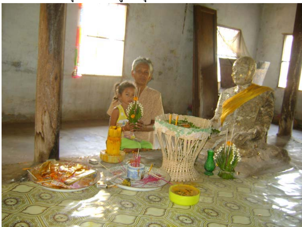
การบำนพระพุทธรูปศักดิ์สิทธิ์