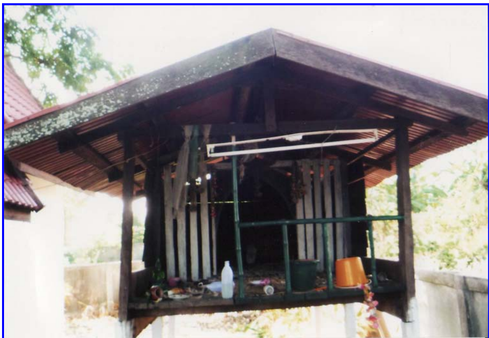
ศาลไม้หลังเก่าบริเวณต้นค้างคาว