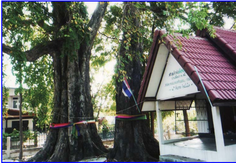
ต้นค้ำคาวคู่ข้างศาลเก่า