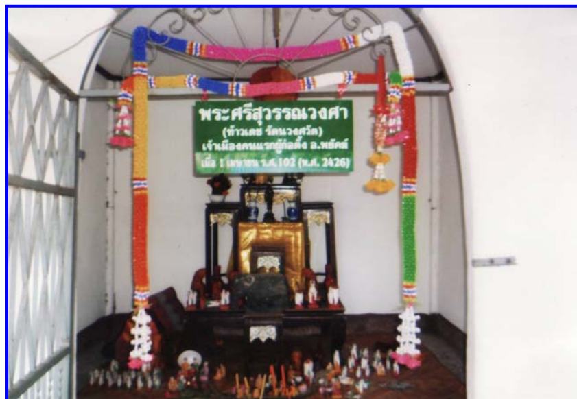
ศาลใหม่ “ศาลเจ้าเมืองพยัคฆภูมิพิสัย”