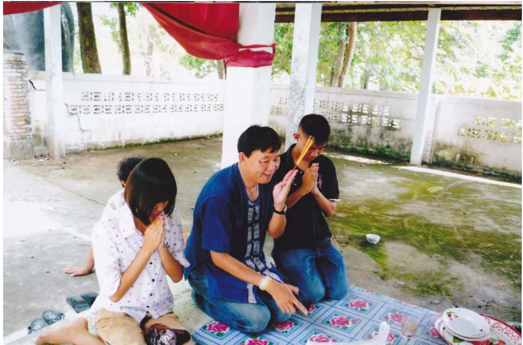
ภาพประกอบ 5 : สถานที่ทำกิจกรรมบริเวณศาลเจ้าพ่อศรีนครเตา

ปี พ.ศ. 2548 สภากองค์การบริหารส่วนตำบลเมืองเตา จัดสรรงบประมาณสร้างหลังคาในบริเวณศาลเจ้าพ่อฯ เพื่อใช้ในการทำกิจกรรมต่าง ๆ