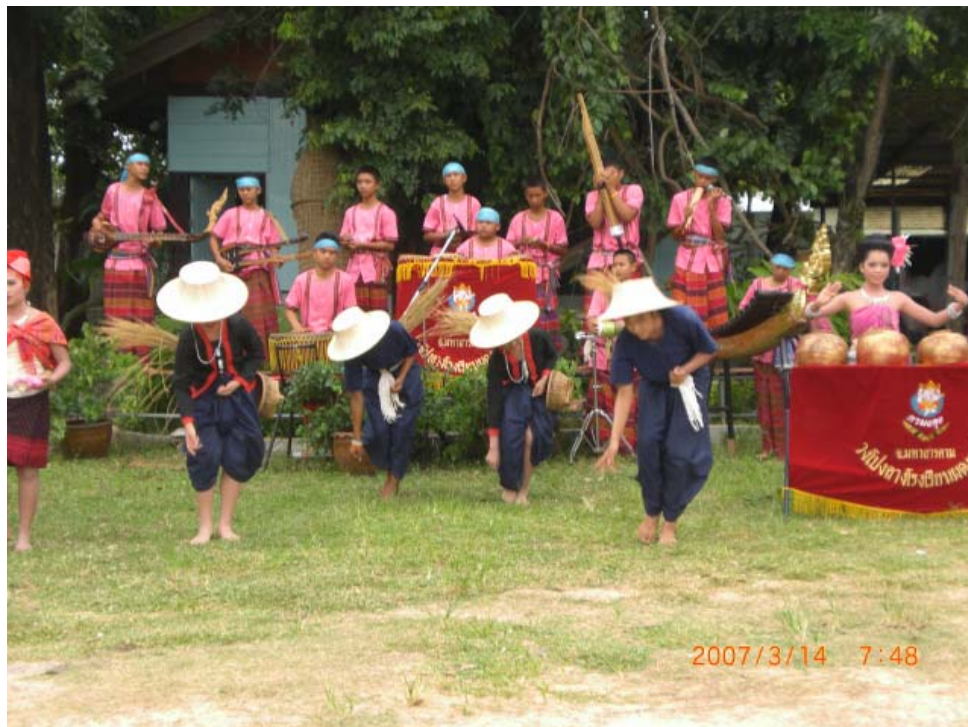
ทำหว่านข้าว

และการแสดงยังไม่แพร่หลายในทำไร่ฟ่อนทำนาक्रमอง เพราะเพิ่งได้รับการฝึกซ้อมยังไม่เปิดความคล่องตัว การคิดประดิษฐ์ทำไร่ฟ่อนทำนาक्रमองได้พบความสำคัญของอาชีพหลักของชาวอีสานคืออาชีพทำนา และคนได้มีความสัมพันธ์กับอาชีพที่ปลูกข้าวโดยคนได้ศึกษาอธิบายของคนที่มีอาชีพทำนามีการไถนา หว่านข้าว เกี่ยวข้าว และดำข้าวด้วยการใช้วัวในร่างกาย ทำท่าทางอย่างไร ผู้มีความรู้เรื่องการฟ่อนไร่ได้ประยุกต์จากพฤติกรรมที่ชาวนาแสดงออกแล้วทำเป็นท่าทางในลักษณะการยกส้นเท้าเข้ากันมองดูแล้วสวยงามแล้วคนดูมีความสุข อธิบายท่าทางการไร่ได้ว่า คือการไถนา หรือหว่านข้าวเกิดจากการสังเกตพฤติกรรมของชาวนาในจังหวัดมหาสารคาม