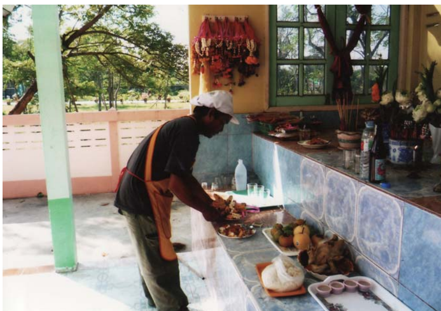
พ่อค้าในโรงอาหาร โรงเรียนสักระเจ้าพ่อบุญจันทร์ทุกวันพุธ