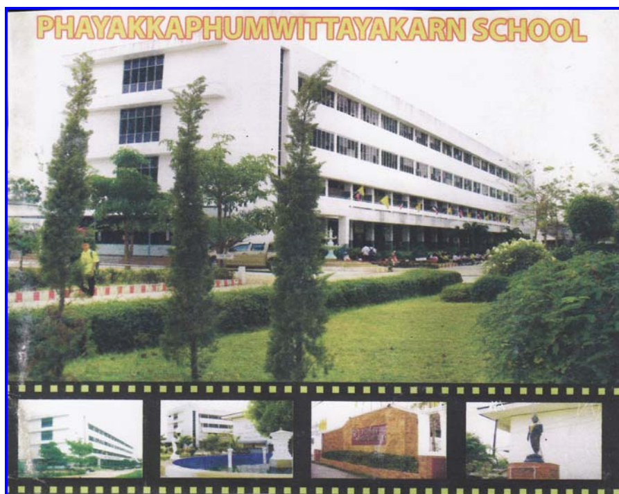
โรงเรียนพยัคฆภูมิวิทยาคารในปัจจุบัน