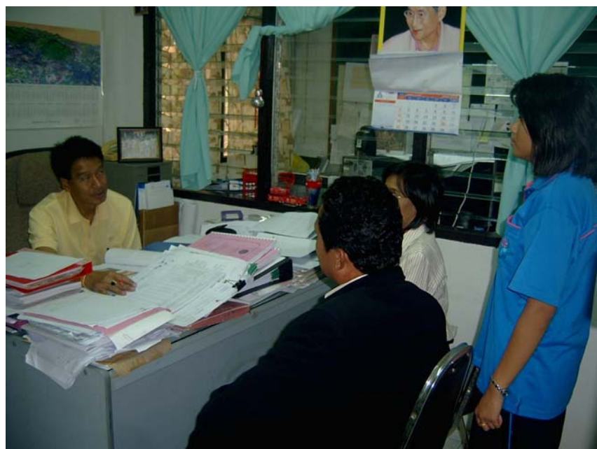
ยววิจัยและครูที่ปรึกษาสัมภาษณ์เจ้าหน้าที่ชลประทานลำน้ำเดียว