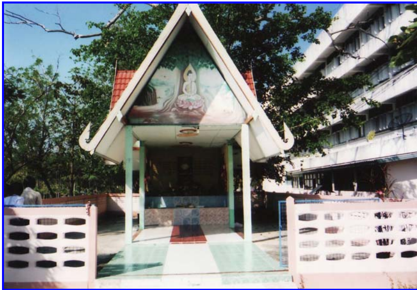
ซากต้นเขาคำบริเวณศาลเจ้าพ่อบุญจันทร์

ปัจจุบัน (พ.ศ. 2553) ต้นค้ำควอายุประมาณ 133 ปี สูงประมาณ 60 เมตร เป็นต้นไม้สูงสุดของอำเภอพยุหะภูมิพิสัย ระยะห่าง 10 กิโลเมตร สามารถมองเห็นส่วนปลายของต้น ขนาดลำต้นใช้ผู้ใหญ่ 5 คนจึงโอบรอบ วัดโดยรอบ 6.15 เมตร ขณะนี้มีต้นลูกเกิดขึ้นมาเคียงคู่เกิดมาหลายสิบปีแล้ว วัดโดยรอบได้ 3.85 เมตร