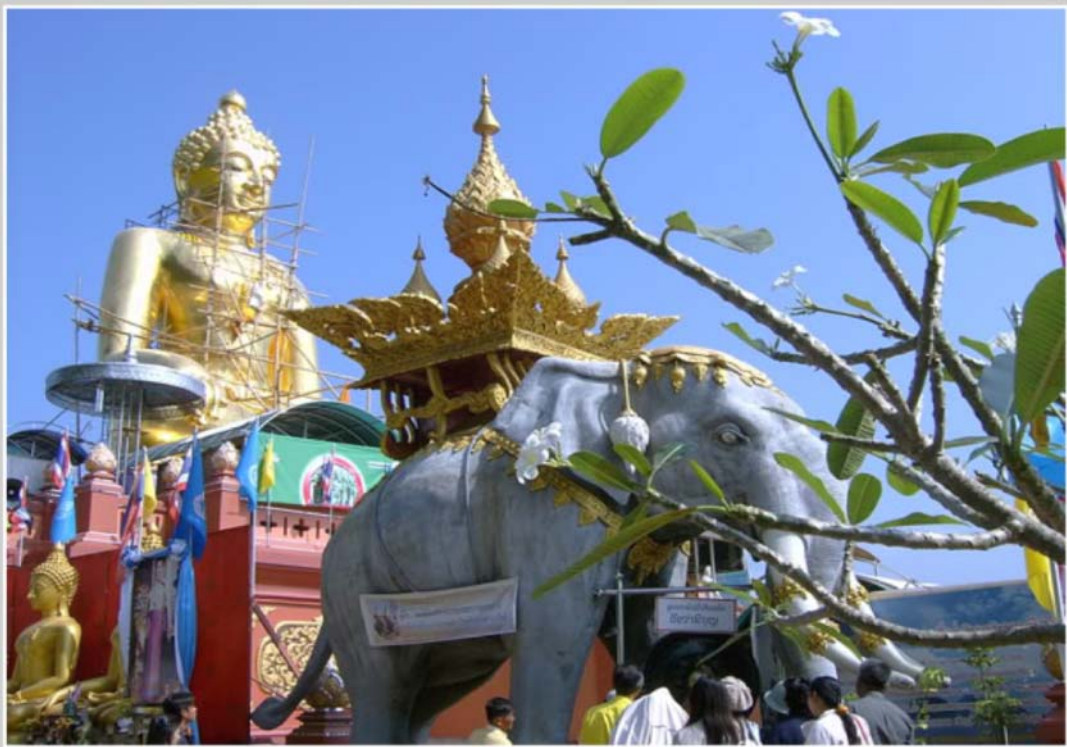
11. ทะเลสาบเชียงแสน