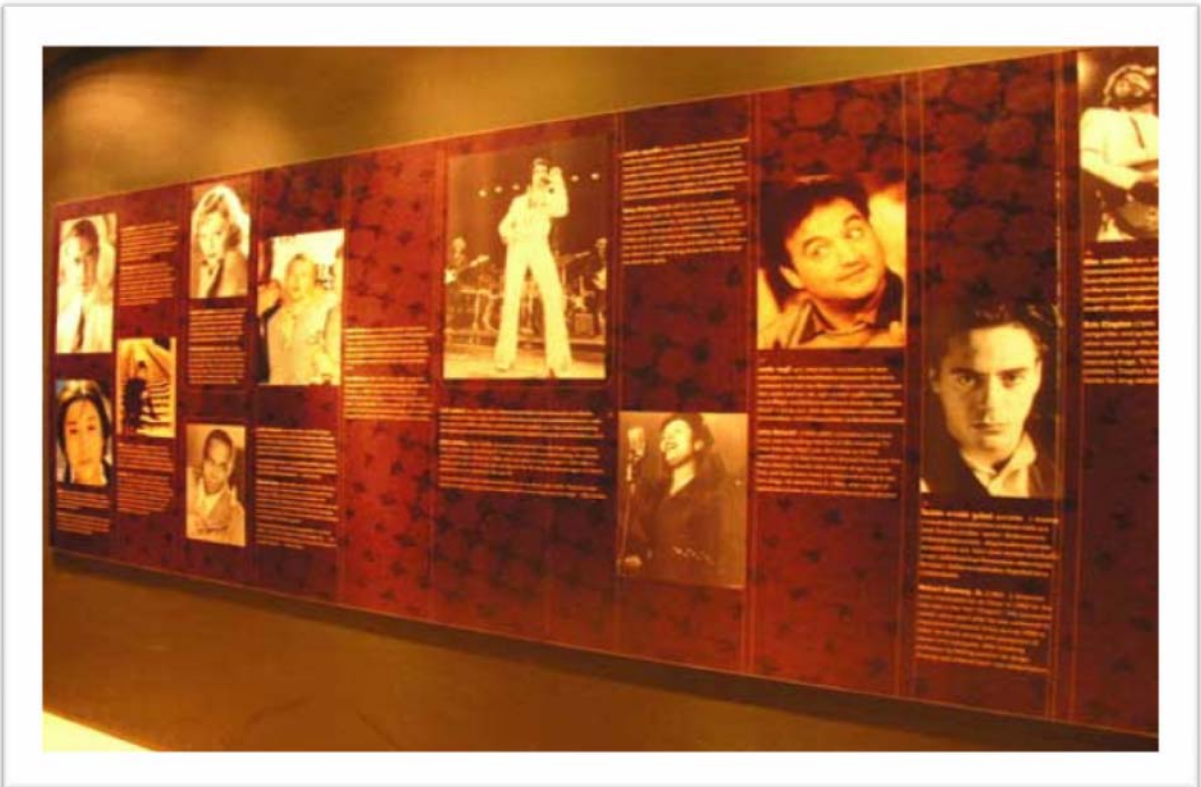
10. อุทยานสามเหลี่ยมทองคำ