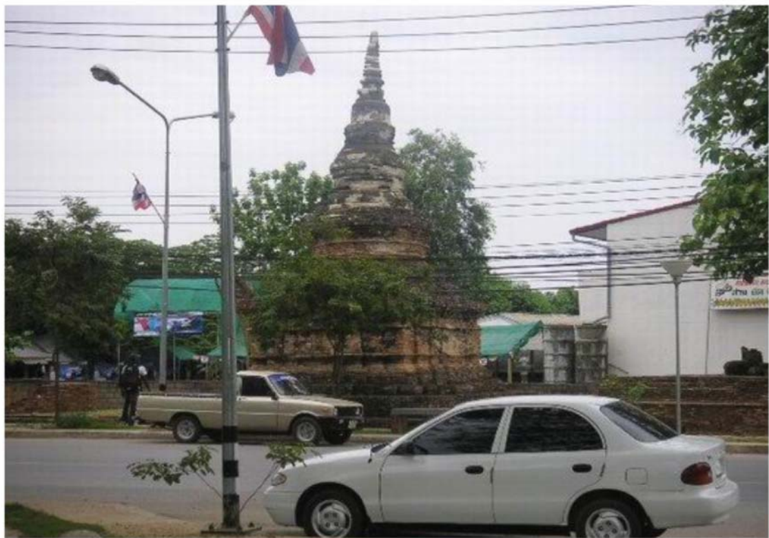
3. วัดพระธาตุผาเงา