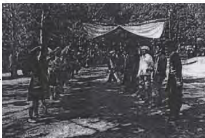
ภาพที่ 4 : การโยนลูกช่วง