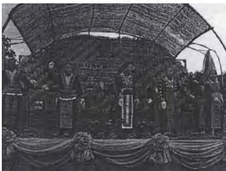
ภาพที่ 3 : บรรยากาสงงานปีใหม่ม้ง