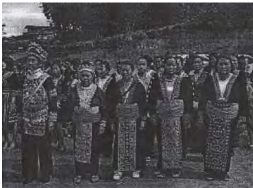
ภาพที่ 5 : การแต่งกายชาวเขาเผ่าม้ง