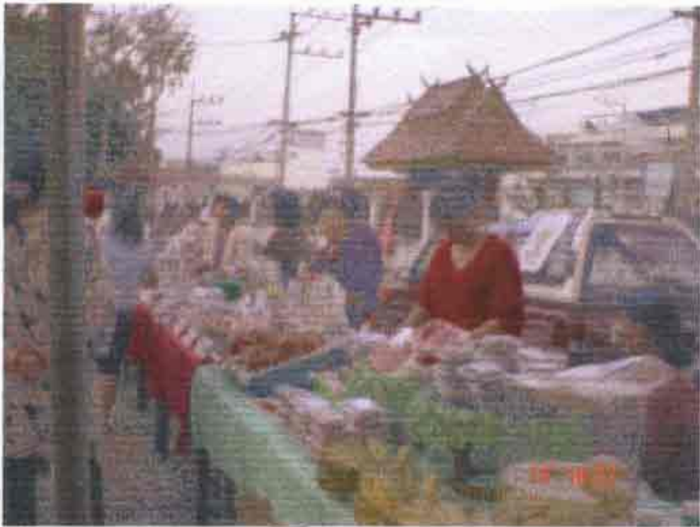
ทีมวิจัยและสมาชิกกลุ่มร่วมกันดำเนินกิจกรรมการขายตลาดหน้าที่ว่าการอำเภอแม่สาย