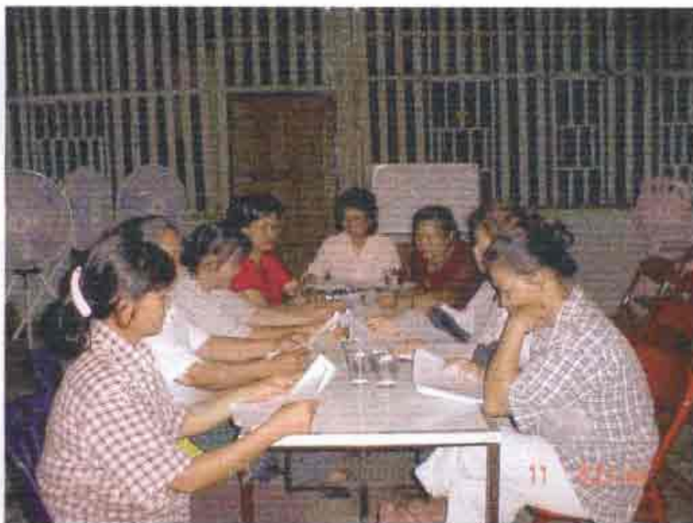
สมาชิกทีมวิจัยร่วมกันวางแผนในการดำเนินกิจกรรมของโครงการ