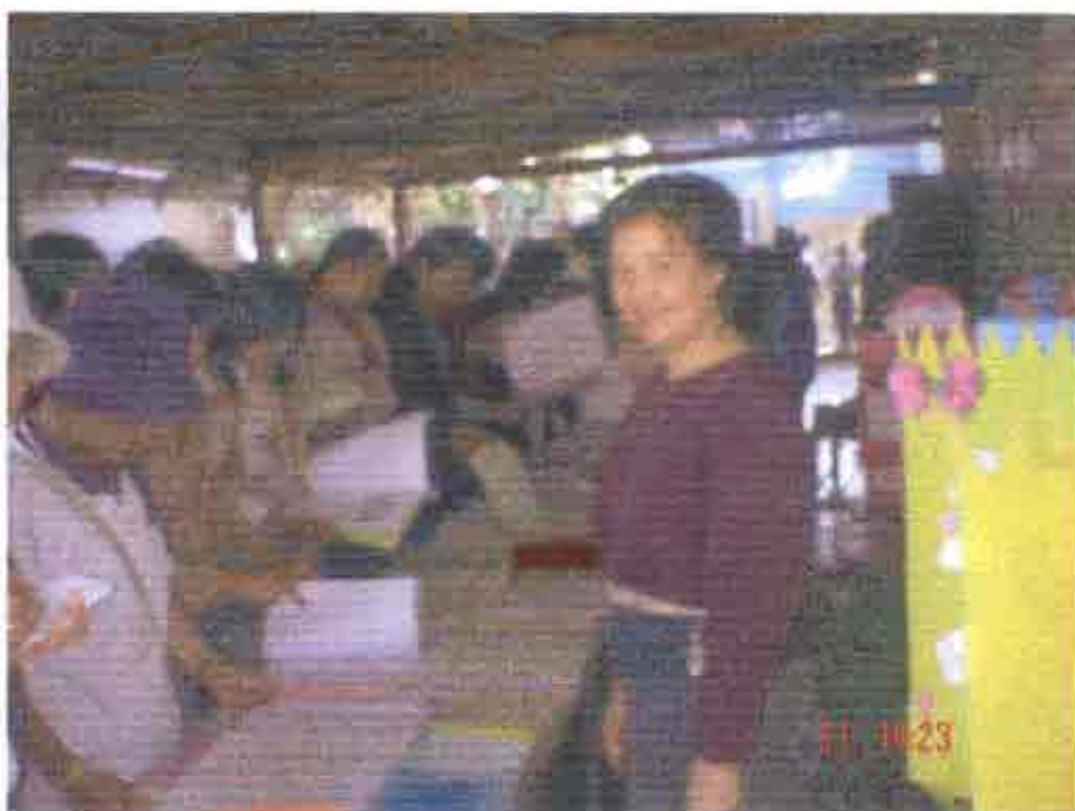
ทีมวิจัยและสมาชิกกลุ่มร่วมกันดำเนินกิจกรรมการขยายตลาดหน้าเวทีการอำเภอแม่สาย