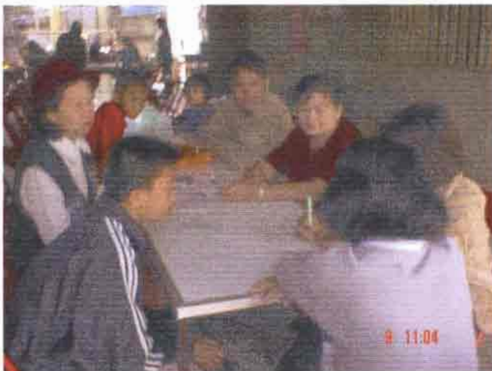
นักเรียนและทีมวิจัยร่วมกันปรึกษากิจกรรมที่จะดำเนินการร่วมกัน