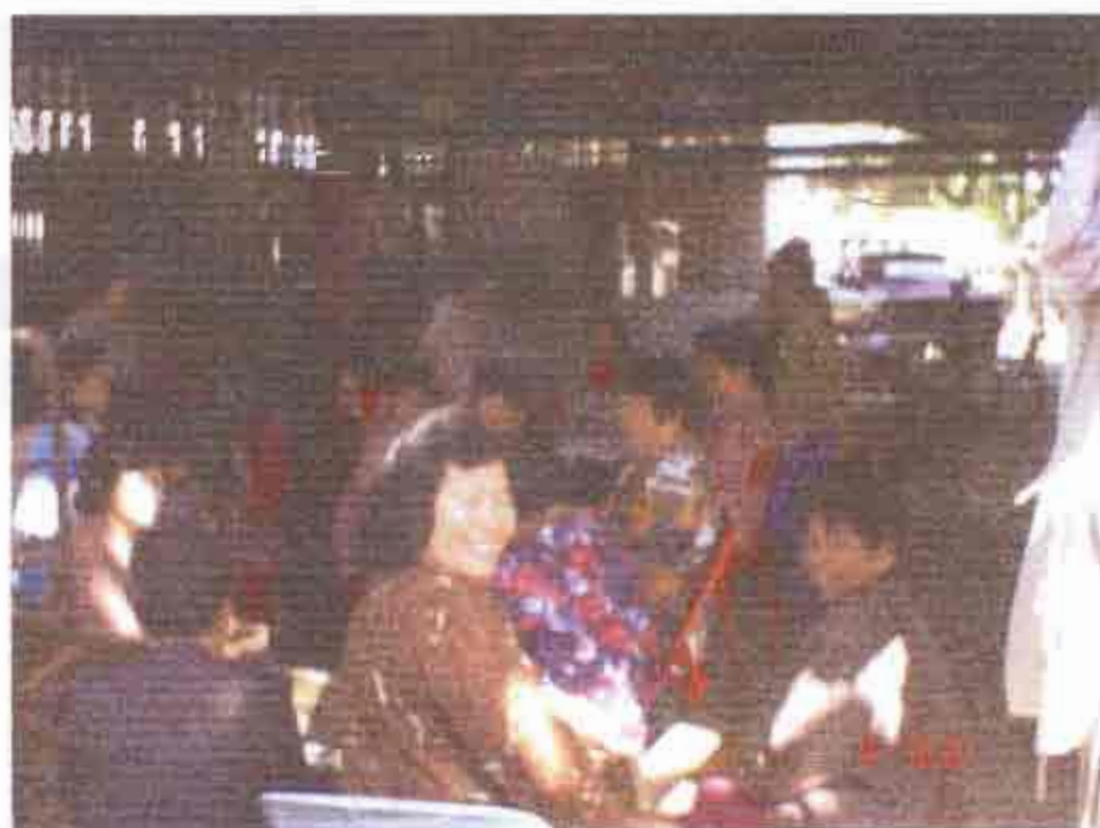
ช่วงเวลาพักของสมาชิกในกิจกรรมถ่ายทอดประสบการณ์จากการศึกษาดูงาน