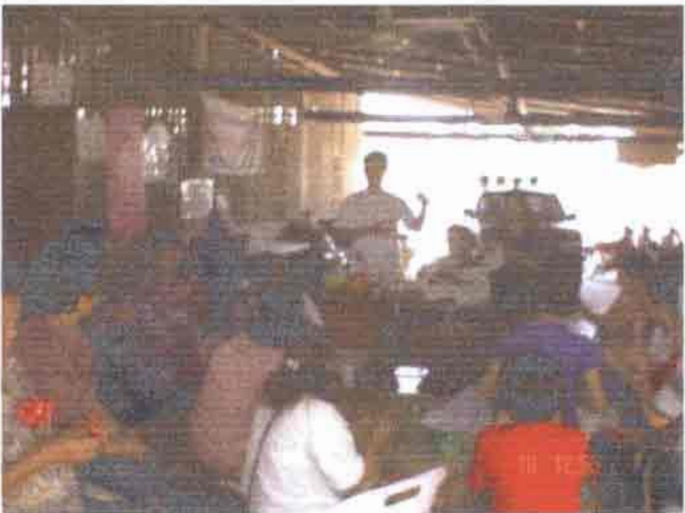
กิจกรรมการส่งเสริมทักษะภายในกลุ่มด้านการบรรจุหีบห่อให้ทันสมัยและสวยงาม