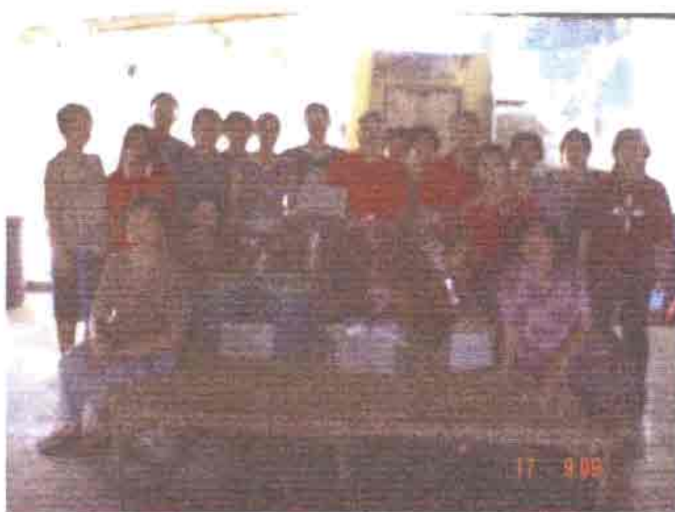
กิจกรรมการส่งเสริมทักษะภายในกลุ่มด้านการบรรจุหีบห่อให้ทันสมัยและสวยงาม