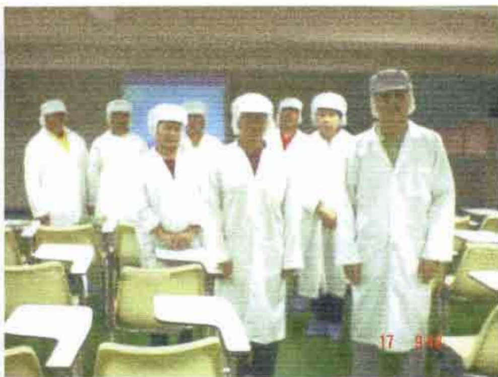
ทีมวิจัยและสมาชิกกลุ่มเข้าศึกษาดูงานของบริษัทโกลโบ ฟู้ดส์ จำกัด ที่กรุงเทพมหานคร