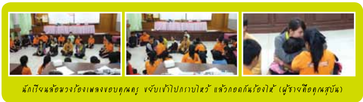
นักเรียนล้อมวงร้องเพลงขอบคุณครู จับเข้าไปกราบไหว้ แล้วกอดกันร้องไห้ (ผู้ข้างคือคุณสุบัน)

ครูและนักเรียนมาพบกันอีกครั้งหนึ่ง จึงทราบว่าพี่เลี้ยงให้นักเรียนเขียนจดหมายถึงครูที่เห็นครูร้องไห้ 2 ครั้งแล้ว เมื่อครูมาถึง นักเรียนบอกความในใจด้วยการร้องเพลงให้ แล้วภาพต่อจากนั้นคือทั้งครูและนักเรียนก็กอดกันร้องไห้ เป็นกลุ่มใหญ่