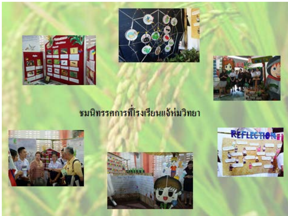
ชมนิทรรศการที่โรงเรียนแจ้ห่มวิทยา

๓) กระบวนการเรียนรู้จากการเสวนากลุ่มย่อยและ Reflection จากผู้ทรงคุณวุฒิ จากการร่วมกิจกรรมกระบวนการเรียนรู้จากการเสวนากลุ่มย่อย ๑๐ กลุ่มย่อย ได้รับ ข้อเรียนรู้ดังนี้