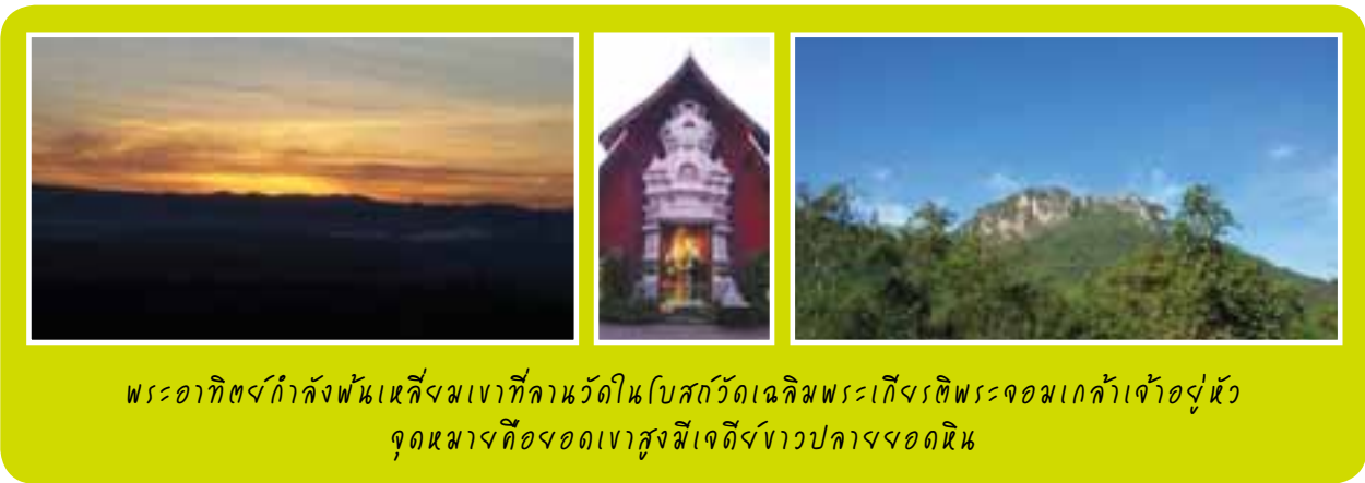
พระอาทิตย์กำลังพ้นเหลี่ยมเขาที่คานวัดโบสถ์วัดเฉลิมพระเกียรติพระจอมเกล้าเจ้าอยู่หัว จุดหมายคือยอดเขาสูงมีเจดีย์ขาวปกคลุมยอดนี้

วันจันทร์เราออกตั้งแต่ 6 โมงเช้า ฟ้ายังมืดอยู่ ได้เห็นแสงทองขอบฟ้าระหว่างทางขึ้นเขาไปวัดเฉลิมพระเกียรติ พระจอมเกล้าเจ้าอยู่หัว ( https://www.youtube.com/watch?v=laJrZ0g_TSg ) เราไปถึงวัดเมื่อสว่างแล้ว เข้ากราบพระประธาน ออกไปที่ลานข้างโบสถ์ ชมวิวทุ่งนาและเทือกเขาจากมุมสูง แสงสีทองจับขอบฟ้าที่มีเทือกเขาเป็นฉากกัน พระอาทิตย์ยังไม่ทันพ้นเหลี่ยมเขา ก็มีเสียงเรียกให้ออกมาขึ้นรถ เมื่อเดินออกมาด้านนอกได้เห็นเจดีย์ขาวๆ จำนวนมากตั้งอยู่บนยอดเขาสูงลิบ นึกชมว่าช่างเป็นศรัทธาของชาวแจ้ห่มที่ขนอุปกรณ์ขึ้นไปสร้างไว้ ไม่ได้นึกเลยว่านั่นคือสถานที่ที่เราจะเดินทางขึ้นไปจนถึง การเดินทางช่วงต่อจากนี้ต้องใช้รถกระบะขับเคลื่อน 4 ล้อป้ายแดงใหม่เอี่ยม (เข็มไมล์ยังไม่ถึง 300 กม.) ที่ทางวัดจัดให้ ทางขึ้นเขาแคบ โค้ง และชันเป็นทางยาว ผมนั่งคู่คนขับสังเกตเห็นว่าเขาไม่ยอมใช้ระบบขับเคลื่อน 4 ล้อเลย ใช้จิ้งหะเร่งเครื่องพุ่งทะยานขึ้นเนินที่ทั้งชันและแคบเลียบหน้าผา บางคราวเปลี่ยนเกียร์กลางทางชัน เขาต้องใช้เทคนิค “เลี้ยงคลัตช์” จนกลิ้งใหม่เข้ามาในห้องโดยสาร มันจึงทำให้ผมนั่งภาวนาด้วยความหวาดเสียว แต่ก็วางใจว่าเขาน่าจะรู้ทางจึงกล้าขับแบบนี้ คนนั่งกระบะหลังจับราวกระบะกันแน่น รถมาจอดส่งที่พักรถดอยผาหมอกเพื่อให้พวกเราเดินเท้ากันต่อ ขึ้นไปยังยอดดอยที่มองเห็นลิบๆ อยู่ฉากหลัง