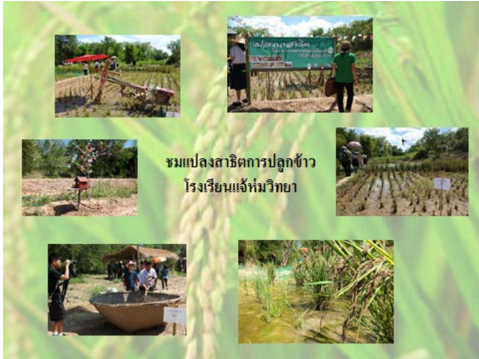
ชมแปลงสาธิตการปลูกข้าว โรงเรียนแจ้ห่มวิทยา