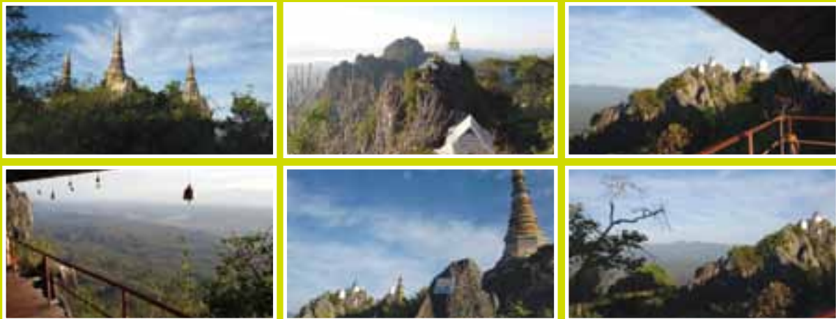
ทัศนียภาพของดอยผานมอกเห็น 360 องศา เป็น 1 ใน 10 Unseen Thailand

ทางเดินขึ้นยอดดอยค่อนข้างสะดวกเพราะเป็นหน้าหนาว ดินแห้ง เส้นทางส่วนมากได้รับการปรับปรุงให้เดินง่าย ด้วยทางเดินโครงเหล็ก เดินบ้าง พักบ้างประมาณ 30 นาทีก็หายเหนื่อยเมื่อเห็นธรรมชาติเบื้องล่างจากยอดดอย เมื่อเทียบกับศรัทธาผู้คนที่ขวนขวายขึ้นมาก่อสร้างแล้ว การเดินขึ้นของผมเป็นเรื่องเล็กน้อยเหลือเกิน อากาศเย็นสบาย ท้องฟ้าโปร่งมองเห็นทัศนียภาพเบื้องล่างได้ 360 องศา เราทานข้าวเหนียวหมูปิ้งเป็นอาหารเช้าที่ศาลาริมหน้าผา ซึ่งมีค่าเตือนว่าอาคารเหล่านี้ไม่ได้รับการรับรองจากวิศวกร จึงไม่รับรองความปลอดภัย ผมไม่ใช่วิศวกรโยธา แต่ด้วยตรรกะว่าศาลานี้ น่าจะเคยบรรทุกคนจำนวนมากก่อนหน้านี้แล้ว ดังนั้น พวกเราไม่ถึง 10 คนไม่น่ามีปัญหาอะไร ความจริงแล้วเสี่ยงน้อยกว่าการนั่งรถขึ้นเขาเสียอีก เมื่อเราทราบความจริงบางอย่าง ที่เฉลยว่าทำไมคนขับไม่ใช้ระบบ ขับเคลื่อน 4 ล้อ และคลัตช์ใหม่