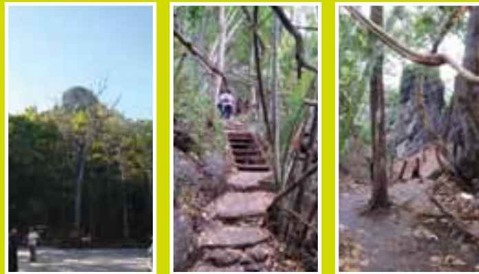
ทางยอดดอยผานมอก เห็นยอดที่จะขึ้น และทางขึ้นดอย

ทางเดินขึ้นยอดดอยค่อนข้างสะดวกเพราะเป็นหน้าหนาว ดินแห้ง เส้นทางส่วนมากได้รับการปรับปรุงให้เดินง่าย ด้วยทางเดินโครงเหล็ก เดินบ้าง พักบ้างประมาณ 30 นาทีก็หายเหนื่อยเมื่อเห็นธรรมชาติเบื้องล่างจากยอดดอย เมื่อเทียบกับศรัทธาผู้คนที่ขวนขวายขึ้นมาก่อสร้างแล้ว การเดินขึ้นของผมเป็นเรื่องเล็กน้อยเหลือเกิน อากาศเย็นสบาย ท้องฟ้าโปร่งมองเห็นทัศนียภาพเบื้องล่างได้ 360 องศา เราทานข้าวเหนียวหมูปิ้งเป็นอาหารเช้าที่ศาลาริมหน้าผา ซึ่งมีค่าเตือนว่าอาคารเหล่านี้ไม่ได้รับการรับรองจากวิศวกร จึงไม่รับรองความปลอดภัย ผมไม่ใช่วิศวกรโยธา แต่ด้วยตรรกะว่าศาลานี้ น่าจะเคยบรรทุกคนจำนวนมากก่อนหน้านี้แล้ว ดังนั้น พวกเราไม่ถึง 10 คนไม่น่ามีปัญหาอะไร ความจริงแล้วเสี่ยงน้อยกว่าการนั่งรถขึ้นเขาเสียอีก เมื่อเราทราบความจริงบางอย่าง ที่เฉลยว่าทำไมคนขับไม่ใช้ระบบ ขับเคลื่อน 4 ล้อ และคลัตช์ใหม่