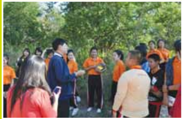
อธิบายเรื่องการเผาถ่านให้เป็น RBL ได้อย่างไรกับครูและนักเรียน

การเปลี่ยน carbon dioxide (CO 2 ) ให้เป็นต้นไม้และเกิดองค์ประกอบของไม้ คือ วิชาชีววิทยาผสมกับเคมี (biochemistry)