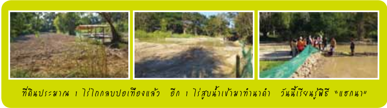
ที่ดินประมาณ ๑ ไร่ไถกลบปอเทืองแล้ว อีก ๑ ไร่สูบน้ำเข้ามาทำนาดำ วันนี้เรียงหญ้าพิธี “แฮกนา”

เมื่อน้ำตาแห้ง ก็ได้เวลาลงแปลงนาของนักเรียน ผมแทบไม่เชื่อสายตาที่เห็นหญ้ารกสูงท่วมหัวอยู่โดยรอบแปลงนาขนาดพื้นที่ประมาณ 2 ไร่ เพราะพงหญ้าสูงบังซึ่งสภาพเดิมที่นักเรียน 29 คนลงแรงเปลี่ยนให้กลายเป็นนาตัวเอง ไม่น่าเชื่อว่าเป็นฝีมือของนักเรียนห้อง smart science ที่น่าจะมี learning style แบบเรียนในห้อง ไม่ใช่เรียนจากการลงมือทำหรือใช้แรง ประมาณ 1 ไร่ยกทรงเป็นแปลงย่อยเพื่อทดลองทำนาตัวเอง แปลงนามีน้ำขังพร้อมทำพิธี “แฮกนา” อีก 1 ไร่เป็นดินเหนียว พวกเขาปลูกปอเทืองและไถกลบแล้ว