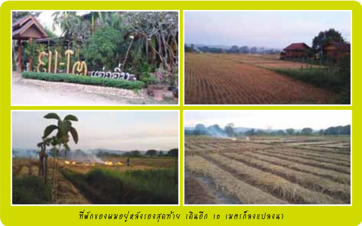
ที่พักของผมอู่หลังรองสุดทาง เดินอีก 10 เมตรก็ลงแปลงนา

วันจันทร์เราออกตั้งแต่ 6 โมงเช้า ฟ้ายังมืดอยู่ ได้เห็นแสงทองขอบฟ้าระหว่างทางขึ้นเขาไปวัดเฉลิมพระเกียรติ พระจอมเกล้าเจ้าอยู่หัว ( https://www.youtube.com/watch?v=laJrZ0g_TSg ) เราไปถึงวัดเมื่อสว่างแล้ว เข้ากราบพระประธาน ออกไปที่ลานข้างโบสถ์ ชมวิวทุ่งนาและเทือกเขาจากมุมสูง แสงสีทองจับขอบฟ้าที่มีเทือกเขาเป็นฉากกัน พระอาทิตย์ยังไม่ทันพ้นเหลี่ยมเขา ก็มีเสียงเรียกให้ออกมาขึ้นรถ เมื่อเดินออกมาด้านนอกได้เห็นเจดีย์ขาวๆ จำนวนมากตั้งอยู่บนยอดเขาสูงลิบ นึกชมว่าช่างเป็นศรัทธาของชาวแจ้ห่มที่ขนอุปกรณ์ขึ้นไปสร้างไว้ ไม่ได้นึกเลยว่านั่นคือสถานที่ที่เราจะเดินทางขึ้นไปจนถึง การเดินทางช่วงต่อจากนี้ต้องใช้รถกระบะขับเคลื่อน 4 ล้อป้ายแดงใหม่เอี่ยม (เข็มไมล์ยังไม่ถึง 300 กม.) ที่ทางวัดจัดให้ ทางขึ้นเขาแคบ โค้ง และชันเป็นทางยาว ผมนั่งคู่คนขับสังเกตเห็นว่าเขาไม่ยอมใช้ระบบขับเคลื่อน 4 ล้อเลย ใช้จิ้งหะเร่งเครื่องพุ่งทะยานขึ้นเนินที่ทั้งชันและแคบเลียบหน้าผา บางคราวเปลี่ยนเกียร์กลางทางชัน เขาต้องใช้เทคนิค “เลี้ยงคลัตช์” จนกลิ้งใหม่เข้ามาในห้องโดยสาร มันจึงทำให้ผมนั่งภาวนาด้วยความหวาดเสียว แต่ก็วางใจว่าเขาน่าจะรู้ทางจึงกล้าขับแบบนี้ คนนั่งกระบะหลังจับราวกระบะกันแน่น รถมาจอดส่งที่พักรถดอยผาหมอกเพื่อให้พวกเราเดินเท้ากันต่อ ขึ้นไปยังยอดดอยที่มองเห็นลิบๆ อยู่ฉากหลัง