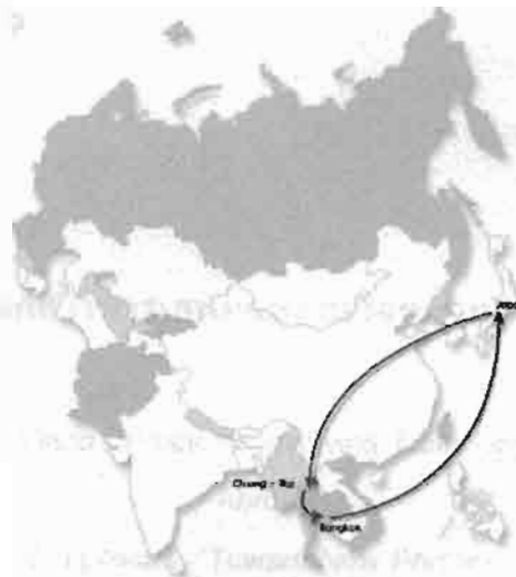
The Migration and Reintegration Route

Research Methodology: The study drew upon a variety of sources, which included published documents, other secondary sources, and in-depth interview with key informants, especially Thai women returning from Japan. This research was conducted in Chiang-Rai, the northern province of Thailand which most of Thai women were trafficked into sex trade in Japan.